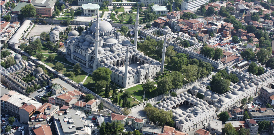
Resim 3. Süleymaniye Külliyesi.

ri'de Vakıf İzleri" konulu bildirisini zengin görsel içerikle birlikte sunmuştur.