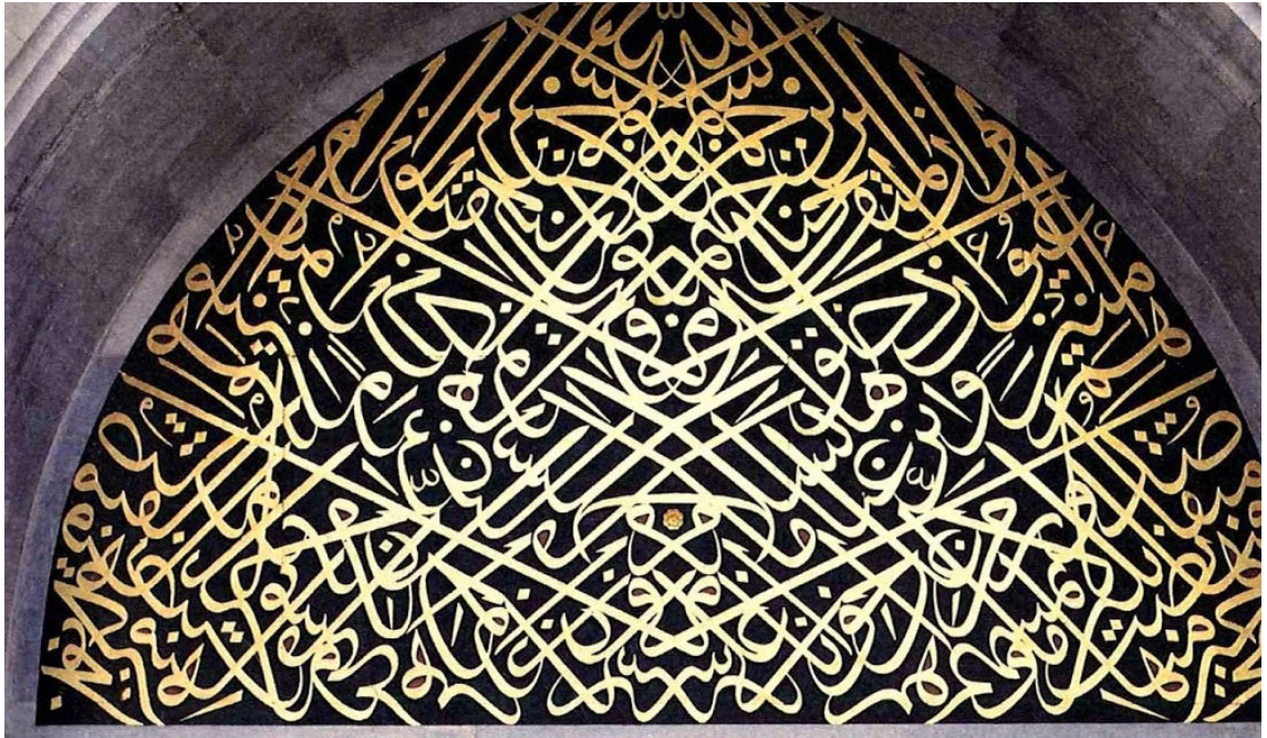
Resim 2. Topkapı Sarayı giriş kapısı üzerindeki müsenna celi sülüs yazı.

Dedikten sonra malını neden vakfettiğini yine şiirsel bir ifadeyle anlatmaktadır.