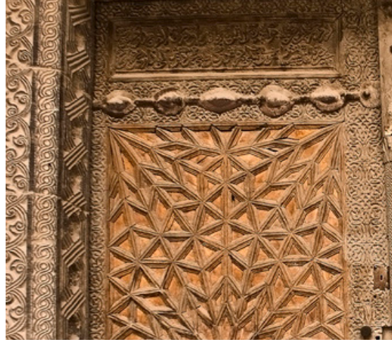
Resim 4. Niğde Sungur Bey Camiinin künde kari kapısı.

9. yüzyıl Samarra İslam Sanatının kilit noktalarından birisidir. Abbasi Halifesi Türkler için bir şehir kurduğunda yalnızca askerler gelmiyor o şehre, askerler yanında ilim adamları, sanatkarlar ve kültür adamları da geliyor. O şehir işte bunun İslam coğrafyasına yayılmasına vesile olan şehirdir. Emevi sanatıyla Abbasi sanatı arasında neredeyse bağlantı yoktur. Her şey bu şehre yerleşen Türklerin etkisiyle başlamıştır.