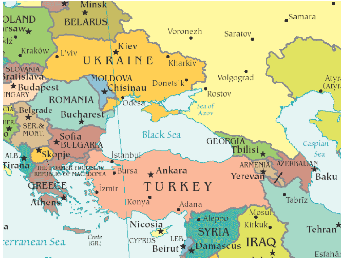
Harita 1: Karadeniz Bölgesi Devletleri