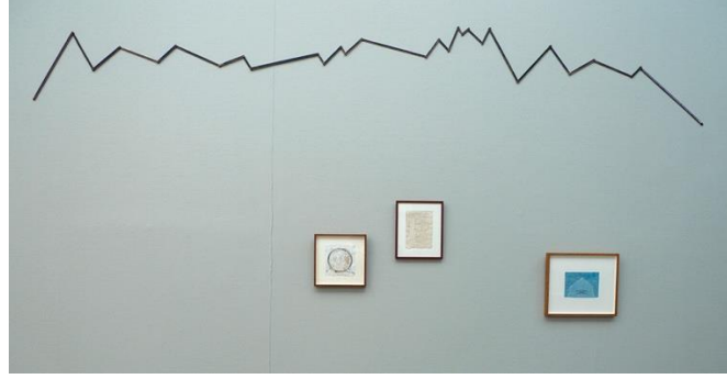
Görsel 2. Hamish Fulton, Trekking in Time.

Yürüme eylemini bir çağdaş sanat pratiği olarak yorumlayan Hamish Fulton (1946), İngiltere'de kent ve çevresinde yaptığı on dört günlük yolculuğunu psikocoğrafi bağlamda gerçekleştirmiştir. Sanatçı, gündelik hayatta yürüme halini antropolojik bir çerçeve içinde anlamakla ilgilenmiştir. Sergileme tasarımına yürüyüşünün dinamik bir temsilini de ekleyen sanatçı Psikocoğrafya yönteminin doğrudan örneklerinden birini sunmuştur.