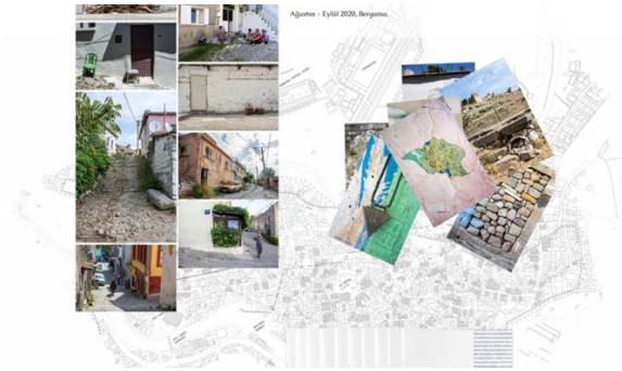
Görsel 3. Bir Mahallenin Keşfi: Kale Projesi, Sarı Denizaltı Sanat İnisiyatifi

Psikocoğrafi yaklaşım, kişisel rotaları, kentin bileşenleriyle etkileşimli bir biçimde keşfetmek ve görünmeyeni somutlaştırmak adına bir pratik ortaya koymaktadır. Bu bağlamda fotoğraf, öznel ifadesi ve zamansallıkla ilgili üretim faaliyeti olması dolayısıyla sürüklenmeyi cazip hale getirmektedir. 2020 Yılında İzmir, Bergama’da gerçekleştirilen Psikocoğrafya Atölyesinde ‘Bir Mahallenin Keşfi: Kale’ adlı proje çalışması gerçekleştirilmiştir. Yine projede yer alan farklı disiplinlerden sanatçılar, yürüyüş deneyimlerini bilişsel ve öznel haritalar perspektifinde sunmuşlardır.