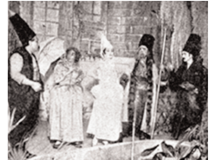
1924'te Yorgaki Dandini

Böylece, başlangıçta yeni ve meraklı bir gösteri biçiminde ilgi toplayan Modern Tiyatro, giderek seyircilerin kendi kendilerini eğlendirdikleri bir seyir yeri özelliği kazandı. Batı yanlısı bu özenli ahlak okulu geniş kitlelerce pek ciddiye alınmıyordu. O zamanki gazetelerden edindiğimiz bilgiler bunu doğrulamaktadır. Tiyatroların içinde çeşitli nedenlerle kavga, gürültü eksik olmamaktadır. Olağan seyirci tepkisini aşan, ıslık çalma, bağırma, sahneye laf atma gibi davranışlar sıkça görülmektedir. Tiyatro topluluklarının bu olumsuz koşulları bir yoluna koymak için büyük çaba harcadıkları anlaşılmaktadır. Yönetmelikler, uyarılar, kılavuzlar yayınlanıyor; el ilanlarında ricalar ediliyor, seyircilerin salona silah, değnek, şemsiye sokmaları; içkili olarak tiyatroya gelmeleri; yanlarında küçük çocuk getirmeleri; sigara içme-