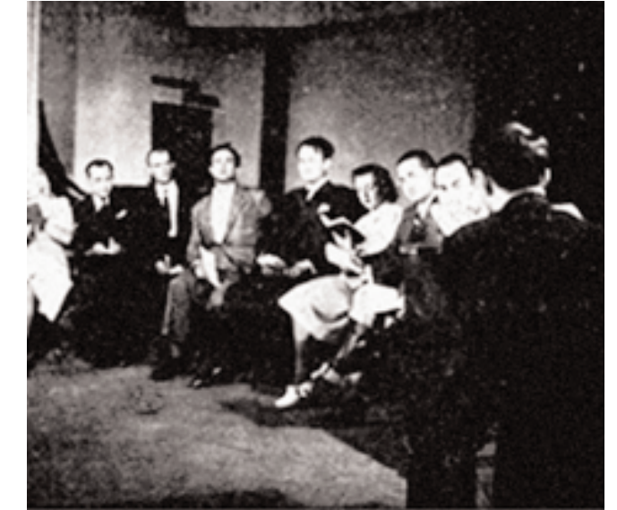
Kabul edilen piyes suflör tarafından sanatçılara okunarak rol defteri kontrol ediliyor

Tiyatro ortamının olumsuz koşullarından, en zorlu sıkıntılardan biri de 'sansür' konusudur. Meclis-i Mebusan'ın açıldığı 1877'den II. Meşrutiyet'in ilanına kadar geçen 31 yıllık dönemin Türk Tarihi içindeki adı; İstipdat Dönemi'dir. Sözcüklerin en uzak çağrışımlarına kadar inen bir sansür anlayışı, ilk adımlarını henüz atmakta olan Modern Tiyatro yaşa-