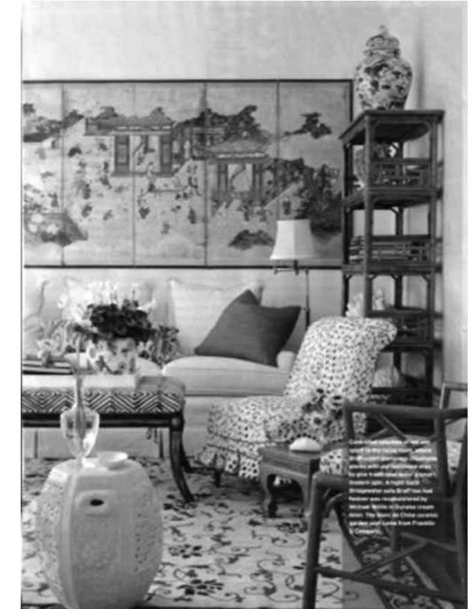
Resim 11: İç mekan dekorasyonunda Çin etkileri (http://www.gaitainteriors.com/blog/?p=1720)

XVIII. yy'da, İngiliz baskılı kumaşları oldukça çeşitli desenleri içeriyordu. Bunlardan biri Pagodalarla süslenmiş, Çinli figürleri, hayvanları, kuşları ve tuhaf şekilli taş desenleri bulunan chinoiserie tarzı kumaştı. Chinoiserie tarzı desenler, bakır plaka baskı tekniği ile hayat bulmuştu. Bunun yanında birçok resimsel ifadeler, mimari ayrıntılar, av sahneleri, hayvanlar, çeşitli figürler, kuşlar, ağaçlar ve bazen bunların Çin pagodaları ve kuşları ile olan bileşiminden oluşmuş desenler kullanılmaktaydı. Bu desenler, dokuma duvar resimlerinde (tapestry) olduğu gibi kumaşlarda da görülüyordu.