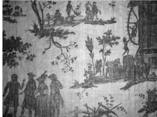
Resim 1: Chinoiserie, 1780, Morgaine le Faye ( http://trouvais.com/category/antique-fabric/ )