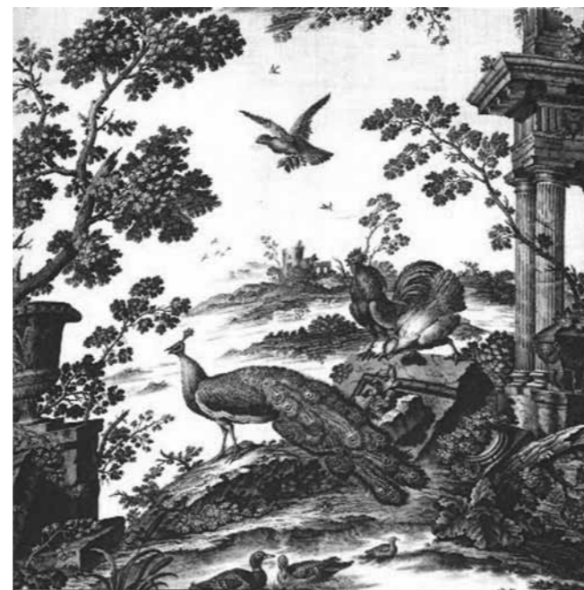
Resim 4: Döşemelik kumaş, bakır plaka baskı, Robert Jones & Co, 1761, Victoria & Albert Museum

dan geliştirilen, keten ve pamuk baskılar, orta sınıf ev dekorasyonunda oldukça fazla etkili olmuş, hatta sınıf atlamak için bu kumaşlardan yapılan giysilerin oluşturduğu ikinci el pazarları kurulmuştur (5).