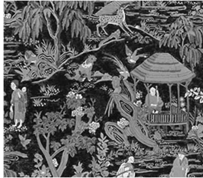
Resim 9: Fishing Village-black, Pas dokulu duvar kağıdı, Thibaut.

Duvar kâğıdı fabrikası Reveillon de Paris, Versay (Versaille) yakınlarındaki Jouy kumaş baskı fabrikası ile iş birliği içinde çalışarak kumaş baskısında kullanılan desenleri, duvar kâğıdına basıyordu. Bunlar çok renkli veya tek renkli baskılar şeklinde, Hint çiçeklileri, fantastik kayalık desenleri olarak basılıyordu. Çinlilerdeki gibi kıvrık çatılı küçük köşkler veya bahçe kulübeli, yakıcı havadan korunmak için şemsiyeler vb. gerçek ile düşsel unsurlar birbirine karışmış halde idi.