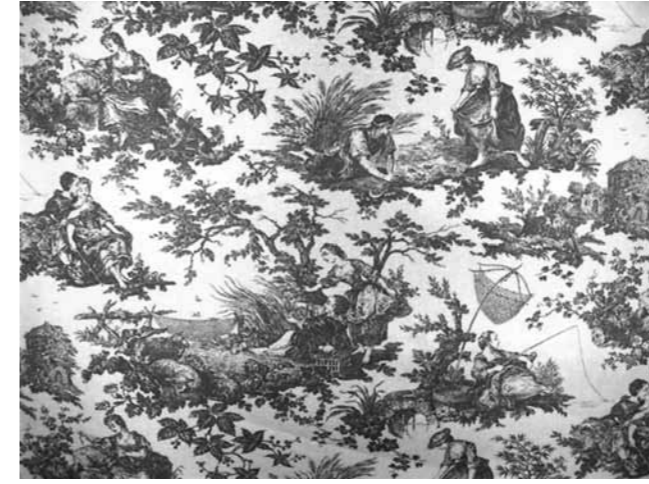
Resim 5: Duvar Kağıdı. Laura Ashley "Simple Pleasures" Toile in Crimson.

Fransa'da 1665 yılında, dokuma ticaretini, çalışma usullerini ve kumaş kalitesini etkileyen düzenlemeleri yapan Ekonomi Bakanı Jean Baptiste Colbert tarafından tekstil üretiminin temel sistemi geliştirilmiş, aynı dönemde Fransa'ya sayısız çeşitte indienne denilen Hint chintzleri ithal edilmiştir.