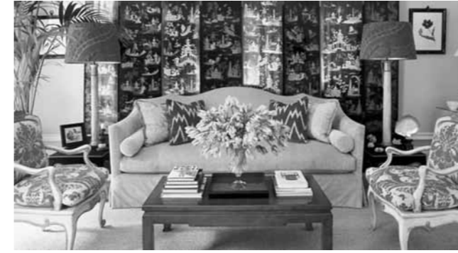
Resim 10: Çin etkisi taşıyan panel

Etkisini yüzyıl boyunca sürdüren chinoiserie 'in uzun bir aradan sonra, ilk örnekleri 1830'lu yıllarda Rokoko ile tekrar görülmeye başlamıştır. Çin tarzı duvar kâğıtları 1860'ların tekrar eden motifleri için bir esin kaynağı olmuştur. Bu tasarımlarda konturlanmış dallar, çiçeklenmiş bambular kuşlarla tamamlanmış, vazolar kullanılmış, XIX. yy'ın ikinci yansından itibaren ise chinoiserie , Japonizm etkisi ile rekabet etmek durumunda kalmıştır. Aslında, başından itibaren bazı karakterlerin giysilerinde olduğu gibi Japon süsleme unsurlarını da içinde barındıracak şekilde her iki ulusun etkisini taşıyordu. Bazen bitki