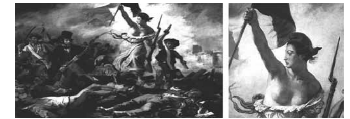
Resim 12: "La Liberté (Marianne) guidant le peuple", Eugène Delacroix, 1830

nın onunla dans etmekten ibaret olduğu fikrini yansıtan "Ölüm Dansı" figürleri de bu dönemde ortaya çıkmıştır. İlk örneklerine 1424 yılında Paris'teki Cimetière des Innocents / Masumlar Mezarlığı'nın duvarlarında rastlanan bu figürler sonraki yıllarda 'Ölüm ve Bakire' tasvirlerinin doğuşuna yol açmıştır. Bu tasvirlerde, hâkim figür olan iskeletler, genç, güzel ve çoğunlukla çıplak kızlarla birlikte resmedilmişlerdir.