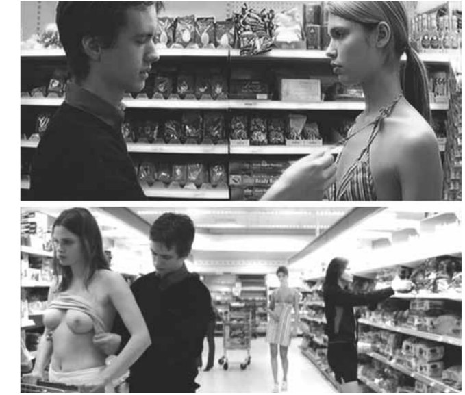
Resim 16-17: Cashback filminden kareler.

Filmde erkek, kadın bedenine, resmetmeye değer sanatsal bir malzeme, bir nesne olarak yaklaşmaktadır; çünkü bu form karşısında büyülenmekte, ona bakmaktan zevk duymaktadır. Filmdeki kadınlar ise heykel gibi hareketsiz haldedirler ve çıplaklıklarının farkında değildirler. John Berger'e göre " Çıplak olmak insanın kendisi olmasıdır. Nü olmaksızın başkalarına