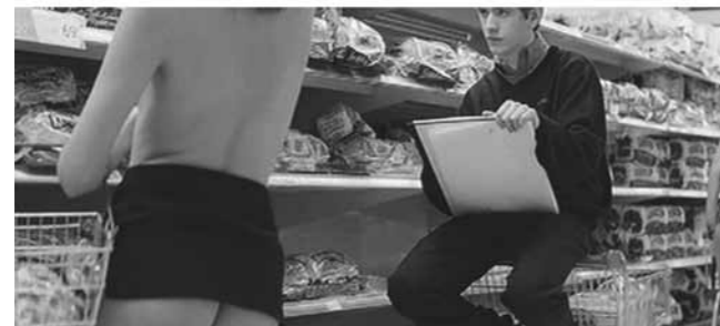
Resim 1-2-3-4: Cashback filminden kareler.

Filmin kahramanı Ben'e göre, kadınların bedenleri Rönesans resim sanatının mükemmel örnekleri gibidir. Onlara bakışındaki hayranlık, natüromort çizen bir ressamın nesnelere algılayışından farklı değildir.