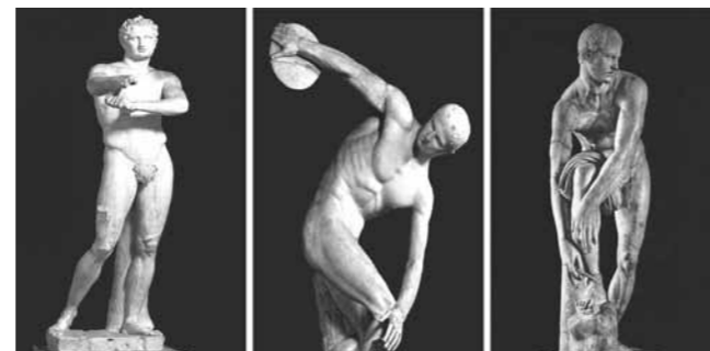
Resim 5: "Apoxyomenos", Lysippos

Bedenin nesneleştirilmesi, resim sanatının yeniden doğuşunu simgeleyen Rönesans'ın bir getirisidir. Özellikle, on beşinci yüzyıldan itibaren, İtalya'da ve öncelikle Floransa'da, sanatçılar arasında, insan bedenini tanımak ve klasik çağ Yunan sanatçılarına bile geçerek, bedeninin gerçek niteliklerini ve estetiğini yapıtlarında yansıtmak amacıyla giderek yoğunlaşan bir ilgi oluşmuştur. 5 Rönesans'ın aynı zamanda, "kadın bedeninin arzu nesnesi olarak" keşfi olduğunu söylemek de mümkündür. Daha önceleri, örneğin Antik Yunan'da, "vücut ısı" gibi bir sebepten dolayı kadından daha mükemmel olduğu savunulan erkek