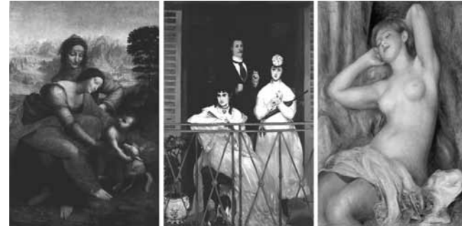
Resim 13: "Virgin and Child", Leonardo da Vinci, 1502

Rönesans'la birlikte kadın bedeninin arzulanırlığı meşrulaşmış olsa da diğer yandan anaç bir figür olarak yüceltilmesi de hala söz konusudur. Rousseau'nun Emile adlı eserinde yer alan " Sophie'nin akan göğüsleri erdeminin kanıtlarıydı " 9 cümlesi buna dikkat çekmektedir. Fransız Devrimi sırasında devrimci amblemlerdeki ideal yurttaş sureti olan, bereketi ve