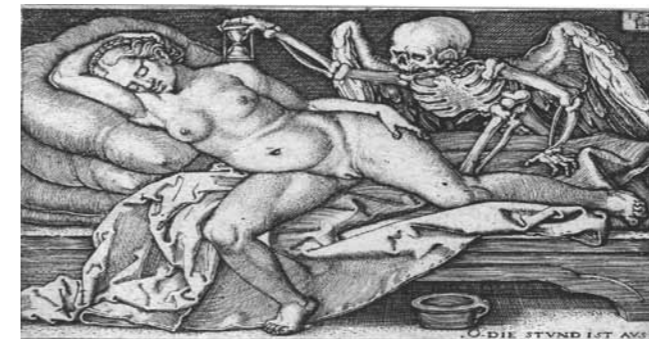
Resim 11: Hans Sebald Beham, 1548

nın onunla dans etmekten ibaret olduğu fikrini yansıtan "Ölüm Dansı" figürleri de bu dönemde ortaya çıkmıştır. İlk örneklerine 1424 yılında Paris'teki Cimetière des Innocents / Masumlar Mezarlığı'nın duvarlarında rastlanan bu figürler sonraki yıllarda 'Ölüm ve Bakire' tasvirlerinin doğuşuna yol açmıştır. Bu tasvirlerde, hâkim figür olan iskeletler, genç, güzel ve çoğunlukla çıplak kızlarla birlikte resmedilmişlerdir.