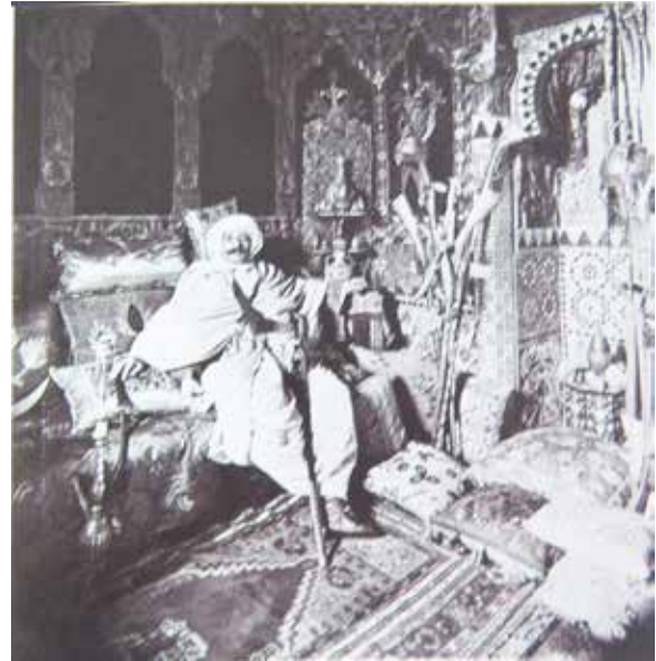
Fotoğraf 1. Pierre Loti, 'Rochefort-sur-Mer'deki evinde' (Day, 2003: 92).

Binbir Gece Masalları'nın Antonie Galland (1704-1717) tarafından Fransızca'ya çevrilmesinden kısa bir süre sonra Montesquieu İran Sarayı'nda geçen bir masalın anlatıldığı Lettres Persanes 'i yayınlamıştır. İstanbul'da görevlendirilen İngiliz elçisinin eşi ve hareme davet edilen ilk Avrupalı olan Lady Mary Wortley Montagu'nun mektupları ölümünden sonra 1763'de yayınlanmıştır. Napolyon, 1798'deki Mısır seferi sırasında tüm gördüklerini kaydetmek üzere yanına bilim adamları ve sanatçılar almıştır. Yapılan bu bilimsel yayınlar ve edebi eserler ressam, yazar ve müzisyenlerin hayal gücünü harekete geçirmiştir. Gustave Flaubert'in, Kartaca'da geçen eseri 'Salambo' kendisinin 1858 yılında Tunus'a yaptığı ziyaret sırasında elde ettiği bilgileri içermektedir. Pierre Loti (1850-1923) Doğu'yu Fransız deniz kuvvetlerinde görevli bir subay iken keşfetmiştir. Loti, Doğulu erkeklerin giyim tarzını benimseyerek Rochefort-sur-Mer'deki evini Doğu saraylarına benzetmiş, evinin dekorasyonunda çok sayıda Doğu halısı ve kumaşı kullanmıştır. Fotoğraf 1'de Loti 1901 yılında Rochefort-sur-Mer'deki evinde görülmektedir (Day, 2003: 92-94).