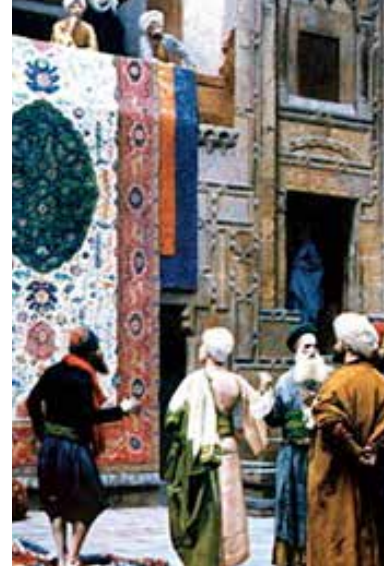
Resim1. Jean-Leon Gérôme (1824-1904), 'Kahire'deki Halı Tüccarı'.