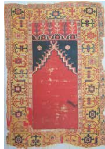
Fotoğraf 3. Konya Lâdik Halısı, 110 cmx161 cm, Türk İslam Eserleri Müzesi (Turkish Handwoven Carpets, Katalog 3, 1990: code.0298).