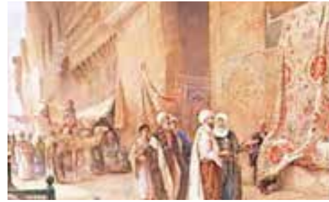
Resim 2. Charles Robertson, 'Halı Satışı, Kahire'.

Ressam Rudolf Ernst’in (1854-1932) Flower Seller (Çiçek Satıcısı) adlı tablosu özel bir koleksiyonda bulunmaktadır. Eserde kapının hemen yanında bulunan kerevetin üstüne bırakılmış bir Konya halısı dikkati çekmektedir (Resim 3). Tabloda resmedilmiş olan halının bir benzeri (Fotograf 2) günümüzde İstanbul Türk İslam Eserleri Müzesi’nde bulunmaktadır. Halı 150 cm x 202 cm boyutlarında olup çözgü, atkı ve ilmesi yündür. Her iki halının zemininde ve ana bordüründe kullanılan motifler birbiri ile aynıdır. Ana bordürde bitkisel motifler kullanılmış, zeminde ise göbekli bir kompozisyon tercih edilmiştir. İnce bordürler aynı olmamasına