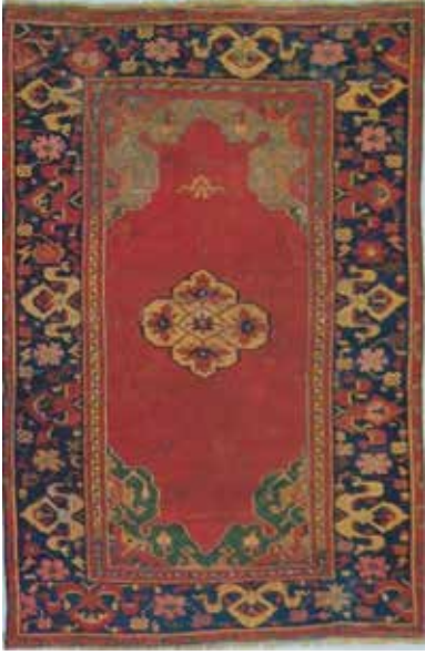
Fotoğraf 7. Küçük Madalyonlu Uşak Seccade Halısı (Walter B. Denny, 2002: 83).