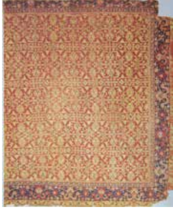
Fotoğraf 5. Uşak Halısı, (Turkish Handwoven Carpets, Katolog 4, 1990: code:0320).

Giulio Rosati'nin 'Köle Pazarında Yeni Gelen Köleleri İncelerken' adlı bu eserinin (Resim 7) günümüzde nerede olduğu bilinmemektedir. İpe asılı olarak resmedilmiş halılardan biri madalyonlu Uşak halısıdır. Madalyonlu Uşak halılarında sonsuz örnek halinde sıralanmış madalyonlardan kesilmiş kompozisyon düzeni görülmektedir. (Aslanapa, 1987: 107, Yetkin, 1991: 88). Bu halılarda genel olarak madalyonların içi kıvrık dallar, bahar çiçekleri, birbirine dolanmış bitkiler, Osmanlı süsleme sanatlarında rastlanılan lale, karanfil, rumi, hatayi, penç, gonca ve bulut desenleri ile süslenmiştir (Deniz, 2000: 34).