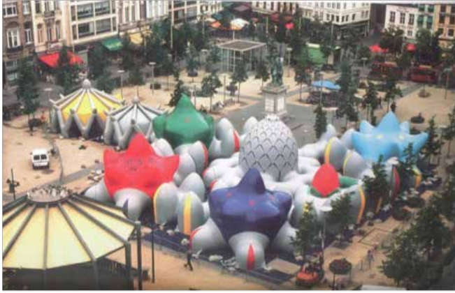
Resim 5. Architects of Air, 'Archipelago in Antwerp' (Antwerp'teki Takimadalar), 1999.

layan tekstiller grubuna örnek gösterilebilir. Bugün mimari alanı, cam elyafı ve polyester gibi birçok geliştirilmiş malzeme mekanların temel yapı elemanı olarak kullanırken aynı zamanda, transparan yapılarıyla ışık ve ısıdan yararlanma noktasında da avantaj sağlayan bu yapılar ile çözüm odaklı öneriler sunmaktadır. Tekstil-mekan ilişkisi, görsel algıdaki baskın tasarım öğesi açısından değerlendirildiğinde bu gruptaki tekstillerde biçim- malzeme birlikteliği dikkat çekicidir.