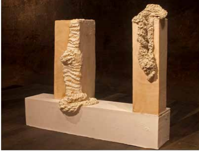
Resim 8. 'İsimsiz', 'Doku'nuşlar' Tekstil Sergisi, 2013.

Resim 7 ve 8'de yer alan işlerin mekan ile ilişkisi tek tek değerlendirildiğinde; mekan ile ilişki kurmada benzerlikler gözlenmekle birlikte, her bir işin biçim, doku, ışık, gölge, malzeme ve sergilenme şekli mekan ile etkileşimde farklı ayrıntılar içermektedir. Doku ve malzeme birlikteliği öne çıkarken, biçimlerin heykelimsi yapıları da işleri algıda mekana baskın kılan özellik olarak ifade edilebilir. Tek başına her bir iş daha çok mekandan etkilenen tekstiller grubuna dahil edilebilir.