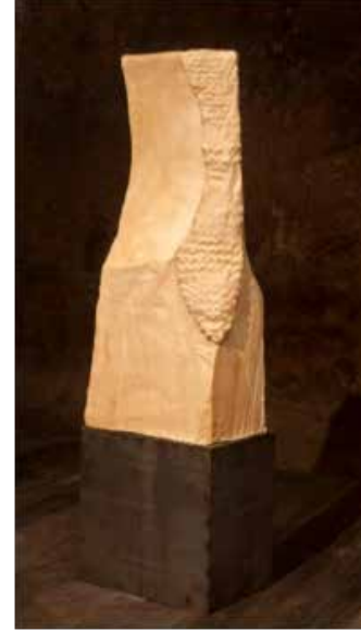
Resim 9. 'İsimsiz', 'Doku'nuşlar', 2013.

her aşamada planlanmıştır. Resim 9 ve 10'da görüldüğü gibi tekstil işlerin rengi, mekan ile bütünleşmesi hedeflenerek aynı tonlarda tasarlanmış, seçilen renk, mekanın etkisinden dolayı neredeyse tasarımın belirleyici ilk öğesi olmuştur. Sarnıcın duvarlarındaki doğal dokular, renkler, sütunlar ve ahşap zeminin algıdaki sıcak etkisi mekanla bütünleşirken tekstil işlerde bu doğallıktan beslenen bir zıtlık göze çarpar. Metal malzemelerin geometrik formlarda kullanımı mekanın tamamında hakim olan doğallığa karşı bir malzeme zıtlığı oluşturmuştur. Bu zıtlık, ışık-gölge oyunları kapsamındaki