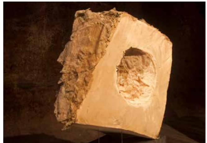
Resim 7. 'İsimsiz', 'Doku'nuşlar' Tekstil Sergisi, 2013.

Resim 6'da bütünü görüntülenen 'Doku'nuşlar' Tekstil Sergisini, mekandan etkilenen ve mekan için tasarlanan tekstiller olarak adlandırdık. Çalışmaların üç boyutlu kütleli duruşları ve biçimlendirmede kullanılan malzeme ve yöntemlerin işleri heykel alanına yaklaştırması, mekanın yapısal ve dokusal özellikleri ile bütünlük sağlayarak, asıl kompozisyonu mekan ve yapıtların toplamı olarak algıya sunmuştur. İşleri bu haliyle mekandan etkilenen, algıda mekanı yeniden tasarlayan tekstiller olarak da nitelendirebiliriz.