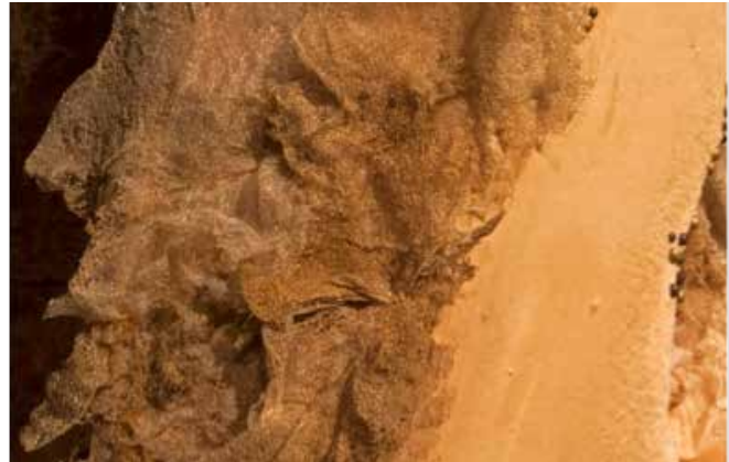
Resim 10. 'İsimsiz', 'Doku'nuşlar', detay, 2013.