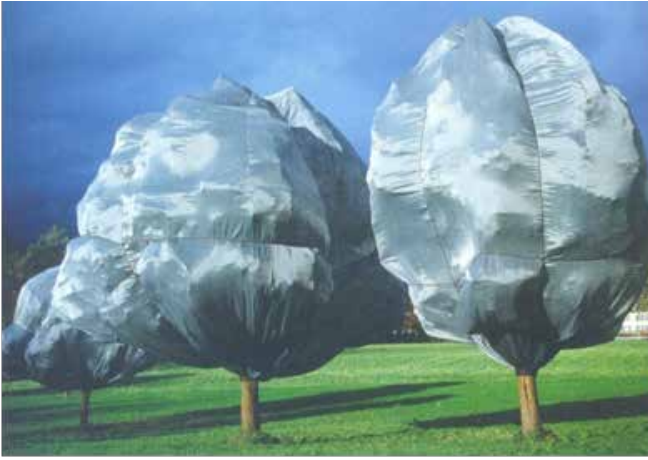
Resim 2. Christo and Jeane Claude, 'Wrapped Trees' (Sarılmış Ağaçlar), 1997-98.