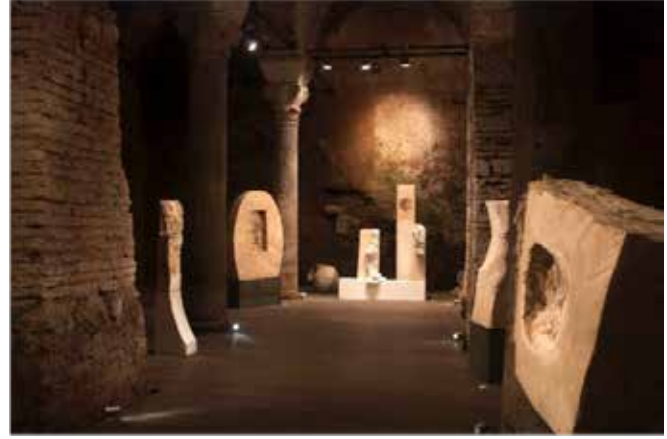
Resim 6. 'Doku'nuşlar' Tekstil Sergisi'nden genel görünüm, 2013.

bu kapsamda şu iki yaklaşım üzerinden değerlendirdiğimizde, sergiyi oluşturan tüm tekstil işlerini bir bütün (kompozisyon) olarak değerlendiren ilk yaklaşım ve her bir işi kendi içinde doku-malzeme-biçim-renk-doku vb. öğelerin ilişkisi üzerinden değerlendiren ikinci yaklaşım olarak ele alabiliriz.