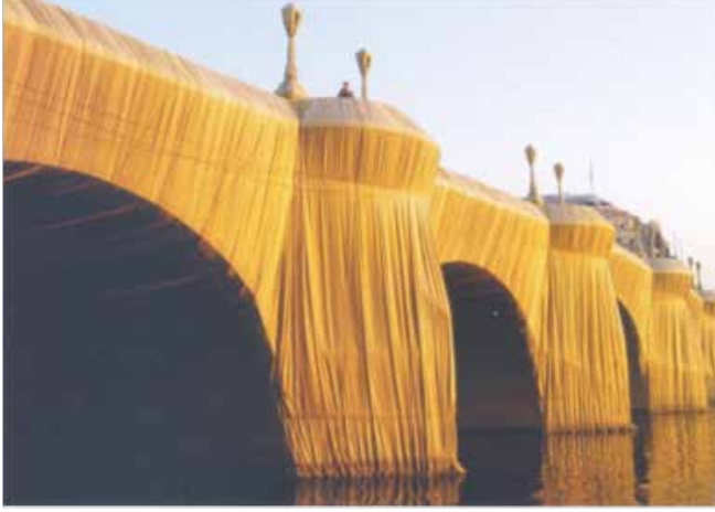
Resim 1. Christo, 'The Pont Neuf Wrapped' (Sarılmış The Pont Neuf), 1975-85.