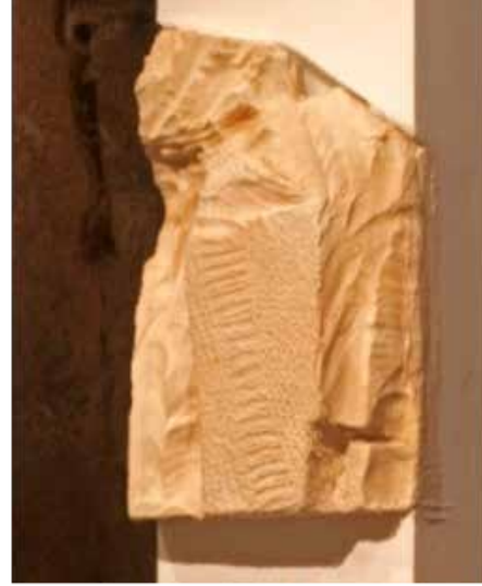
Resim 11. 'İsimsiz', 'Doku'nuşlar' Tekstil Sergisi, 2013.

Vurucu bir tasarım ögesi olarak rengi kullanmadan malzeme ile yüzey ve dokular tasarlamak bu çalışmadaki en önem- li oyun şeklidir. Renk, plastik ifade için önemli bir tasarım ögesidir ancak bu sergide rengin baskın öge olarak kulla- nılmaması, malzeme-biçim ilişkisini ön plana çıkaran, bir yandan görsel vurgu elemanı olarak doğrudan biçimi algıya sunan bir yaklaşım biçimidir.