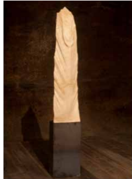
Resim 12. 'İsimsiz', 'Dokunuşlar', Tekstil Sergisi, 2013.