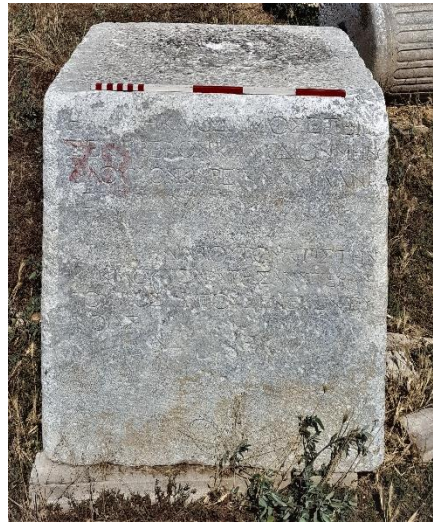
Resim 4:Quirina Kabilesi'nden Akylas'ın oğlu Tiberius Claudius Menophilos için yapılmış bir heykel kaidesi.