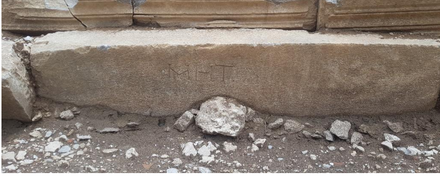
Resim 9: C4 numaralı cuneus'un orkestra duvarındaki "Met:" yazısı.