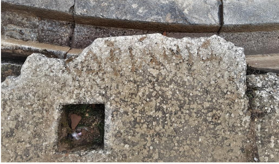
Resim 5: C9 numaralı cuneus'un ilk sırasındaki "Hadrianis" yazısı.