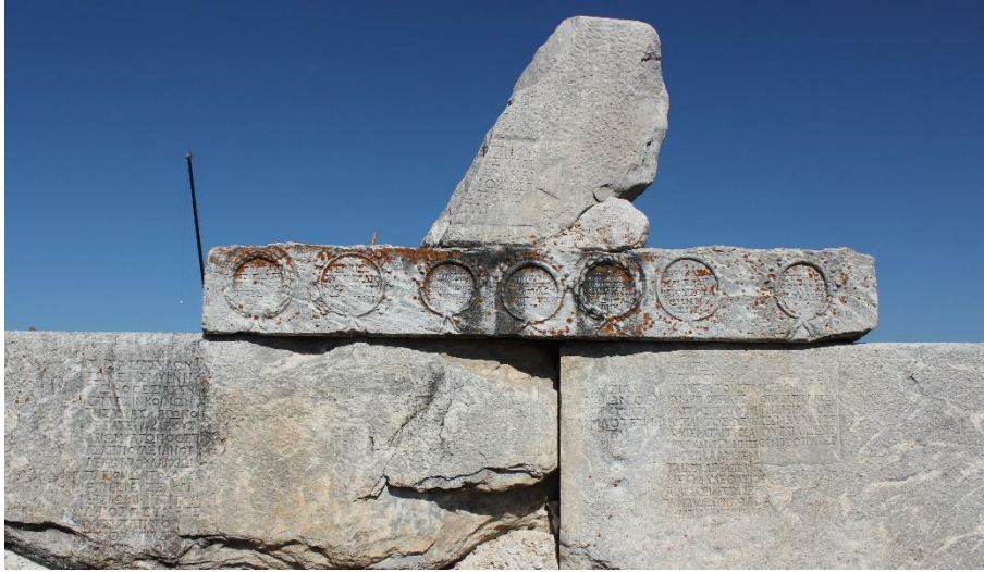
Resim 2: Stadion'un girişinde bulunan Ulpus Kroniği (Aizanoi Kazı Arşivi)