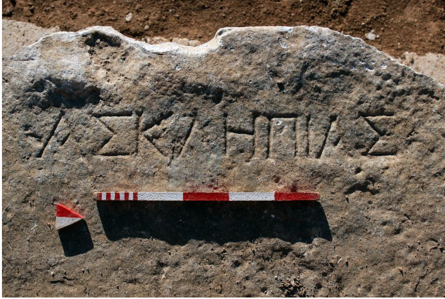
Resim 7: C7 numaralı cuneus'un ilk sırasındaki "Asklepias" yazısı.