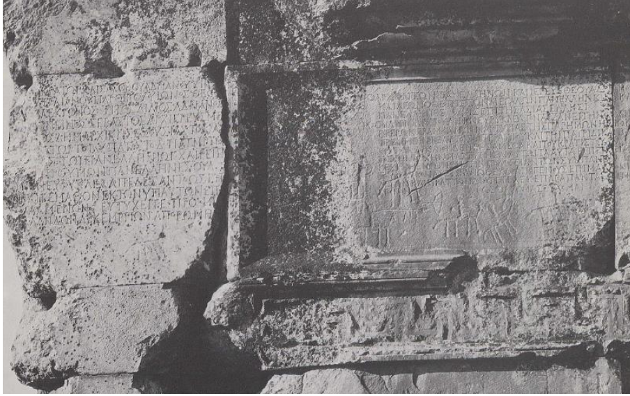
Resim 1: Zeus Tapınağı'nın kuzey pronaosunda sergilenen mektuplardan bir detay, solda Hadrianus'un mektubu: (Rudolf Naumann, Der Zeus Temple Zu Aizanoi , Berlin: Verlag Walter de Gruyter, 1979, Abb.16.)