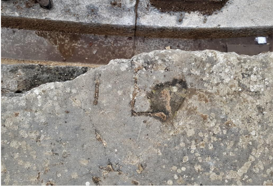
Resim 6: C8 numaralı cuneus'un ilk sırasında tahrip olmuş yazıt, yalnızca "-is" belirgin şekilde görünüyor.