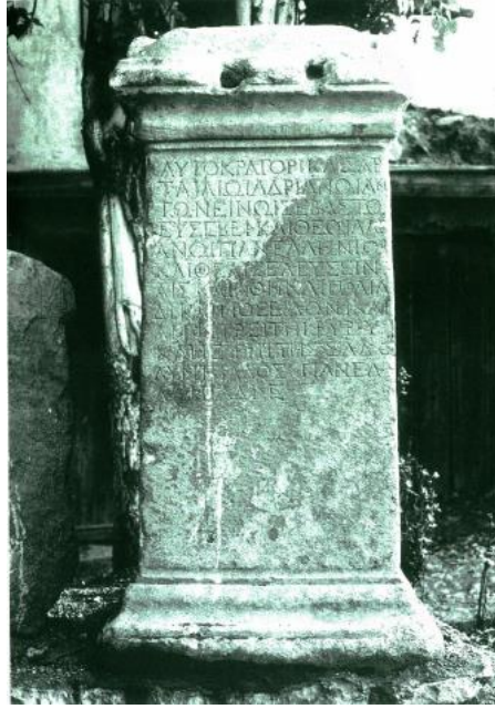
Resim 3: Eurykles'in Hadrianus Panhellenium için adadığı yazıt (Michael Wörrle, "New Inschriftenfunde aus Aizanoi I, Taf.I)