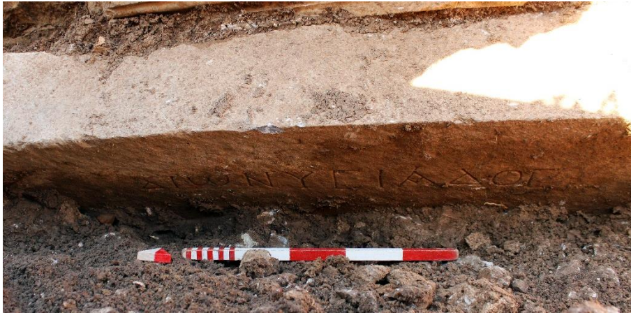
Resim 8: C6 numaralı cuneus'un orkestra duvarındaki "Dionysiados" yazısı.