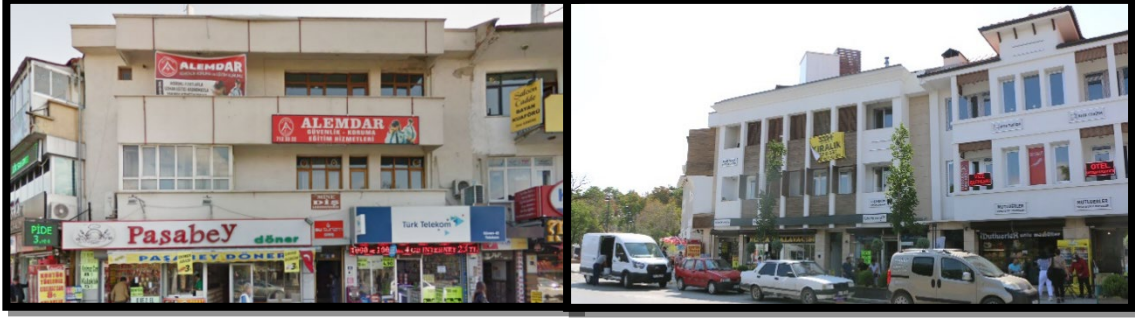
Şekil 17. Konya Alaaddin Tepesi Çevresi Sağlıklaştırma öncesi ve sonrası