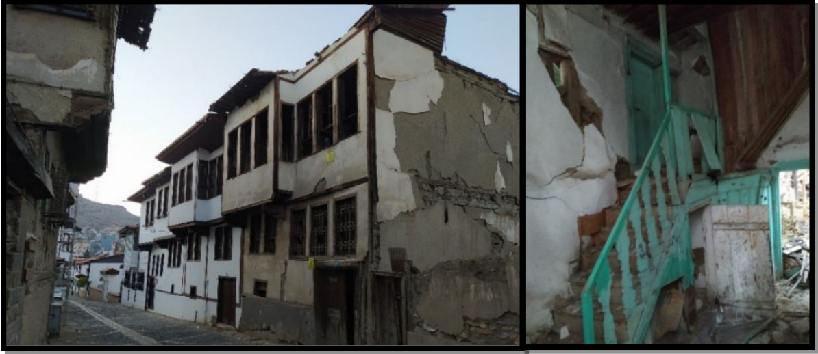
Şekil 6. Tokat Bey Sokak'ta sağlıklılaştırma çalışması sonrası bir yapının harap durumda bırakılmış iç mekân görünümü