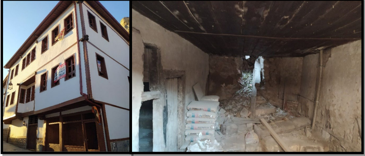
Şekil 2. Tokat Halit Sokak'ta sağıklaştırma çalışması sonrası bir yapı

Örneđin; Tokat şehrinde koruma altında olan birçok tarihi sokak dokusu mevcuttur. Tokat tarihi kent merkezinin önemli dokularına sahip alanlarından olan Bey Sokak'ta 1987 ve 2020 yıllarında (Şekil 4, 5), Bey Hamam Sokak'ta 2009 yılında, Halit Sokak'ta ise 2004 ve 2020 yıllarında (Şekil 3) sokak sağıklaştırma çalışmaları yapılmıştır (Akin, 2014).