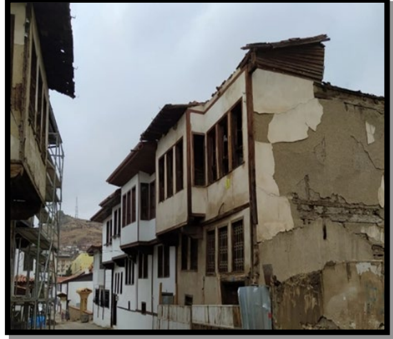
Şekil 5. 2021 yılı Tokat Bey Sokak