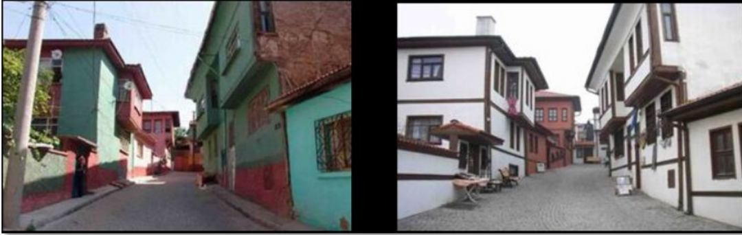
Şekil 15. Eskişehir Beyler Sokak Sağlıklaştırma öncesi ve sonrası (Nuhoğlu & Geçimli, 2019)