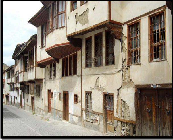
Şekil 4. 2011 yılı Tokat Bey Sokak (Cambaz, 2011)