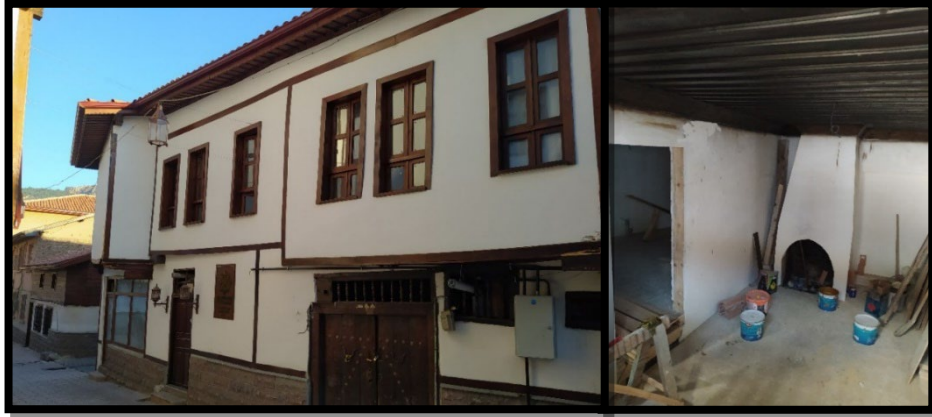
Şekil 9. Tokat Halit Sokak'ta Tokat Kültür Sanat ve Eğitim Vakfı olarak yeniden işlevlendirilmiş olan bir yapı cephe ve iç mekân görüntüleri

Yapıların birçoğu özgün halinde konut olmasına karşın günümüzde bazılarında işlev değişikliklerinin yaşandığı durumlar da olabilmektedir. Özgün işlevi konut olan bu yapıların işlev değişiklikleri ile yeniden kullanıma sunulması ve harap durumdan kurtarılması için çalışmalar yapılmaktadır. Şekil 9'da görüldüğü üzere özgün fonksiyonu ile tercih edilmeyen yapı Tokat Kültür Sanat ve Eğitim Vakfı hizmet binasına dönüştürülmekte ve bu sayede esaslı onarım geçirmektedir.