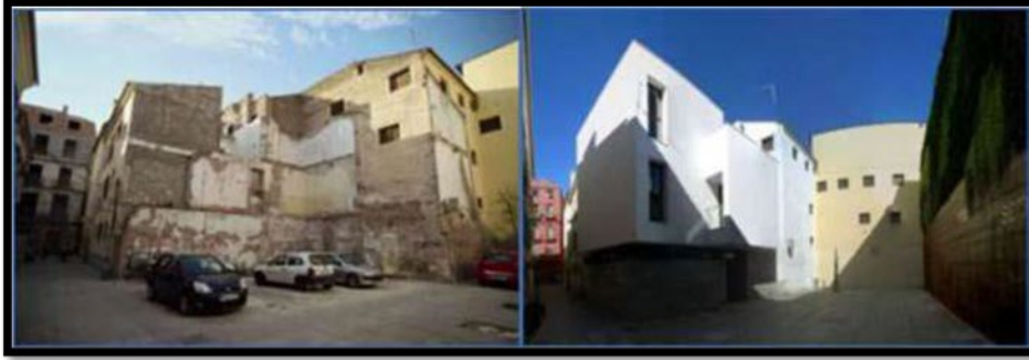
Şekil 21. Fransa, Dieppe sađıklařtırma öncesi sonrası (Duché, 2010)

Amerika Birleşik Devletleri'nde uygulanan "Cephe İyileştirme Programı (Façade Improvement Program)" ile temelde ticari cephelerin iyileştirilmesi ve bu sayede ekonomik canlanmanın sađlanması hedeflenmektedir. Bu program ile aynı zamanda tarihi nitelikteki yapıların cephelerinin de iyileştirilebilmesi için fonlar sađlanmaktadır (Şekil 22) (Lange, 2020).