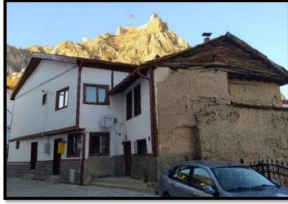
Şekil 8. Tokat Halit Sokak'ta bir yapının yola cephe vermeyen arka cephesinin görünümü

Yapıların birçoğu özgün halinde konut olmasına karşın günümüzde bazılarında işlev değişikliklerinin yaşandığı durumlar da olabilmektedir. Özgün işlevi konut olan bu yapıların işlev değişiklikleri ile yeniden kullanıma sunulması ve harap durumdan kurtarılması için çalışmalar yapılmaktadır. Şekil 9'da görüldüğü üzere özgün fonksiyonu ile tercih edilmeyen yapı Tokat Kültür Sanat ve Eğitim Vakfı hizmet binasına dönüştürülmekte ve bu sayede esaslı onarım geçirmektedir.