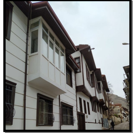
Şekil 12. Tokat Bey Sokaktaki tescilsiz yapının sağlıklılaştırma sonrasındaki hali