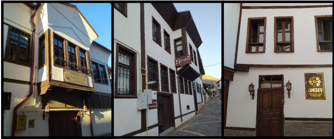
Şekil 10. Tokat Halit Sokak ve Bey Sokak'ta yeniden işlevlendirilmiş yapılardan görüntüler