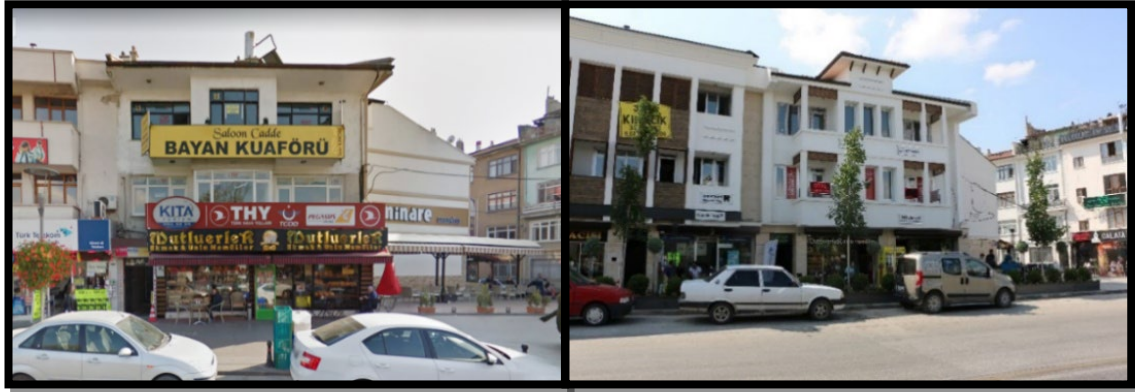
Şekil 18. Konya Alaaddin Tepesi Çevresi Sağlıklaştırma öncesi ve sonrası