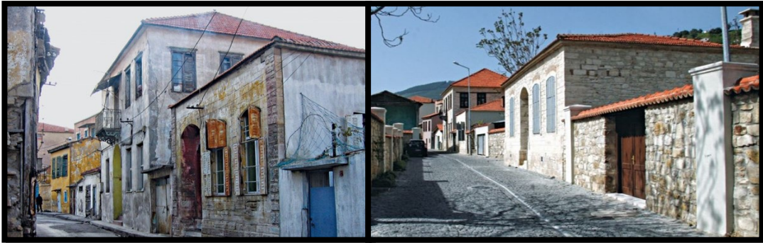
Şekil 16. Aydın Söke Kemalpaşa Mahallesi Sokak Sağlıklaştırma öncesi ve sonrası (Levi & Karatosun, 2016)