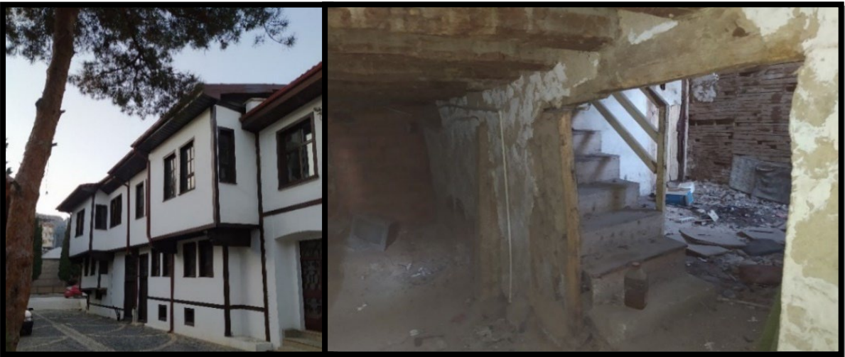
Şekil 7. Tokat Bey Sokak'ta cephe sağlıklılaştırması yapılmış bir yapının harap durumda terk edilmiş iç görünümü