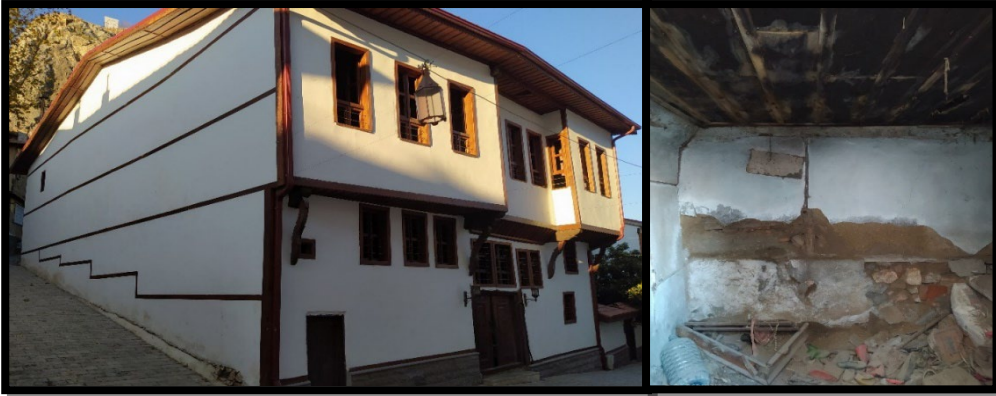
Şekil 1. Tokat Halit Sokak'ta sağlıklılaştırma çalışması sonrası içi harap durumda olan bir yapı

Sokak sağlıklılaştırma çalışması, özelliği itibarı ile bir sokağın tamamına veya belirli bir bölümüne uygulanabilmektedir. Yapıların bulunduğu sokaklara bakan cephelerine yönelik sürdürülen bu çalışmaların yeterli ve faydalı bir koruma yöntemi olduğu tartışmaya açıktır. Çünkü esaslı onarıma ihtiyacı olan tescilli veya tescilsiz yapılara ilişkin sadece cephe iyileştirmesi olarak kalan bu yöntem ile yapıların iç kısımları bakımsız kalmaya devam etmektedir (Şekil 1, 2).