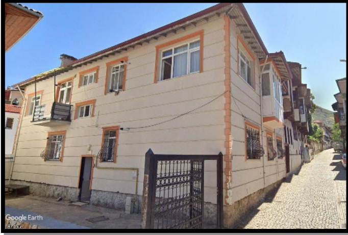
Şekil 11. Tokat Bey Sokaktaki tescilsiz yapının sağlıklılaştırmadan önceki hali

Tarihi yapıların cephelerinin iyileştirilmesinin yanı sıra sokaklarda bulunan tescilsiz yapıların da cepheleri sokağa uyumlu olarak yenilenmektedir (Şekil 11, 12). Gerektiğinde pvc doğramalı pencereler, dokuya uyumlu olarak ahşap doğramalar veya ahşap görünümlü pvc doğramalar ile değiştirildikleri gözlemlenmektedir (Şekil 13).