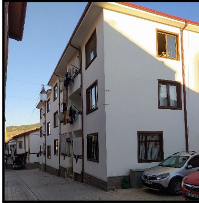
Şekil 13. Tokat Halit Sokak'ta sağlıklılaştırma sonucunda tescilsiz bir yapının cephesi (1. yazarın arşivinden)