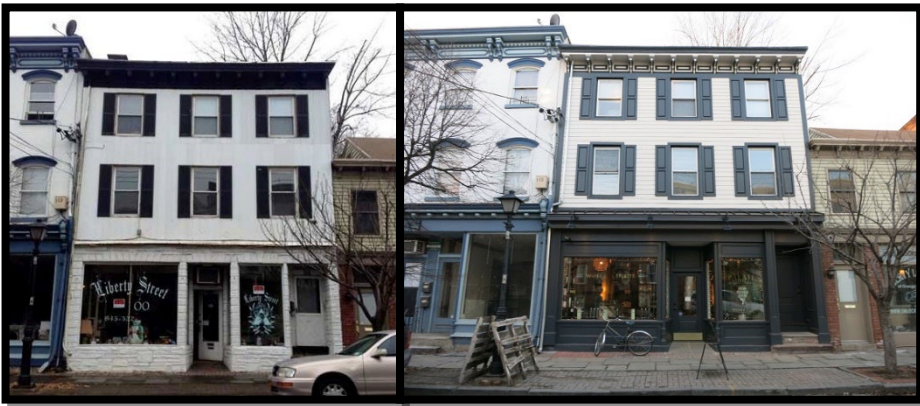
Şekil 22. Newburgh, A.B.D, Liberty Street'te sađıklařtırma öncesi sonrası görünüm (Mart 15, 2022 tarihinde https://newburghrestoration.com/blog/2016/02/09/before-and-after-115-liberty-street/#comments adresinden alındı)

Amerika Birleşik Devletleri'nde uygulanan "Cephe İyileştirme Programı (Façade Improvement Program)" ile temelde ticari cephelerin iyileştirilmesi ve bu sayede ekonomik canlanmanın sađlanması hedeflenmektedir. Bu program ile aynı zamanda tarihi nitelikteki yapıların cephelerinin de iyileştirilebilmesi için fonlar sađlanmaktadır (Şekil 22) (Lange, 2020).