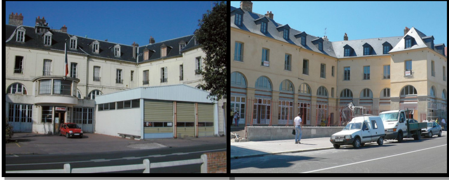
Şekil 20. Plaza del Pericon (Malaga – İspanya) öncesi ve sonrası (Ertan & Eđerciođlu, 2016)

ölçeđini, biçimini ve yasal alt yapısını etkilemektedir. Bu dođrultuda ülkeler tarihi dokular üzerindeki stratejilerini kendileri belirlemektedirler (Şekil 20, 21, 22).