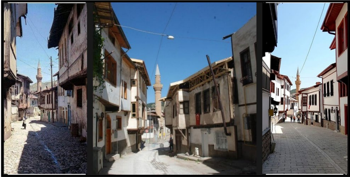
Şekil 3. 1980, 2010 ve 2020'de Tokat Halit Sokak

Bu dokulardan tarihi Bey Sokak ve Halit Sokak üzerinde yapılan alan çalışlarında bu sokak dokularında yer alan yapılardan bir kısmının hali hazırda kullanıldığı bir kısmının ise terk edildiđi gözlemlenmiştir. Söz konusu sokaklarda yapıların cepheleri sokak sağıklaştırma uygulamaları ile iyileştirilmiş olmasına rağmen bazı terk edilmiş yapıların iç kısımlarının ise harap durumda olduđu tespit edilmiştir. (Şekil 1, 2, 6, 7). Bu yapıların aynı zamanda uygulama dışında kalan, ana sokađa bakmayan cephelerinde onarım çalışmaları yapılmadığı için bakımsız bırakıldıkları da saptanmıştır. Örneđin; Halit Sokak'ta bulunan bir yapının hem ana sokađa bakan cephesi hem de tali sokađa bakan cephesi sağıklaştırma çalışmalarınca onarılmış iken diđer yan cephesinin (yani yapının ana sokađa göre arka cephesi) ise oldukça harap durumda olduđu görülmektedir (Şekil 8).