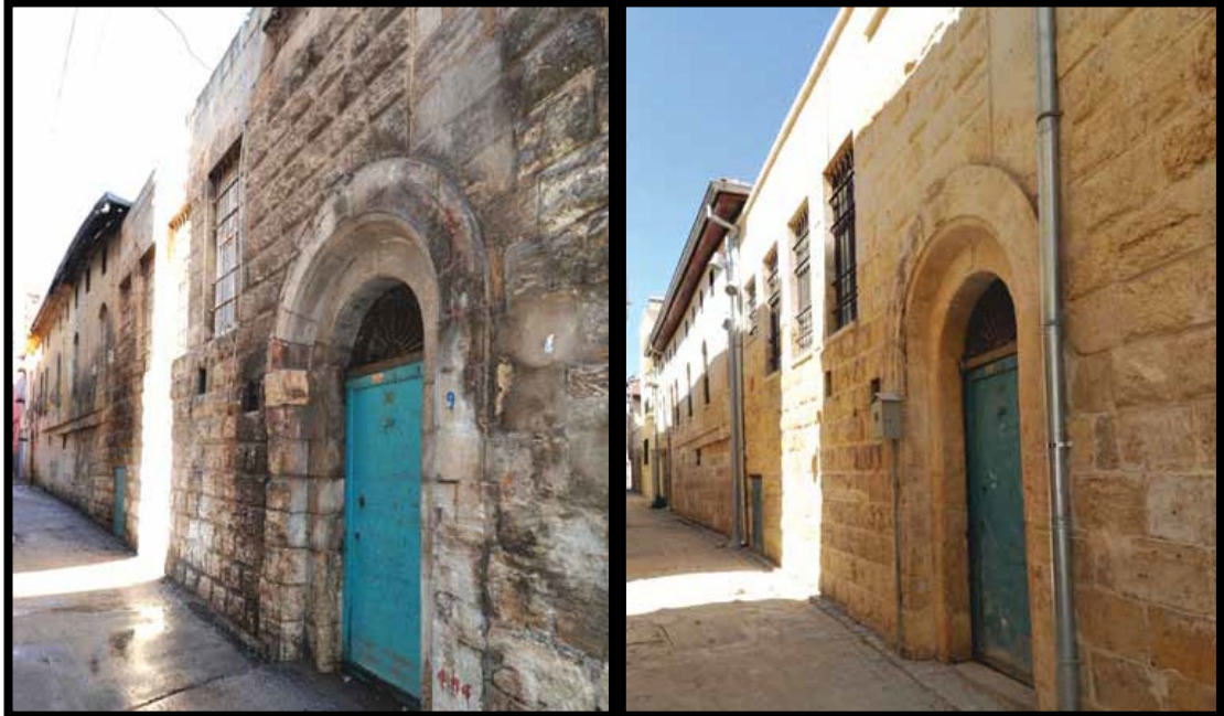
Şekil 19. Alaaddin Tepesi Bölgesi Sokak Sağlıklaştırma çalışması öncesi ve sonrası

Dünya genelinde tarihi dokuların canlandırılması adına çeşitli projeler üretilmektedir. İç savaşlar, terk etme, bayındırlık etkileri, bakımsızlıklar sonucunda yeniden canlandırma stratejileri bağlamında sağlıklaştırma çalışmaları yapılmaktadır. Tarihi dokudaki bozulmaların boyutu sağlıklaştırmanın