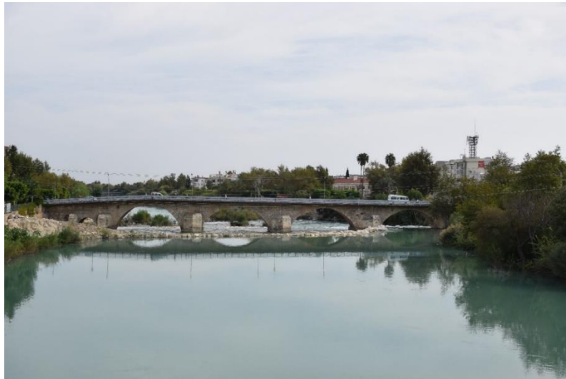
Resim 2. Silifke Taş Köprü

Evliya Çelebi'nin belirttiği gibi bölgede narenciye, incir ve nar gibi ürünler yetişmektedir (Solak, 2008: 217-251). Silifke Köprüsü ise MS 77-78'de Roma İmparatoru L. Octavius Memor döneminde inşa edilmiştir. Köprü, 1875 yılında yeniden inşa edilmiştir [Resim 2]. Köprü on yedi değil yedi gözlüdür ve nehir yatağının bu kadar uzun bir köprü kuruluşuna imkân verecek genişlikte olması düşündürücüdür (Yeşilbaş, 2016: 96).