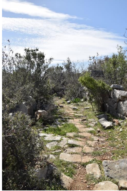
Resim 7. Kilikya Bölgesinde Birçok Farklı Noktada Rastlanan Antik Yol İzleri

Romalıların egemenlik kurdukları bölgelere çeşitli yapılar, bu yapılarla bağlantılı taş döşeli yollar, köprüler ve limanlar yaptıkları görülmektedir. Geniş alana yayılmış olan imparatorluk topraklarında iletişimin tek yolu ulaşım sistemi olmuştur. Ulaşım, karayolları ve denizyolları aracılığıyla yapılmış, sorun çıkan bölgelere askerî birliklerin ulaşması ve bölgeler arası geçiş ve iletişimi sağlaması açısından yaşamsal önem taşımıştır (Aşkın, 2006: 48).