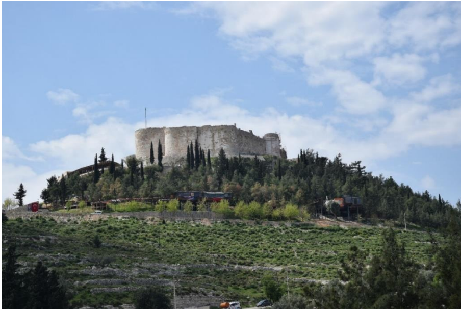
Resim 1. Silifke Kalesi Güneydoğu Cepheden Görünüm

Evliya Çelebi kalenin yapısı için; “... yalçın kayalı ve bir tarafı topraklı yüksek tepe üzerinde havalesiz, sağlam ve dayanıklı bir kaledir ve badem şekilli şeddadi taş yapıdır. Dört tarafı 1.300 adım küçük kaledir ve 23 kuledir. Kibleye nazır bir kapısı vardır, içinde 60 toprak örtülü hanesi vardır. Asla hendeği yoktur, zira yalçın dağ üzere inşa olunmuştur.” der (Çelebi, 2011: 344). Evliya Çelebi’nin belirttiği gibi Silifke Kalesi, Silifke’ye hâkim 185 m yükseklikte bir tepenin üstüne inşa edilmiştir [Resim 1]. Kalenin surları 700 m uzunluğundadır (Aykaç, 2018: 309). Bu da her adımı yarım metre olarak düşündüğümüzde Evliya Çelebi’nin 1.300 adım olarak belirttiği uzunluğa yaklaşık bir uzunluktur. Ancak kalenin kazılar sonucunda on altı adet burcu olduğu tespit edilmiştir (Boran, Sözlü ve Aykaç, 2019: 81). Kalenin kapısının girişi doğu cepheden olup kuzey-güney doğrultusundadır (Aykaç, 2018: 27). Kale içerisinde kaç hane olduğu kesin olarak tespit edilememiştir. Kalenin tüm çevresinde ise Evliya Çelebi’nin belirttiğinin aksine kuru hendek bulunmaktadır.