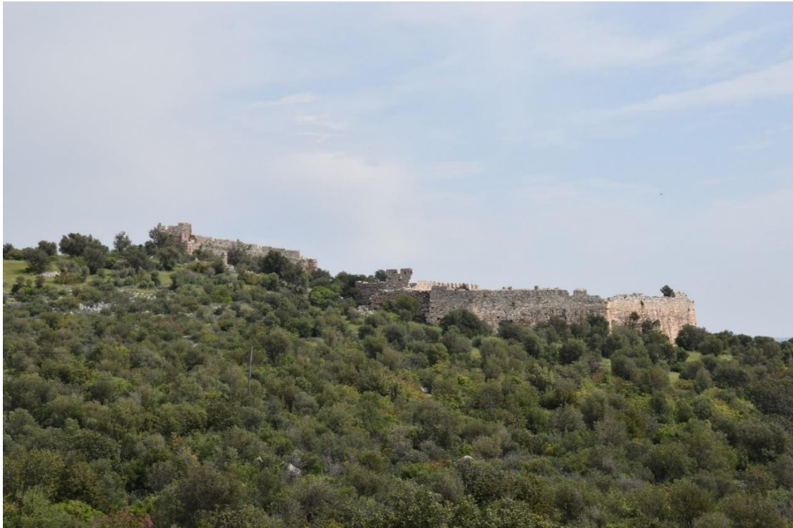
Resim 3. Ak Liman Kalesi Genel Görünüm

Kalenin Osmanlı'dan önceki dönemlere ait bilgilerine ulaşılamamıştır ancak Piri Reis'in 932 (M 1525) yılında kaleme aldığı Kitabı Bahriye 'de belirttiğine göre, harap bir kale mevcuttur (Reis, 2002: 562). Kıbrıs'ın fethinden sonra ise Ak Liman'ın önemi artmasından ve Silifke Kalesi'nin limana uzak olmasından dolayı 1571 yılında limanı koruması için bir kale inşa edilmesi kararı alınmıştır (Çelik, 1994: 339). 1572 yılında kalenin inşası tamamlanmış, 1573'te varoş ve kule inşası yapılmış, 1574'te ise tüm çalışmalar tamamlanmıştır (Çelik, 1999: 116). Bazı yabancı seyyahlar yapmış oldukları gezilerde Ak Liman'dan Ağa Limanı olarak bahsetmişler ancak kalenin tarihi ile ilgili bilgi vermemişlerdir 3 .