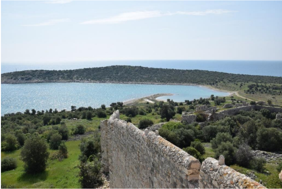
Resim 4. Ak Liman Kalesi'nden Limanın Görünüşü

Kıbrıs'ın iskelesi konumundaki Ak Liman kısa sürede gelişmiş; kervansaray, mahzen ve dükkânlar inşa edilmiş; kırk elli gemiyi aynı anda muhafaza eden bir liman seviyesine ulaşmış [Resim 4] ve Silifke şehrini geçmiştir (Çelik, 1999: 116). Faroqhi'nin mühimme defterlerine dayanarak verdiği bilgiye göre de Silifke çarşısına ek olarak Ak Liman'da dükkân ve depo yaptırılmıştır (Faroqhi, 2000: 107). Günümüzde Ak Liman'da herhangi bir kazı çalışması yapılmadığından ev, dükkân, mahzen gibi unsurların varlığı bilinmemektedir. Ancak kale askerî bir alanda yer alması nedeniyle fazla tahribata uğramamıştır. Kazı çalışması yapıldığı takdirde birçok unsurun gün yüzüne çıkacağı aşikârdır.