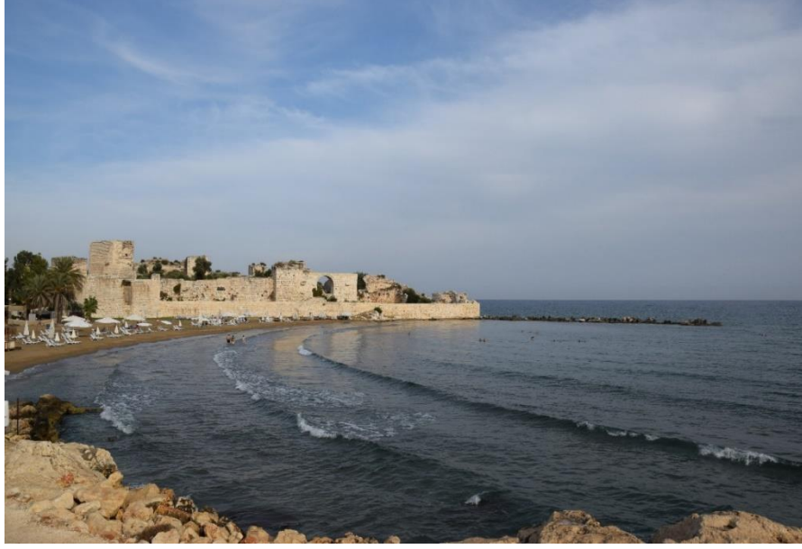
Resim 6. Korykos Kara Kalesi ve Antik Liman