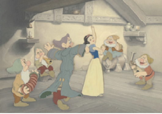
Şekil 3. (URL-6).

İlk uzun metrajlı film olan Pamuk Prenses ve Yedi Cüceler / Snow White and the Seven Dwarfs adlı filminden bir görüntü.