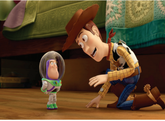
Şekil 4. (URL-7).

Pixar şirketi tarafından 1995 yılında çekilen ve tamamı bilgisayar animasyonu olan Oyuncak Hikâyesi / Toy Story adlı filminden bir görüntü.