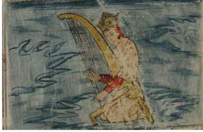
Resim 8. Zühre tasviri, AMGM, 1701, Manisa İl Halk Kütüphanesi, 45 Hk. 5355, 16b.

(Başkan, "Manisa İl Halk Kütüphanesi'nde...", s. 93)