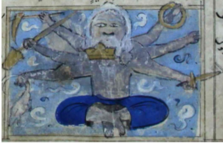
Resim 12. Zuhul tasviri, AMĞM, 1424, Süleymaniye Kütüphanesi Laleli 1991, 24b.

Eserin 25a-40a sayfalarında burçlar, takımyıldızlar ve ay menzilleri hakkında bilgi verilmektedir. 40a sayfasındaki “12. Nazar Semâvât’ın Sakinleri” başlığı altında meleklerin durumu hakkında bilgi yer almaktadır. 41a sayfasında “Hamele-i Arş melekleri” olan insan, boğa, kartal ve aslan sûretindeki arşı taşımakla görevli melekler zikredilmektedir. Metnin devamında bu meleklerden insan sûretinde olanın insanların erzakına, boğa sûretinde olanın evcil hayvanların erzakına, kartal sûretinde olanın kuşların erzakına ve aslan sûretinde olanın ise yırtıcı hayvanların erzakına aracılık ettiği bildirilmektedir. Ancak burada bu meleklerin tasvirine yer verilmeden aynı sayfanın devamında Ruh ve İsrail isimli melekler zikredilmektedir. Bahsi geçen insan, boğa, kartal ve aslan sûretindeki meleklerin tasviri ise 44a sayfasında “Semâvâtın Melekleri” başlığıyla zikredilen farklı melek türlerinin akabinde 44b sayfasında yer almaktadır.