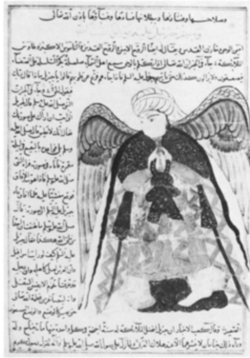
Resim 14. Melek Cebrail tasviri, AMĞM, 15. yy?, Freer Gallery of Art, fol. 52b

(Badiee, "The Sarre Qazwîni...", s. 111)