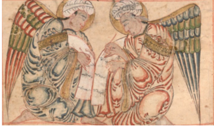
Resim 22. Kirâmen Kâtibîn tasviri, AMGM, 1280, Münih Staatsbibliothek, MSS cod. arab. 464, 34a

( https://www.digitale-sammlungen.de/en/view/bsb00045957?page=76,77 )