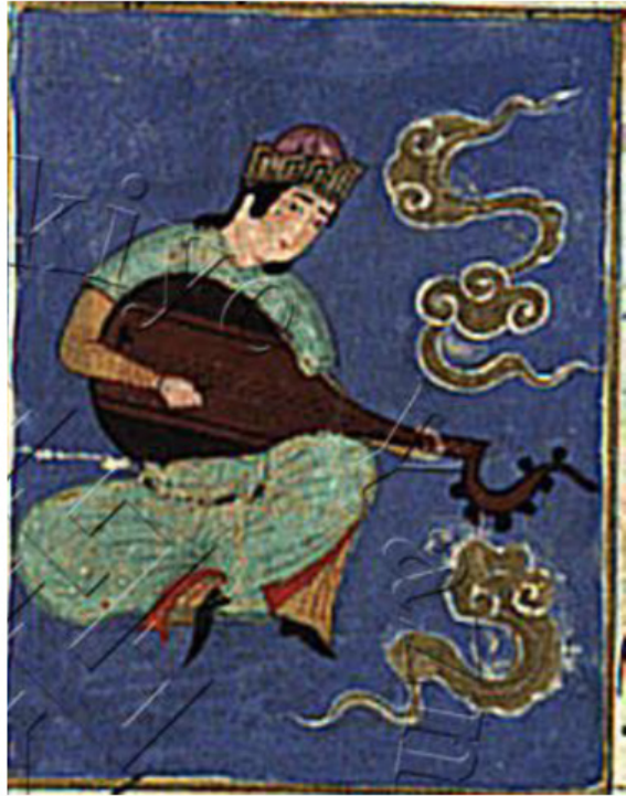
Resim 7. Zühre feleği tasviri