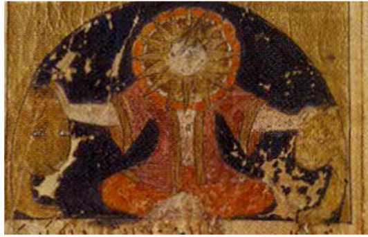
Resim 10. Âfitab tasviri, AMĞM, 1322, Süleymaniye Kütüphanesi Yeni Cami 813, 12b. (Berlekamp, Wonder, Image, & Cosmos...s. 17)