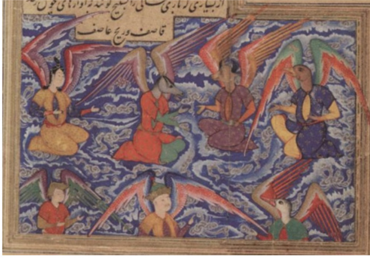
Resim 20. Semâvâtta ki bekçi meleklerin tasviri, AMĞM, 1545, Dublin Chester Beatty Library Ms. Per. 212, fol. 71b (Rührdanz, “Between Astrology and Anatomy”, s. 61)