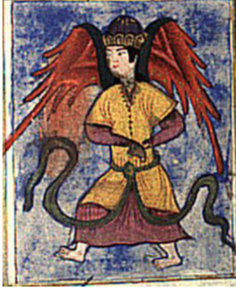
Resim 13. Melek Cebrail tasviri