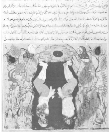
Resim 24. Hârût ve Mârût tasviri, AMĞM, 1580, St. Petersburg Branch of the Institute of Oriental Studies, D 370

(Moor, Rezvan, "Al- Qazwîni's Ajâ'ib Al-Makhlûqât...", s. 41)