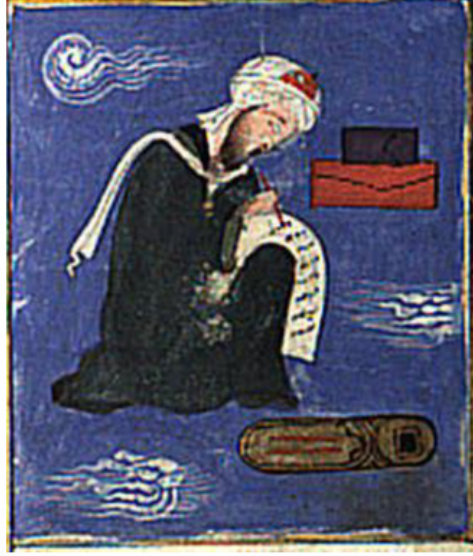
Resim 5. Utarid feleği tasviri

rilen tavus kuşu ve yılan tasvirlerine ya da Hz. Havva'nın tavus kuşuna, Hz. Adem'in de yılanı (ejderha) binerken tasvir edilmesine rastlanmaktadır 4 . Bu noktadan hareketle Utarid'in vasıfları arasında bulunan hile ve hıyanet kavramlarıyla da ilişkili olarak tasvirde tavus kuşu ve yılanın kullanılmış olabileceği düşünülmektedir. Gezegenlerin çeşitli biçimlerde kişileştirilmesinde Antik dönem eserlerinin ve mitlerinin de etkisi göz önünde bulundurulduğunda konuya ilişkin farklı yorumlar sunmak mümkündür.