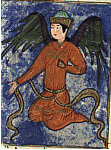
Resim 15. Melek Mikail tasviri