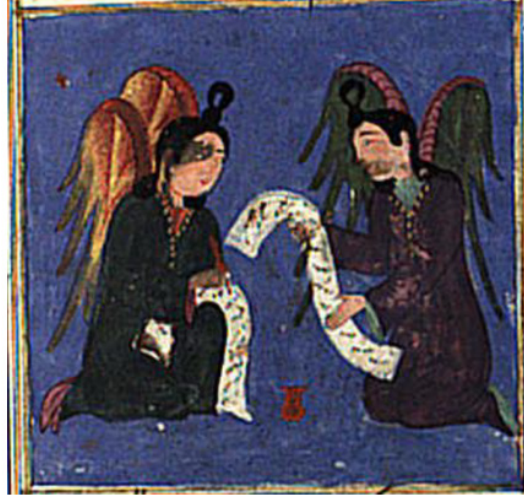
Resim 21. Kirâmen Kâtibîn isimli meleklerin tasviri