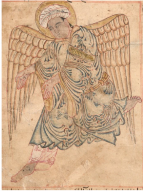
Resim 18. Azrail tasviri, AMĞM, 1280, Münih Staatsbibliothek, MSS cod. arab. 464, 34a

( https://www.digitale-sammlungen.de/en/view/bsb00045957?page=72,73 )