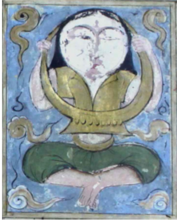
Resim 4. Kamer tasviri, AMĞM, 1424, Süleymaniye Kütüphanesi Laleli 1991, 16b.