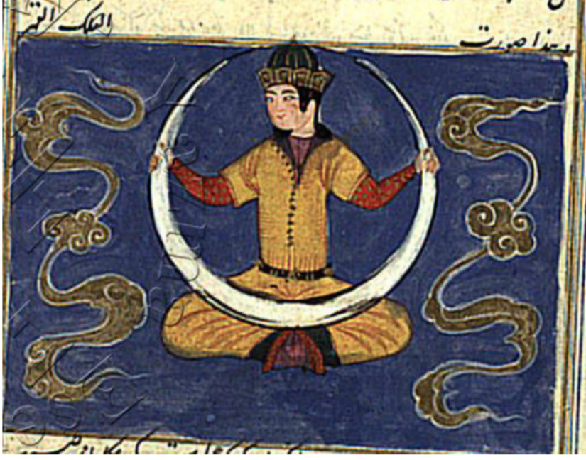
Resim 3. Kamer feleği tasviri

renkteki dolantı Çin bulutlarıyla doldurulmuştur. Konuya ilişkin ikinci örnek ise 1424 tarihli (Hayashi, 2017: 4702) bir nüshada yer almakta olup, benzer şekilde kolları arasında hilali tutan buradaki Kamer figürünün başı da antropomorfik özellikteki dolunay biçimini yansıtmaktadır.