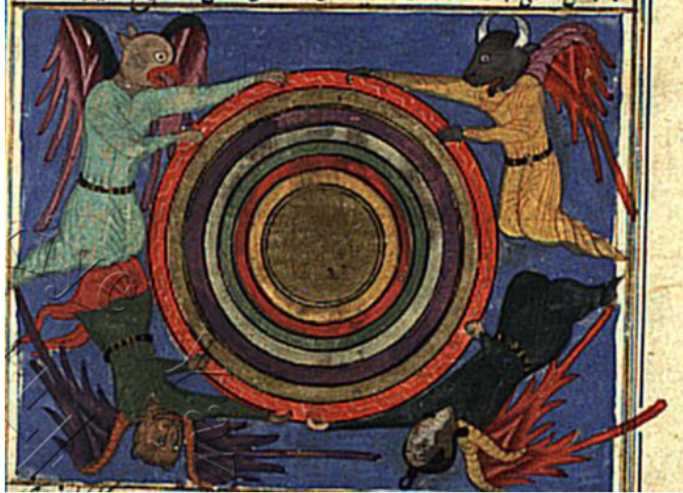
Resim 19. Semâvât (Hamele-i Arş) meleklerinin tasviri