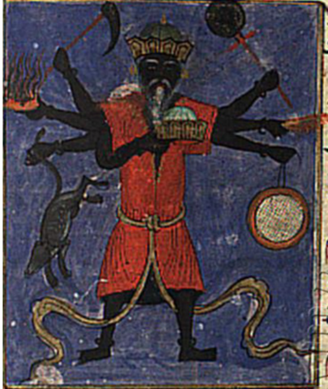
Resim 11. Zuhal feleği tasviri