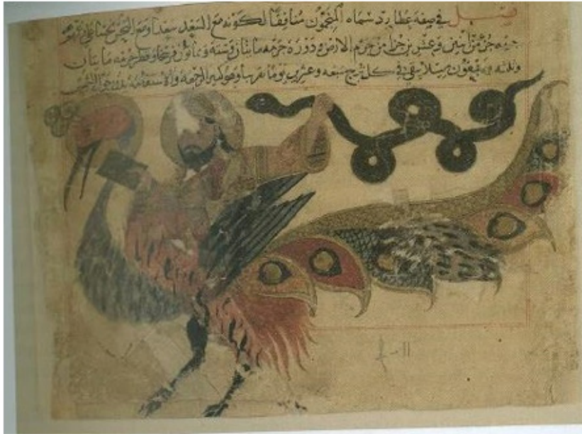
Resim 6. Utarid tasviri, AMĞM, 14. yy?, British Library Or. 14140, fol. 8r. (Carboni, The Wonders of Creation and the Singularities...s. 57 )