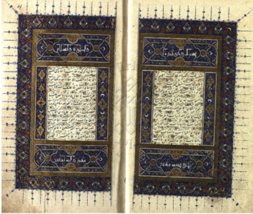
Resim 2. Eserin serlevha tezhibi