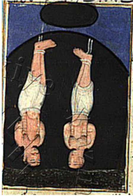
Resim 23. Hârût ve Mârût isimli meleklerin tasviri