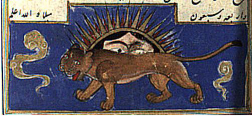
Resim 9. Âfitab feleği tasviri