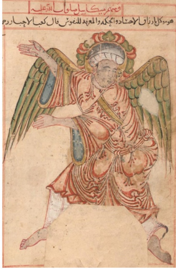
Resim 16. Mikail tasviri, AMĜM, 1280, M n h Staatsbibliothek, MSS cod. arab. 464, 33b

( https://www.digitale-sammlungen.de/en/view/bsb00045957?page=70,71 )