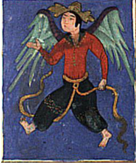
Resim 17. Melek Azrail tasviri