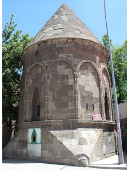
Karanlık Kümbet ( https://maps123.net/en/TR/sadrettin-konevi-trbesi-p102749 )

yere hasır sermişlerdi. İlk kış yakılacak kömür parasını da bir öğrencisinin dedesi vermişti. Aradan üç yıl geçtiği halde Kırkinci Hoca, M. Şercil Polat ve Zeki Çiğdem'den başka Risale-i Nur davasına sahip çıkan kimse olmamıştı. Bunun üzerine Bediüzzaman'a "Üstadım, insanlar bizi dinlemiyorlar, Risale-i Nur'a bir türlü sahip çıkmıyorlar; hiç çoğalamıyoruz" diye bir mektup yazar. Bediüzzaman da kendilerine "Bir şehirde bir tek Nur talebesi olsa ve parmakla gösterilse o şehir benimdir" şeklinde bir cevap verdi. Bu cevap kendilerini şevke getirdi ve Risale-i Nurları tanıtmak için daha fazla çalışmaya başladılar. Fakat ne zaman yeni bir mesele ortaya çıksa Bediüzzaman'a mektup yazıp fikrini alırlardı. Bu minvalde birkaç mektup yazdıktan sonra Bediüzzaman her meselenin kendisine sorulmamasını, problemleri müşavere ile çözmelerini teklif etti. Murat Paşa Medresesi kendilerinin hem toplanma yeri, hem de adresleri olmuştu. Bediüzzaman bir mektubunda "Kendi evlerinizi medrese yapınız." dediği için bu tavsiyeye uyarak evlerde de Risale-i Nur dersleri başlattılar (Kırkinci, 2013). Ev derslerinden sonra hizmette bir genişleme oldu.