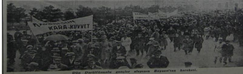
Dün Darülfünunu gençler alayının Beyazıt'tan hareketi.

Büyük Erkanharbiye Reisi Müğür Fevzi Pş. Menemen hâdisesi dolayısıyla bazı makamattan, vilayetlerden belediye lerden ve Türk ocaklarından ve sair te- (Devamı 4 üncü sayıfada)