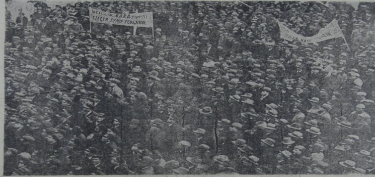
Gençliğin İstanbul Darülfünunu meydanında İrtica karşı mitingi.

İcra Vekilleri Heyeti dünkü içtima- nda örfî idare ilanı hakkında şu karar- nameler istar olunmuştur: