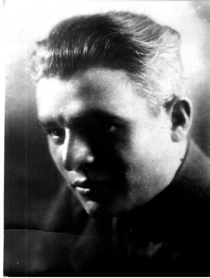
Şehit Asteğmen Mustafa Fehmi Kubilay