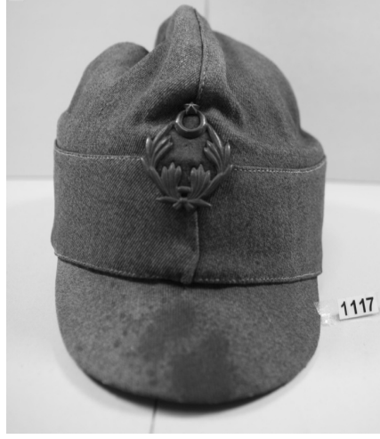
Şehit Asteğmen Mustafa Fehmi Kubilay'ın Şapkası, Türk İnkılap Tarihi Enstitüsü Arşivi , Müze Evanter No: 1177.