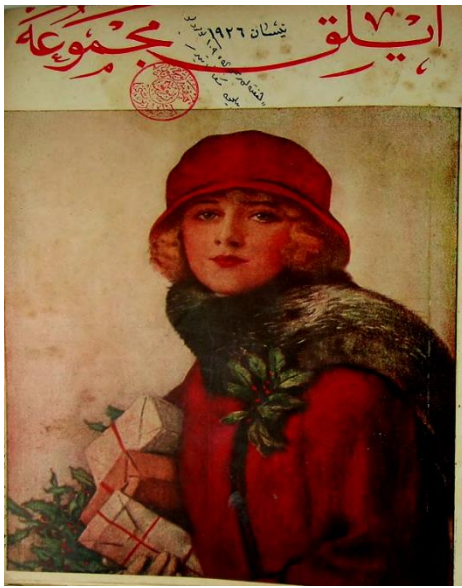
Resim1: Aylık Mecmua 1. Sayı kapağı