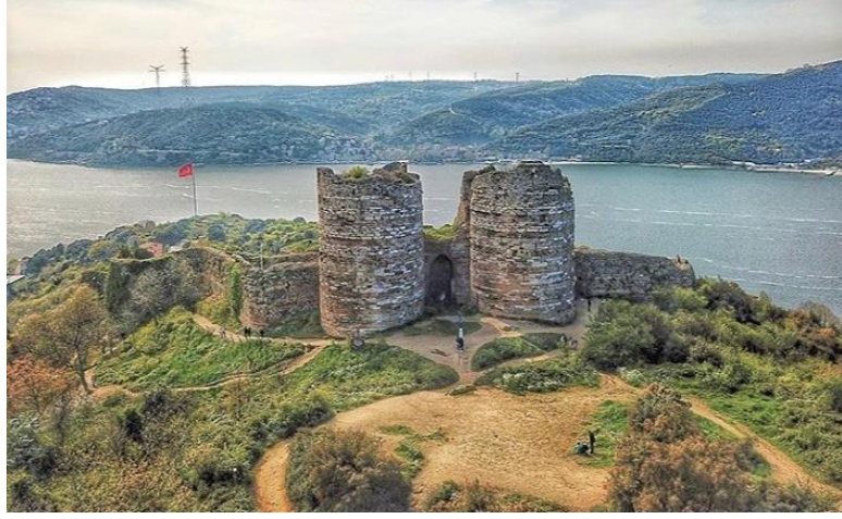
F. 3. Yoros Kalesi, İstanbul, ( https://www.beykozgundem.com )