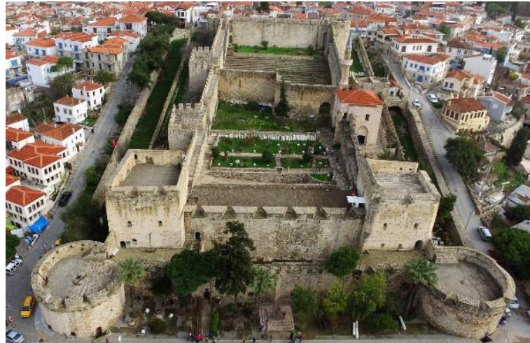
F. 5. Çeşme Kalesi, İzmir, ( https://kvmgm.ktb.gov.tr )