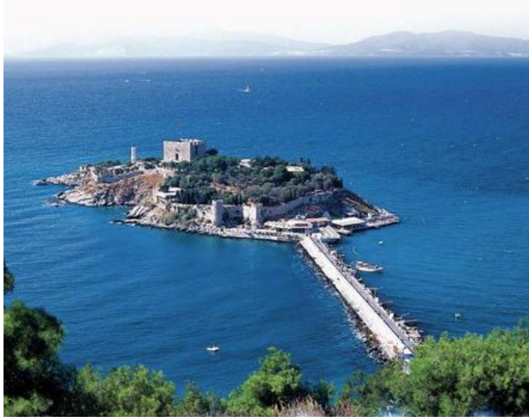
F. 7. Kuşadası, Güvercinada Kalesi