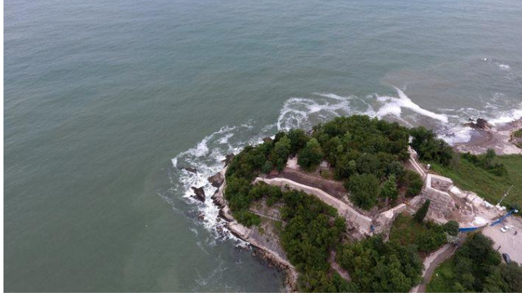
F. 10. Düzce, Akçakoca Kalesi, ( https://www.arkeolojikhaber.com )