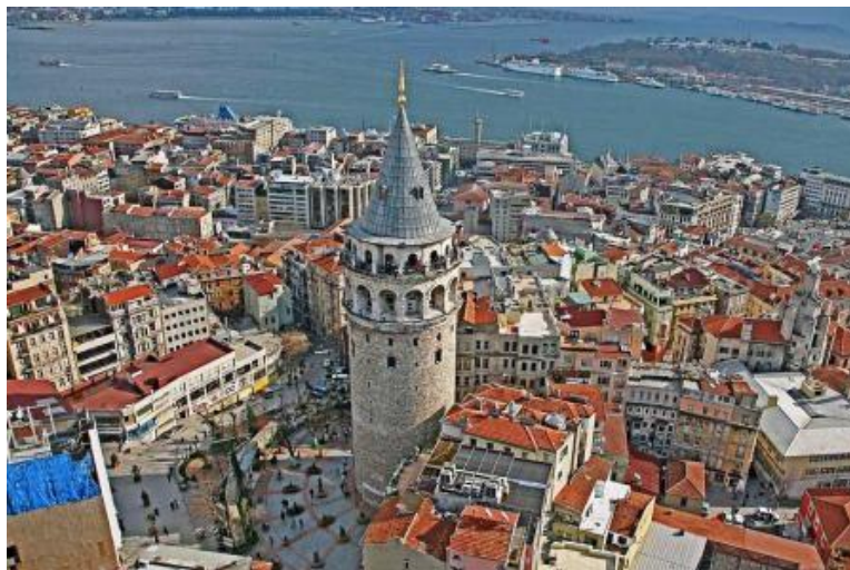
F.2. Galata Kulesi, İstanbul