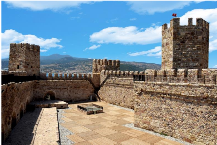
F. 8. Çandarlı Kalesi, ( https://www.izmir-dikili.bel.tr )