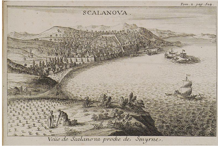
F. 6. Scalanova, Tournefort, ( https://commons.wikimedia.org )