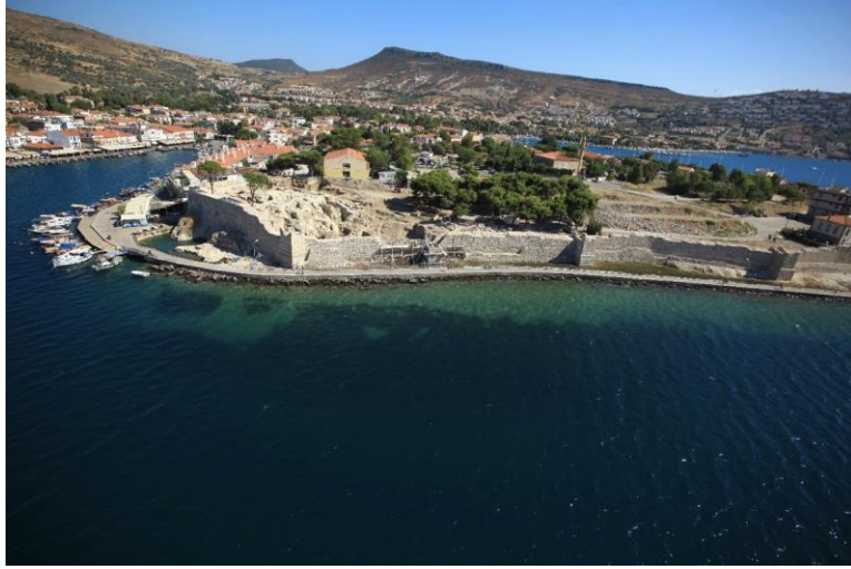
F. 4. Foça Kalesi, İzmir, ( https://www.foca.bel.tr )