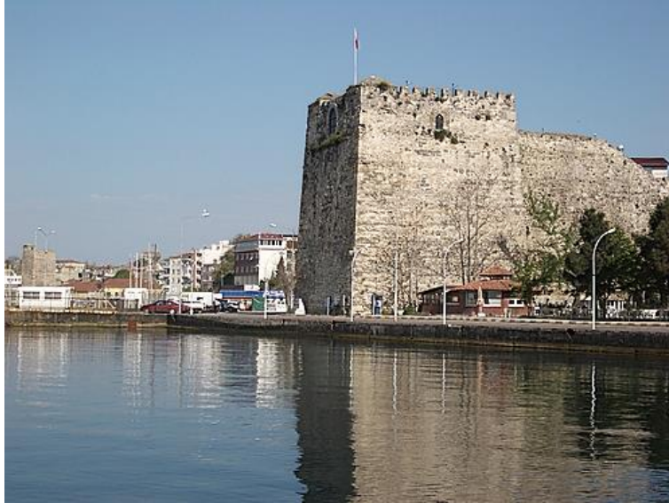
F. 11. Sinop Kalesi, ( https://sinopkulturturizmi.files.wordpress.com )