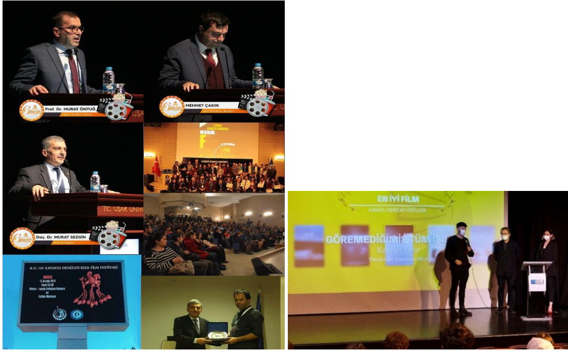
Şekil 5. Uşak Kanatlı Denizatı Film Festivali'ne ait fotoğraflar 2014-2020