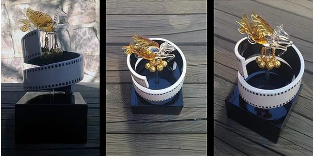
Şekil 3. Ödül heykelciği (2014)