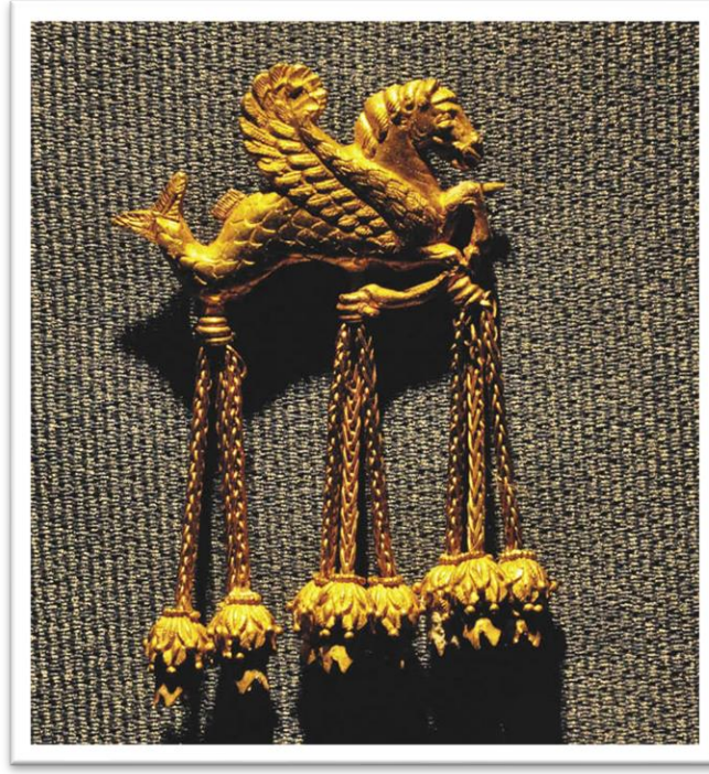
Şekil 1. Kanatlı Denizatı Broşu

Uşak Müzesi'nin adeta sembolüken bu altın broşun yaşadığı çalınma serüveni sonucunda Uşak ili bilinirlik anlamında dünya çapında bir farkındalık süreci yaşamıştır. Lidya Uygarlığına ait olan ve yaklaşık 2500 yıllık bir altın eser olan kanatlı denizatı broşunun manevi mirasından hareketle Uşak Üniversitesi İletişim Topluluğu hayata geçirdikleri organizasyona Uşak'la bütünleşen kanatlı denizatı adını vermişlerdir.