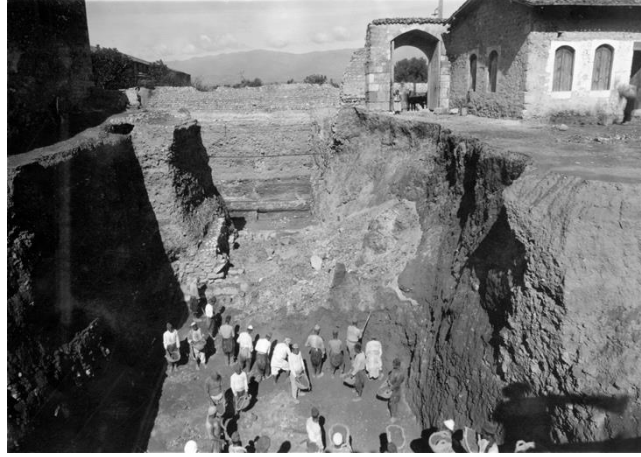
Şekil 1: Kurtuluş Caddesi üzerinde bulunan Savon Hotel'in bahçesinde, Princeton Üniversitesi tarafından yapılan kazılar sırasında antik kentin üzerinde oluşan tabakalara dair kaydedilen görüntü.

konumun olumsuz etkilerinden de tarihi boyunca sürekli olarak etkilenmiştir. Ağır yağışlar ve sellerin olumsuz bir sonucu olarak, çamur ve alüvyon tabakalarının yıllar boyunca Habib Neccar Dağı'nın yamaçlarında ve Asî Nehri'nde yığılması, antik kentin üzerinde zamanla ağır sedimantasyonun oluşmasını engelleyememiştir ( Şekil 1 ). Bulunduğu coğrafi konumun kent üzerindeki diğer olumsuz etkisi de kurulduğu günden bugüne sürekli depremlerle savaşıyor olmasıdır. Kenti etkileyen depremler kentin kaderinin çizilmesinde maalesef ki etkin rol oynamışlardır. Kentin topoğrafyasında yapısal değişikliklere yol açan depremlerin yanı sıra, yaşanan politik olaylar, yangın, kuraklık, veba gibi doğal afetler ile Pers akınları da 6. yüzyılda kentin karşılaştığı diğer sıkıntılardandır.