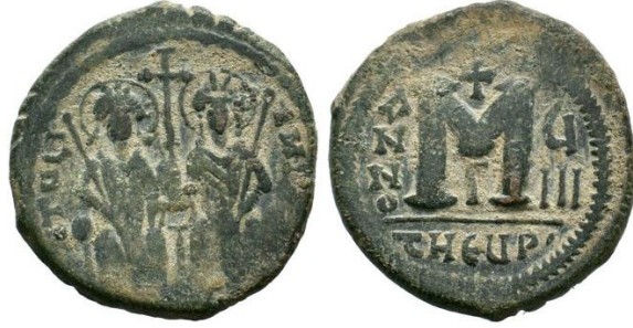
Şekil 4: Kentin adının Theoupolis olarak değiştirildiğini gösteren sikkenin (6. yüzyıl) ön ve arka yüzü.

Confessor, 1997: 270). Deprem sonrasında merhamet göstergesi olarak kentin adı İmparator Justinianus (527-565) tarafından ‘Tanrı’nın Kenti’ anlamına gelen Theoupolis olarak değiştirilmiştir. Kentin adının Theoupolis olarak değiştirildiği bilgisi nümizmatik verilerle desteklenerek, basılan sikkelerde kentin adı THEUP ve ΘΥΠΙΟ olarak belirtilmiştir ( Şekil 4 ). Hristiyanlığın yayılmasında etkin rol oynayan kente, 351/354’te Aziz Babylas’ın, 408-450 yılları arasında Aziz İgnatius’un ve 459’da Yaşlı Simeon Stylites’in naaşları getirilmiştir. Deprem akabinde meydana gelen böyle bir değişiklik, imparator belki de kente dini bir statü kazandırarak, halkın yanında olduğunu, onların acısını paylaştığını göstermek istemiş olabilir.