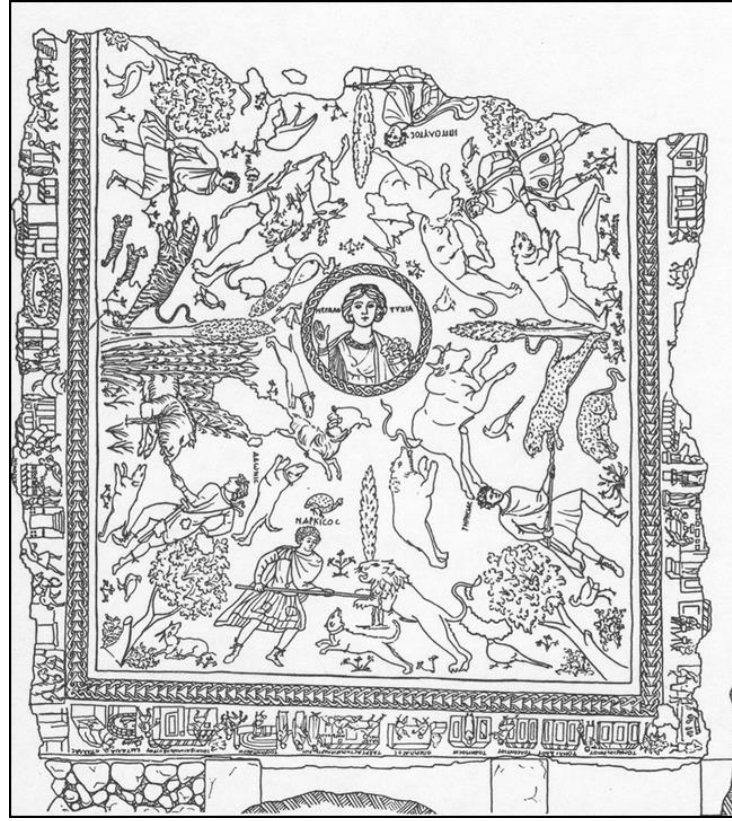
Şekil 2: Megalopsykhia - Yakto Mozaığı planı.