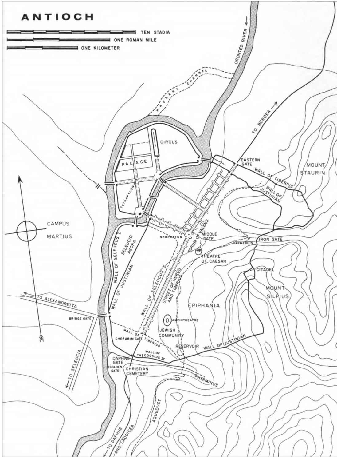
Şekil 5: G. Downey'nin edebi metinler ile Princeton Üniversitesi Kazı Raporları'na göre oluşturduğu kent planı. (Downey, 1961: 765)