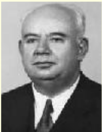
Şekil 1. Dr. Zeki Zeren'in TBMM albümünde yer alan fotoğrafı. 8

Zeki Zeren, 1960 Darbesi ile üniversitelerden uzaklaştırılan öğretim üyelerinden biridir. O zamanlar TBMM'de 12. Dönem milletvekilliği ve Sağlık ve Sosyal Yardım Komisyonu Başkanlığı görevini yürüten Zeren, 1965'te TBMM üyeliği sona erdikten sonra Tıp Fakültesi'ndeki görevine geri dönmüş ve 1 Ağustos 1973'te emekliye ayrıldığı güne kadar akademisyen olarak çalışmaya devam etmiştir. Emekli olduktan kısa süre sonra 19 Kasım 1973'te, 73 yaşında iken İstanbul'da vefat etmiştir ( Şekil 1 ). 1,2,8