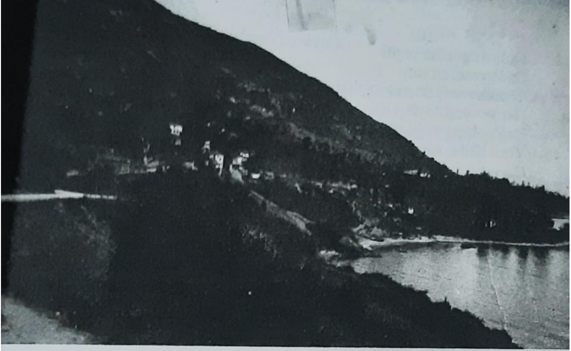
Keçiköyü etekleriyle Kirazlımanı'nın 1930'lu yıllara ait görünümü.

Ordu Keçiköyü'nden bir görünüm yansıtan bu fotoğraf: "Sıtkı Çebi (2000), Ordu Őehri Hakkında Derlemeler ve Hatıralar, (1. Baskı), (Ordu Kent Arşivi), Ordu: Orsev Yayınları. s. 31"den alınmıştır.