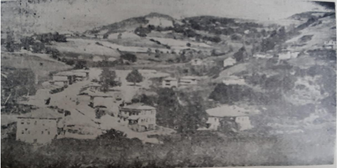
Őairin ailesile ilgili Aybastı Kamununun baęlı bulunduę Gök köy İlçesinden bir görü

Ordu Keçiköyü'nden bir görünüm yansıtan bu fotoğraf: "Sıtkı Çebi (2000), Ordu Őehri Hakkında Derlemeler ve Hatıralar, (1. Baskı), (Ordu Kent Arşivi), Ordu: Orsev Yayınları. s. 31"den alınmıştır.