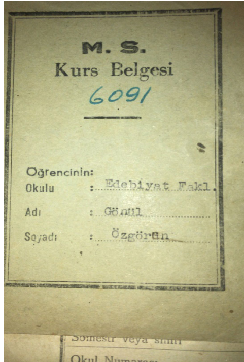
Belge 2 – M.S. Kurs belgesi Kapağı