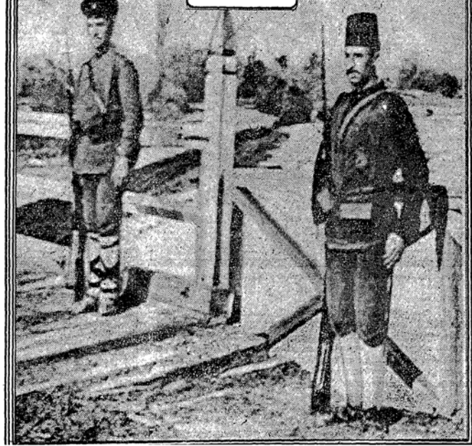
The New York Times, 6 Ekim 1912