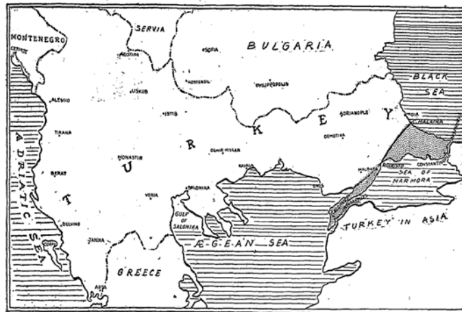
The New York Times, 24 Aralık 1912