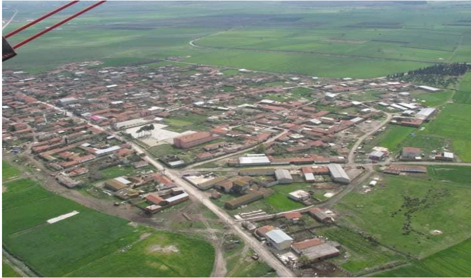
Şekil 3. Kocagöl Köyü

Ancak Kazakların asıl geçim tarzı balıkçılıktı, çünkü onlar buraya göç etmeden önce Don ve Kuban nehirleri ve bunların kollarında balıkçılık yapmaktaydılar ve balık avlama yöntemleri ve aletleri konusunda uzmanlařmışlardı. Manyas Gölü onlar için bulunmaz bir yerdi, çünkü bu göl avlamaya alışkın oldukları yayın, turna, sazan, yılan balıđı, ringa, kefal gibi balıklarla doluydu. Evliya Çelebi'nin naklettiđine göre 1650'li yıllarda burada balıkçılık yapanların devletten izin alması gerekiyordu. Göl kaynakları devlete aitti ve devlet balıkçılık yapmak isteyenlerden maktu vergi