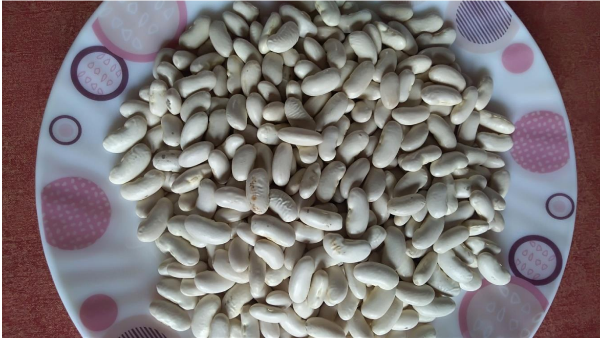
Şekil 5. Manyas Gölü Etrafında Yaygınca Yetiştirilen Kazak Fasulyesi.

Kocagöl ve Bereketli köylerinin yerleşim planları, köy evleri ve Kocagöl'deki iki kilise Kazaklardan geriye kalan maddi kültür unsurlarıdır. Kiliselerden daha büyük olan Troitsa Kilisesi camiye çevrilmiş ve 2000'li yıllardan sonra kible yönünün çevrilmesi için iç tadilat yapılarak otantik yapı bozulmuştur. Meryem'in Göğe Yükseliş Kilisesi ise önce okula dönüştürülmüş ve uzun süre okul olarak kullanılmıştır. Daha sonra terk edilen bina artık yıkılmak üzeredir (Şekil 6). Ayrıca Kazaklara ait ikonlardan 68 tanesi Ayasofya Müzesi'nde, 2 tanesi ise Bandırma Müzesi'nde bulunmaktadır (Altun, 2020).