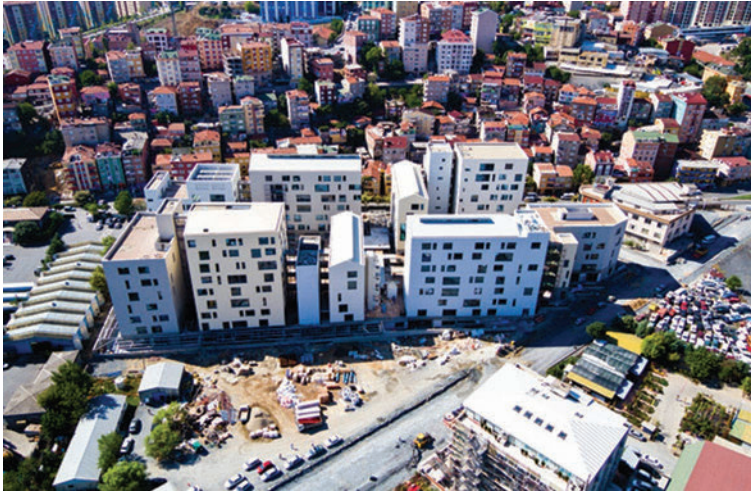
Resim: 4 Tekfen Kağıthane OfisPark Hava Fotoğrafı.

mekanları, bireyin üretirken de tüketebileceği, çalışma ile alışverişin, boş zaman geçirmenin içiçe geçtiği mekanlara dönüşmektedir. Aynı zamanda, günümüzde bireyler kendilerini yaşadıkları ev, yani konutun yanısıra çalıştıkları ofis ve semtle de tanımlamakta ve kendilerini sosyal olarak konumlandırmaktadır. Ofis mekanları, kendilerini mekan tercihleri ile tanımlamaya ve sosyal statülerini belirlemeye yatkın (Bourdieu 1984) üst-orta sınıfa özellikle hitap eder.