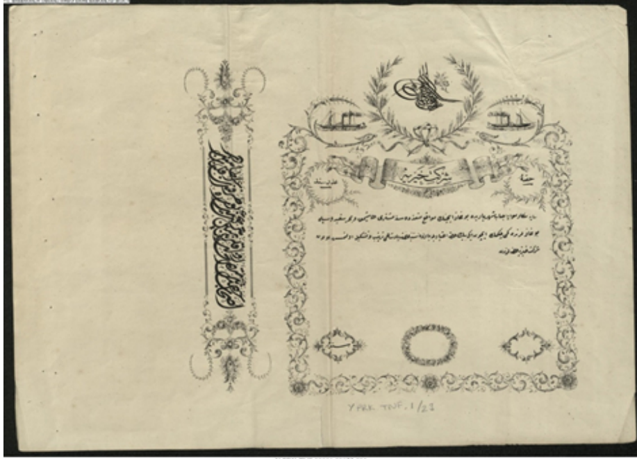
Belge 3. BOA.Y.PRK.TNF.00001.00023.001-Boğaziçi'nde yolcu taşımak ve Bahr-i Sefid (Akdeniz) ve Bahr-i Siyah (Karadeniz) boğazlarında gemi çekmeyi sağlamak için tertip edilen hisse senedi (H. 23 Şevval 1298/M. 18 Eylül 1881)