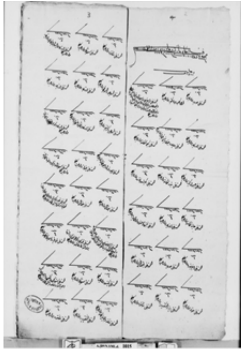
Belge 4. BOA.A.DVN.YML.d.-Bir Menzil ve Yol Defteri Örneği (Bu defterde yollardaki posta menzillerinde duranlar ve aldıkları atlar hakkında bilgiler bulunmaktadır.)