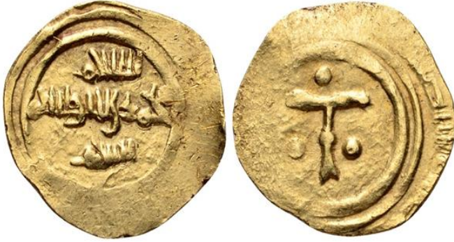
Resim 4: Roger'ın altın tarisi, Palermo veya Messina, 1,03 gr, 14 mm, https://www.acsearch.info/image.html?id=2434522 (Erişim: 10.11.2021)

KA yazılı haç motifleri eşlik etmiştir. Bu durum hiç şüphesiz Sicilya'nın Hıristiyan yöneticilerinin geleneksel İslam inancına ait ibareler taşıyan sikkeleri kendi inançlarına uygun hale dönüştürme çabasıdır. 39 Bununla bağlantılı olarak Sicilya'daki Norman hâkimiyetinin ilk yıllarında İslam dininin temel prensiplerini vurgulayan bazı dini ifadelerin sikkeler üzerinde kendilerine yer bulduklarını belirtmeliyiz. Örneğin I. Roger'ın (1072-1101) altın tarilerinde kelime-i şahadet (La ilahe illallah Muhammedun Resululaha / Allah'tan başka ilah yoktur, Muhammed onun resulüdür) ifadesi bulunurken, (Resim 4) II. Roger'ın kontluk devrine ait tarilerde "La ilahe illallah, vahdehû lâ şerîke leh / Allah'tan başka ilah yoktur, O birdir ve asla ortağı yoktur" İslamî ibaresine rastlanmaktadır. 40 (Resim 5) Şunu da belirtmek gerekir ki erken dönem Norman altın tarilerinde gözükten İslami şahadet ve sadakat ifadeleri, II. Roger'ın 1130 yılında "Hıristiyan kral" ilan edilmesiyle son bulmuştur. 41