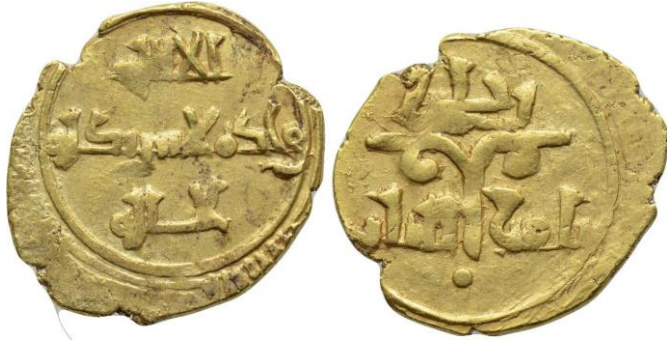
Resim 5: II. Roger'ın altın tarisi, Palermo veya Messina, 1,35 gr, 14 mm, https://www.numisbids.com/n.php?p=lot&sid=1276&lot=799 (Erişim: 10.11.2021)

Ayrıca Norman Sicilya'sının ilk zamanlarından itibaren Salerno ve Amalfi'de anlam bütünlüğü olmayan pseudo-Arabic (sahte-Arapça) altın tariler bastırılırken, (Kat. No. 5) Palermo ve Messina'da bastırılanlar daha doğru Arapça ile darp ettirilmiştir. Bunlar da