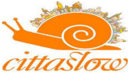
Şekil 1: Cittaslow Logosu