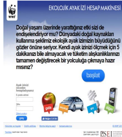
Şekil 2. Ekolojik ayak izi hesaplama motoru (WWF-Türkiye 2017)

(WWF) tarafından geliştirilen ekolojik ayak izi hesaplama motoru kullanılmıştır (Şekil 2).