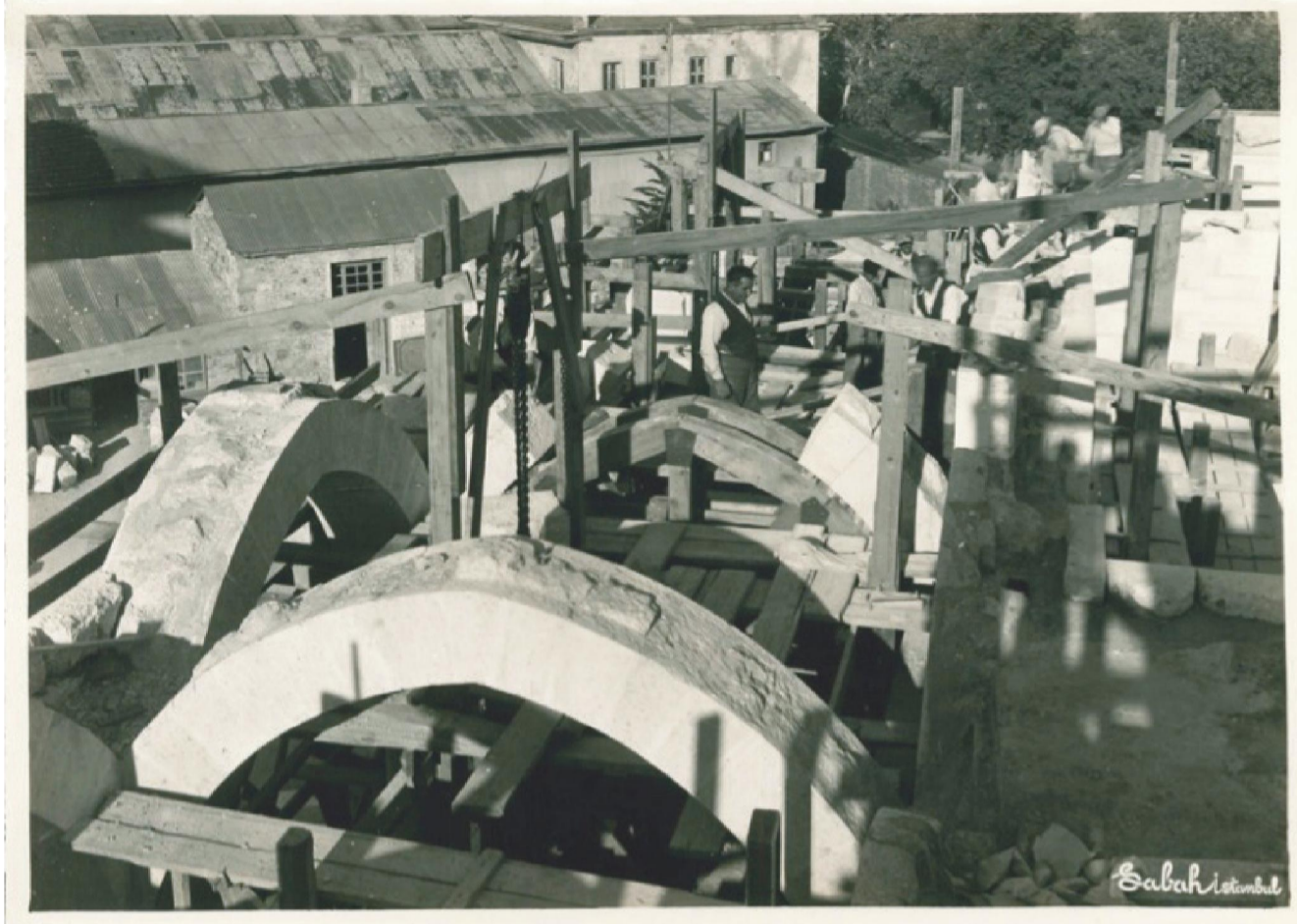
Camii İnşaatından Görünüm https://artsandculture.google.com