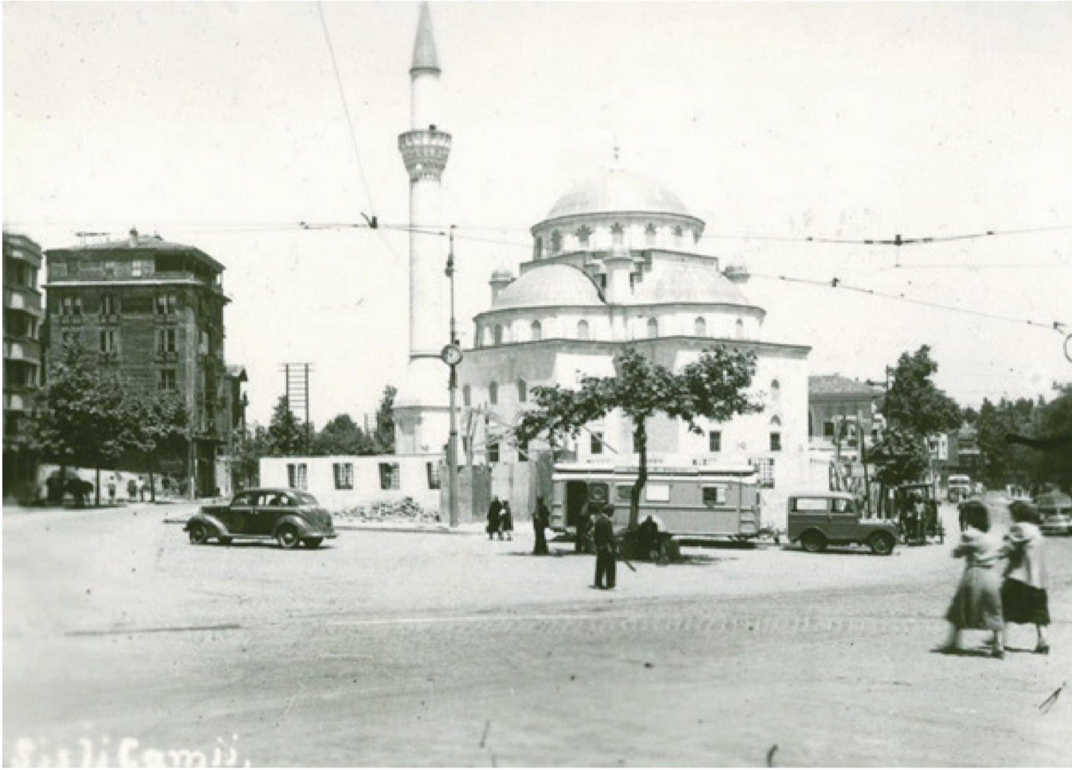
Şişli Camii'nin Yapımından Hemen Sonra Alınan Fotoğraf (1950)