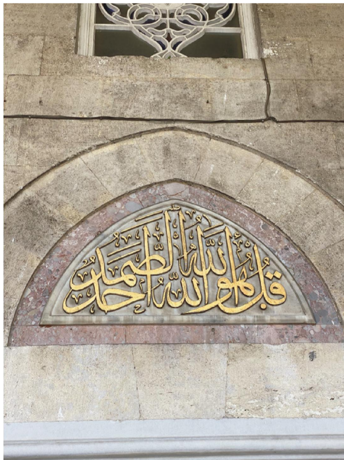
İhlas Sûresi 1-2. Ayetler.