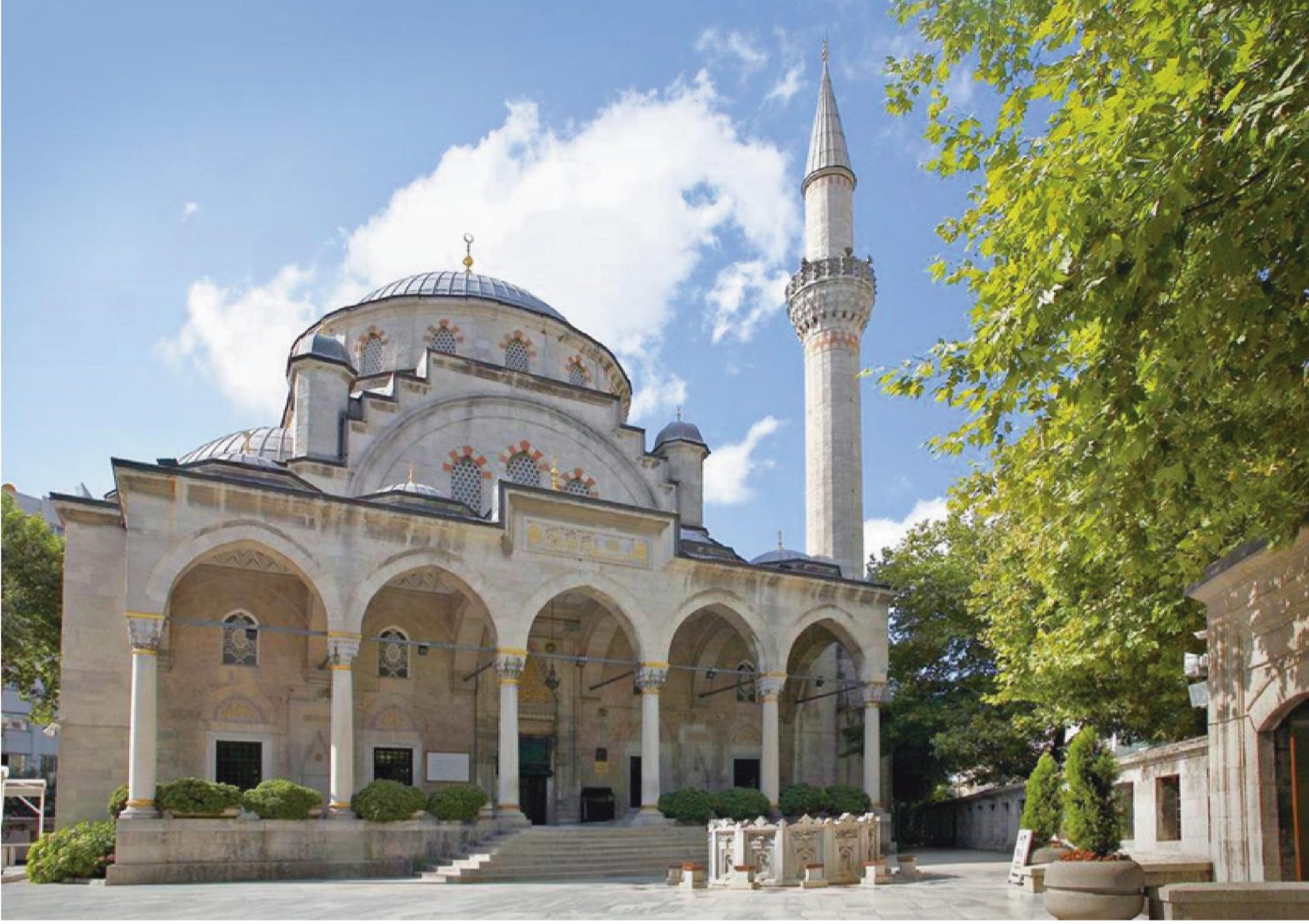
Camii Avlusu ve Şadırvanıyla Görünümü