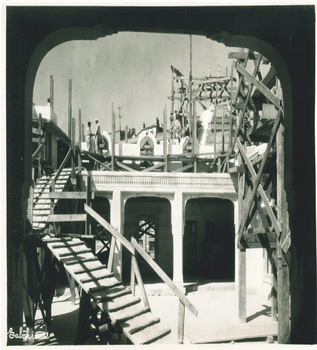
Camii İnşaatından Görünüm https://artsandculture.google.com