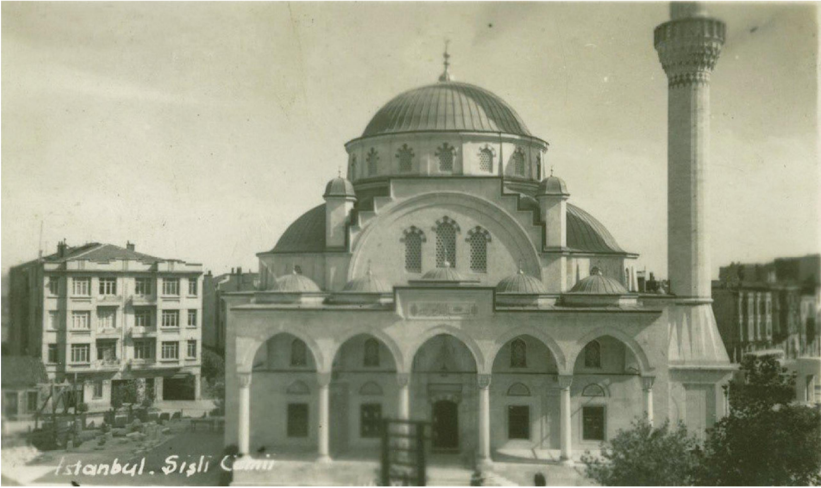
Şişli Camii Avludan Alınmış Bir Fotoğraf (1950'li Yıllar)