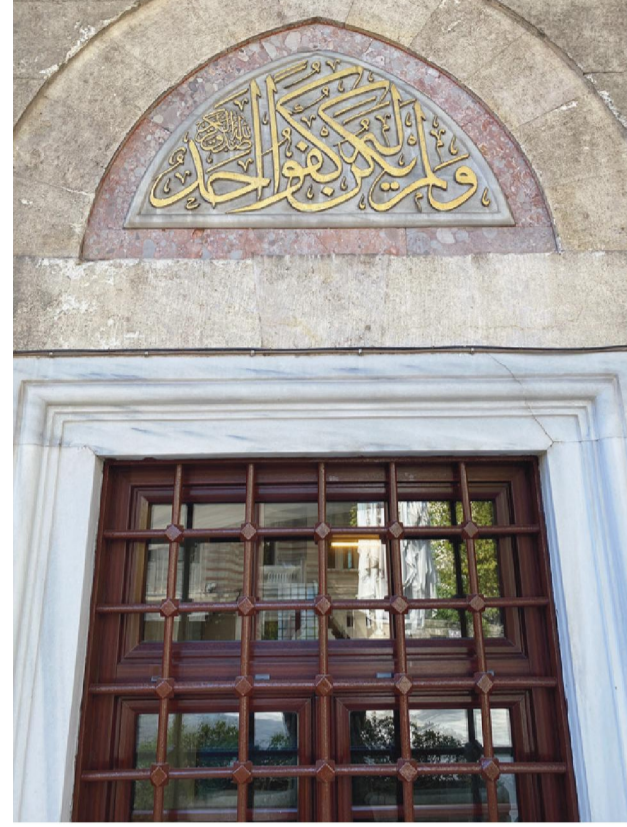
İhlas Sûresi 4. Ayetler.