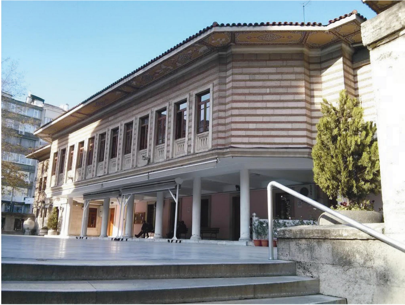
Şişli Camii Vakfı ve İdari Binaları