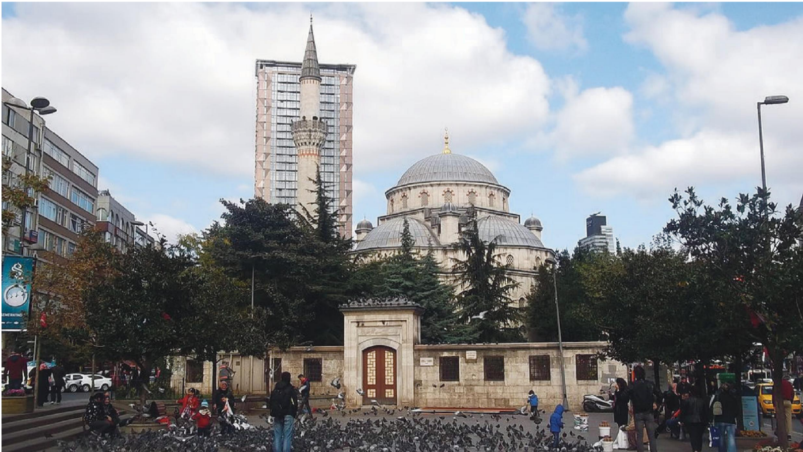
Yakın Zamanlardan Bir Fotoğraf