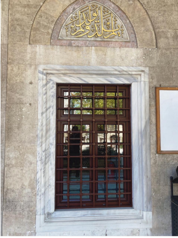
İhlas Sûresi 3. Ayet.