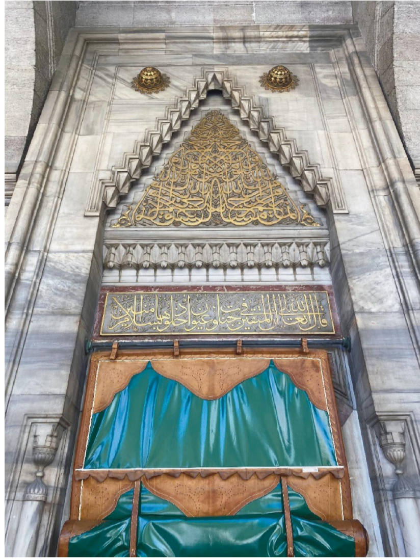
Portal Kapı ile Birlikte İstif'in Görünümü: اَدْخُلُوهَا بِسَلَامٍ اٰمِنِيْنَ Hicr Sûresi 45