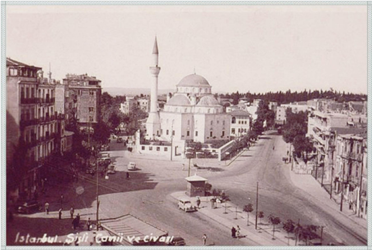
Şişli Camii'nin Eski Bir Fotoğrafı (1950 Sonrası)