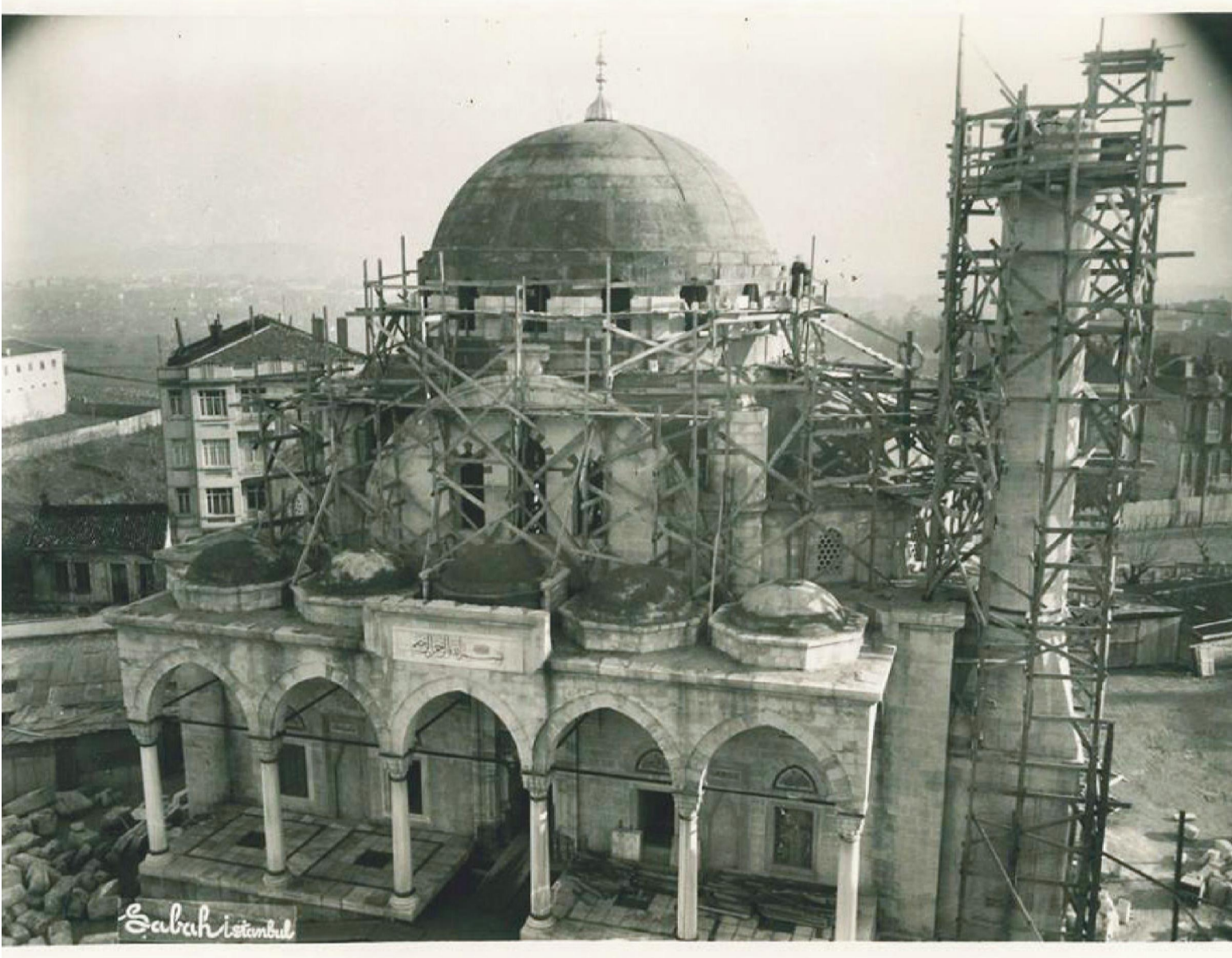
Camii İnşaatından Görünüm