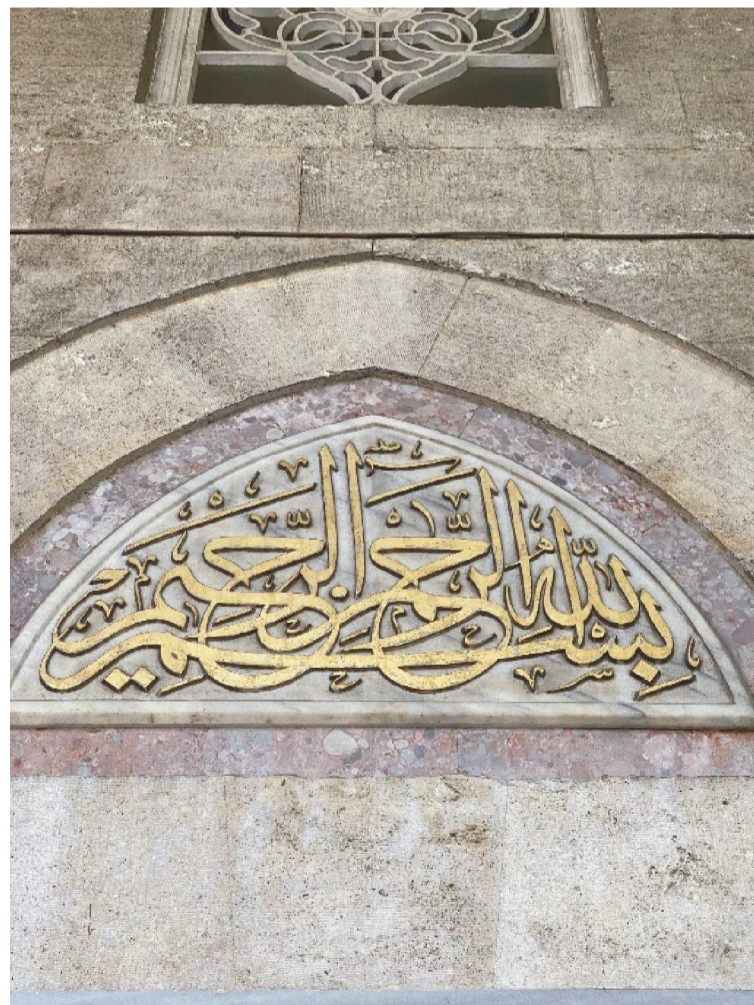
Şişli Camii Girişi: Hâmid Aytaç'ın Besmele Kompozisyonu Hâmid Aytaç'ın Yazdığı Besmele. (Fazıl Tekinel'in objektifinden)