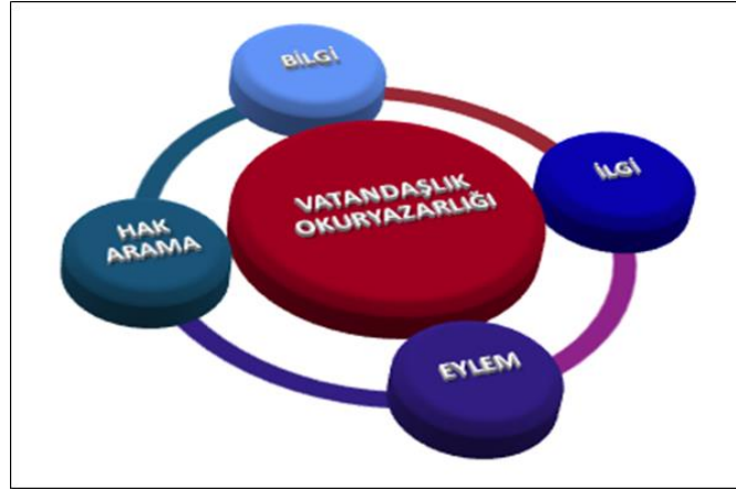
Şekil 1. Vatandaşlık Okuryazarlığının Alt Boyutları

Vatandaşlık Okuryazarlığının bilgi alt boyutunda; devletin en temel hukuk kuralı olan anayasa ve bu anayasa içerisinde bireylere tanınmış temel hak ve hürriyetler, devletin temel görevleri ve hakların korunması konusunda başvuruda bulunulabilecek temel kurumlar hakkında bilgi sahibi olunması; ilgi alt boyutunda genel kamu politikalarına, yerel ve ulusal politik kararlar ile toplumsal sorunların çözümünde siyasi partiler ve sivil toplum örgütlerinin çalışmalarına karşı bireyin duyduğu ilgi, eylem alt boyutunda; bireyin herhangi bir zorlama olmadan kendi inisiyatifi ile yasal siyasi süreçlerde yer alması ve başkaları ile iletişimde bulunabilmesi ve son olarak hak arama alt boyutunda ise yasalar tarafından kendisine tanınmış hak ve hürriyetleri kullanabilme ve gerektiğinde bu temel hak ve hürriyetlerin korunması için yasal mercilere başvuruda bulunabilme yeterliliği yer almaktadır.