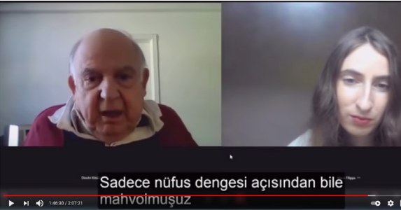
Yunan Profesör Dimitris Kitsikis ile Türk-Yunan Konfederasyonu ve Tarihi Hakkında Röportaj.

Kaynak: https://youtu.be/TLacvpaVdOI?t=6314 ve https://youtu.be/TLacvpaVdOI?t=6390 erişim 24 Şubat 2021.