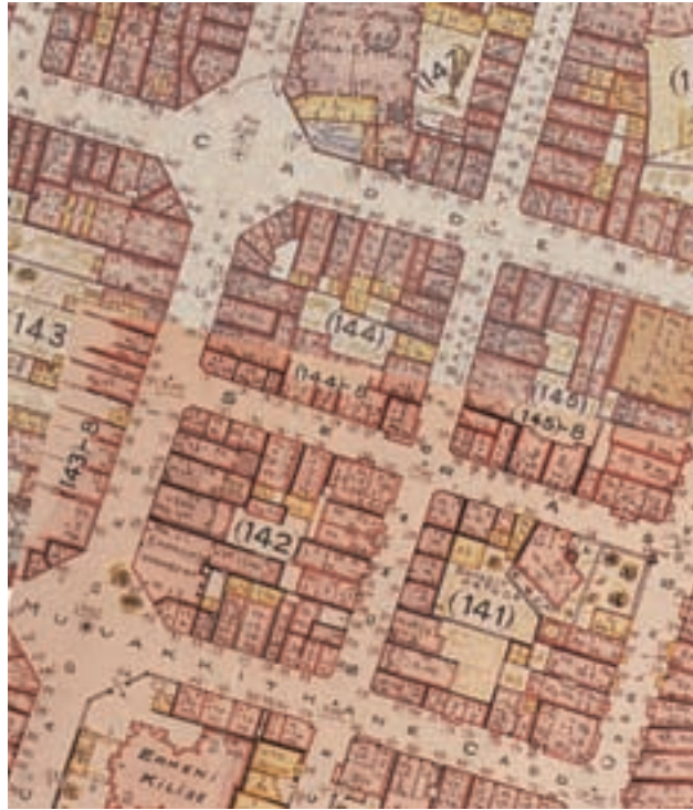
Harita: 2 Pervititch haritası, 1938

Günümüzde Kadıköy merkezi, geniş bir hinterlanda sahip ve büyük bir alana yayılmış olan bir kentsel merkez haline gelmiştir. Kadıköy merkezi alanı, iskeleler bölgesinden Altıyol'a, Bahariye ve Moda'ya, oradan da Salı Pazarı bölgesine doğru ilerlemektedir. Bu merkezi alan, İstanbul'un Anadolu yakası sakinleri için farklı ulaşım türlerinin bir araya geldiği bir ulaşım odağı, özellikle giyim, kırtasiye, gıda, beyaz eşyada uzmanlaşmış ticari işlevi, kültürel ve rekreasyona yönelik bir merkez olarak fırsat çeşitliliğini barındırmaktadır. Kadıköy merkezi iş bölgesi içinde Çarşıiçi bölgesi, hem mekansal karakterinin gıda pazarı olarak özelleşmiş olması, hem de canlı bir kentsel mekan olmasıyla özel bir öneme sahiptir. Kentsel canlılığın yüksek oranda yaşandığı Çarşıiçi bölgesi, daha önce değinilen parametreler açısından da olumlu nitelikler göstermektedir.