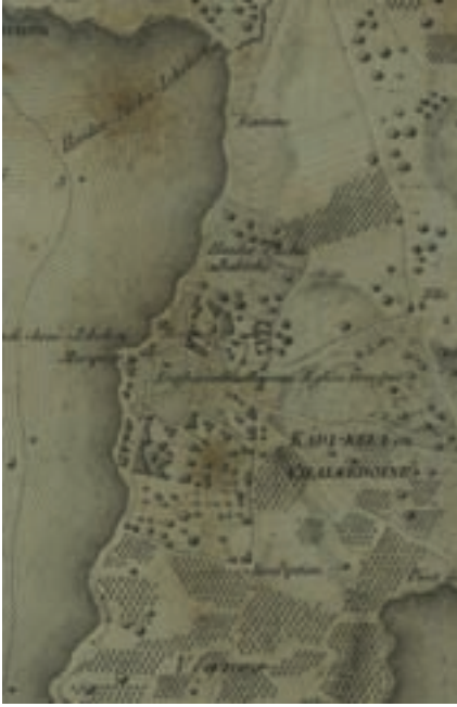
Harita: 1 Raimond haritası