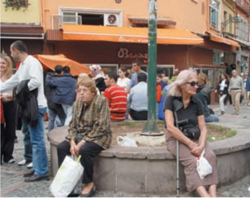
Resim Kentsel Canlılık Parametrelerinin Kadıköy Çarşı İçi Bölgesi'nde Değerlendirilmesi

örtün sarmaşıklar, alana yine İstanbul Kimliği ile bütünleşen bir karakter vermektedir. Ancak tabelalar ve tentelerdeki özensizlik, alanın ve arayüzlerin algılanmasında güçlükler yaratmaktadır.