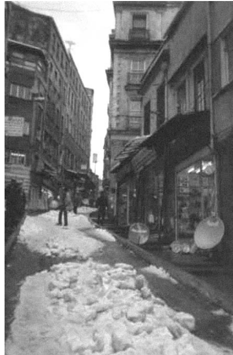
Şekil: 1 Yüksek Kaldırım