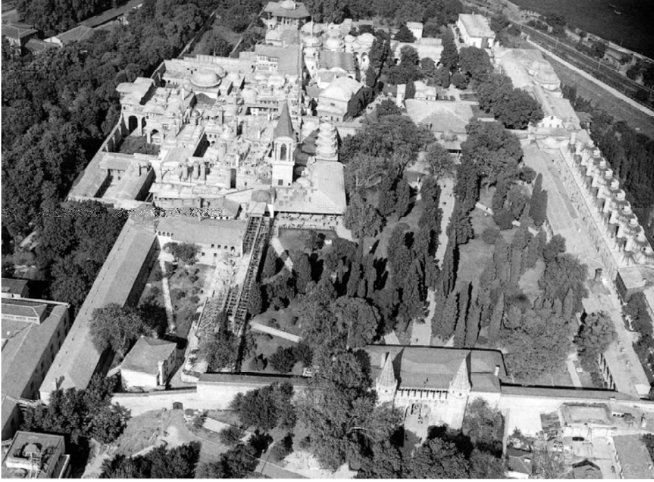
Resim:4 Topkapı Sarayı II. ve II. avulunun kuşbakışı görünümü (Necipoğlu 2007, 33)