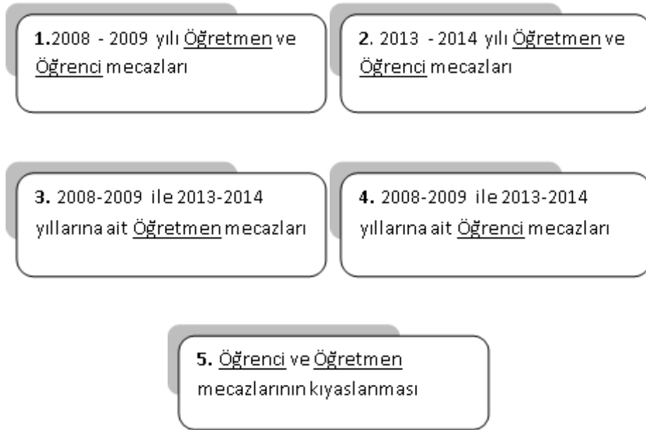
Şekil 2. Çalışmanın modeli.

Okul kültüründe değişim yaşanıp yaşanmadığının ve bir değişim söz konusu ise bunun öğrenci ve öğretmenler açısından hangi yönde algılandığının anlaşılması amacıyla, eski okul müdürü ile mevcut okul müdürü mecazlar üzerinden incelenmiştir. Okulun eski müdürü, uzun süredir lise öğrencileri ile çalışan ve dolayısıyla o yaş grubu öğrencilere ilişkin deneyimleri olan bir okul müdürü iken; yeni müdürün daha önceki deneyimlerinin ilköğretim okuluna ve dolayısıyla bu yaş grubundan öğrencilere ilişkin olduğu, belirtilmesi gereken bir noktadır. Ayrıca öğretmenlerden edinilen bilgiler sonucunda, özellikle eski dönemde okulun disiplin konusunda sorunlar yaşadığına ilişkin bir imajının olduğunun altı çizilmiştir. Öğrenciler ise, yeni dönemi tercih edilen mecazlarda görüleceği üzere, olması gerekenden fazla kontrol altına alınmaya çalışıldıkları biçiminde yorumlamaktadırlar.