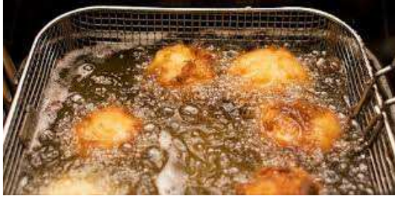
Şekil 2. Kızartma sırasında yağda oluşan fiziksel değişimler

Kızartmada kullanılan yağlar, birkaç kez kullanıldıktan sonra zehirleyici forma dönüşmekte ve insanlarda kanser, kalp-damar hastalıkları vb. neden olmaktadır. Bir sefer kullanılan yağ, ikinci defa kullanıma kadar bekleme esnasında polimerizasyona tabi olduğundan tekrar kullanılmamalı ve atık yağ formuna dönüştürülmelidir.