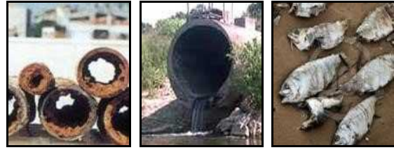
Şekil 3. Bitkisel atık yağların yarattığı çevre sorunları örnekleri

Atıksu kirliliğinin %25'ini, bitkisel atık yağlar oluşturmaktadır. Alıcı ortama ulaşan bitkisel atık yağlar, kuşlara, balıklara ve diğer canlı türlerine zarar vermektedir. Bu nedenlerden ötürü, gelişmiş ülkelerde kullanılmış bitkisel ve hayvansal yağların kanalizasyona, yüzeysel sulara bırakılması yasaklanmıştır. Bitkisel atık yağların yarattığı çevre sorunları Şekil 3'de örneklerle gösterilmiştir (Anonim, 2016 b). Bitkisel atık yağların çöp içerisine karıştırılarak uzaklaştırılması yasaktır. Çöpe dökülen atık yağlar, katı atık deponi alanlarında yangın çıkmasına neden olmaktadır. Köpek, ayı ve martı gibi bazı kuş türleri, bitkisel ve hayvansal atık yağları sevdiklerinden, çöpe karıştırılan atık yağlar deponi alanlarına bu tür hayvanların gelmesine yol açmaktadır. Ayrıca, kullanılmış bitkisel yağlar, yeraltı sularının da kirlenmesine neden olurlar. Ülkeler için değerli bir içme suyu kaynağı olan yeraltı sularını arıtmak, bu nedenle oldukça pahalı ve zordur (Öztürk, 2006).