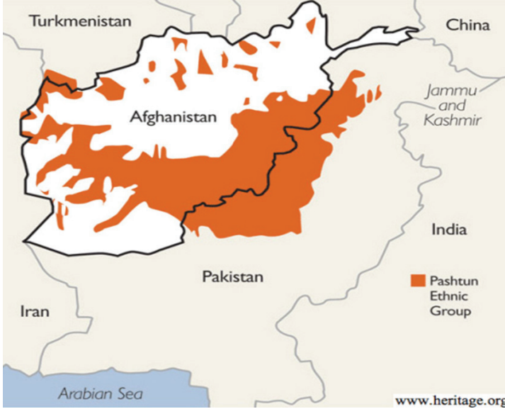
Harita 2: Peştun Nüfusunun Dağılımı

Peştunlar Afganistan'ın güney ve merkez bölgelerinde yoğun olarak yaşayan ve ülke nüfusunun yaklaşık olarak yüzde 38'ni oluşturan bir etnik grup olarak biliniyor. Ülkenin Kuzey bölgelerinde, özellikle de sınır bölgelerinde bir diğer yoğun olarak yaşayan nüfus ise başını Özbeklerin çektiği, yüzde 15 ile yüzde 20 civarında, içinde Türkmen ve Kırgız olan Türklerdir (Kırım Haber Ajansı, 2018).