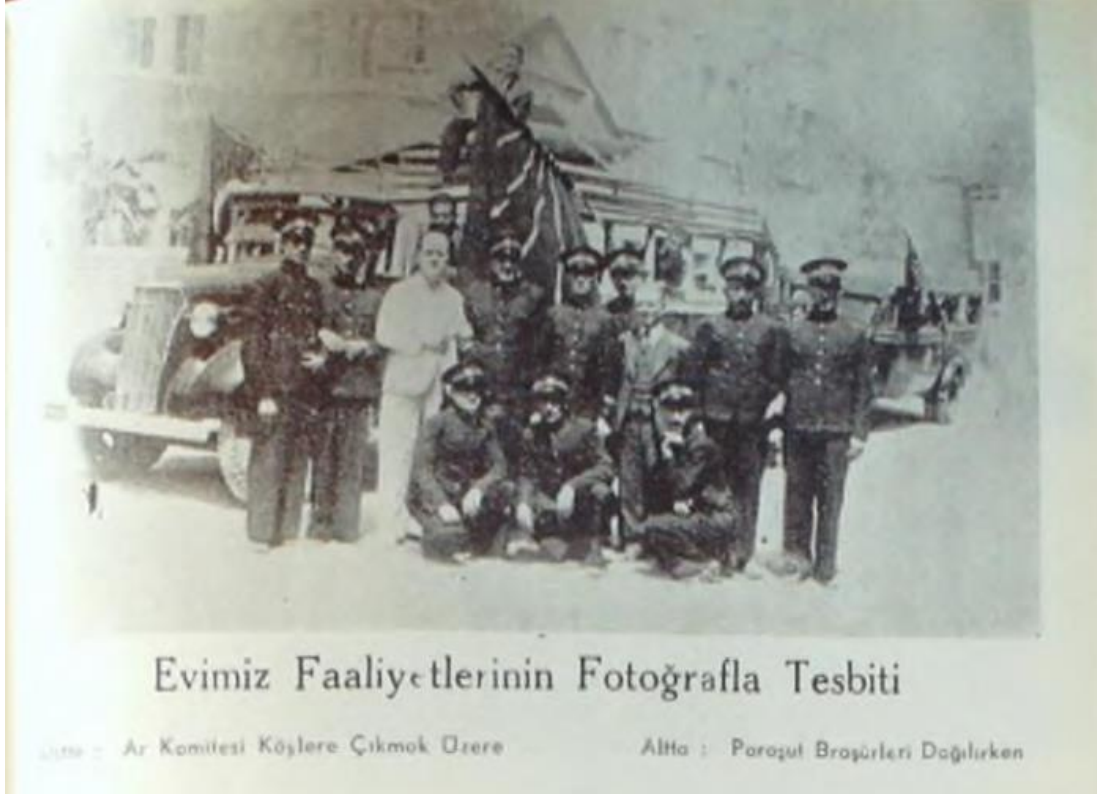
Resim 2: Ar Komitesi Köylere Çıkmak Üzere, "Evimiz Faaliyetlerinin Fotoğrafla Tesbiti", Görüşler Kültür Dergisi , 29 (Ekim 1941), 39.