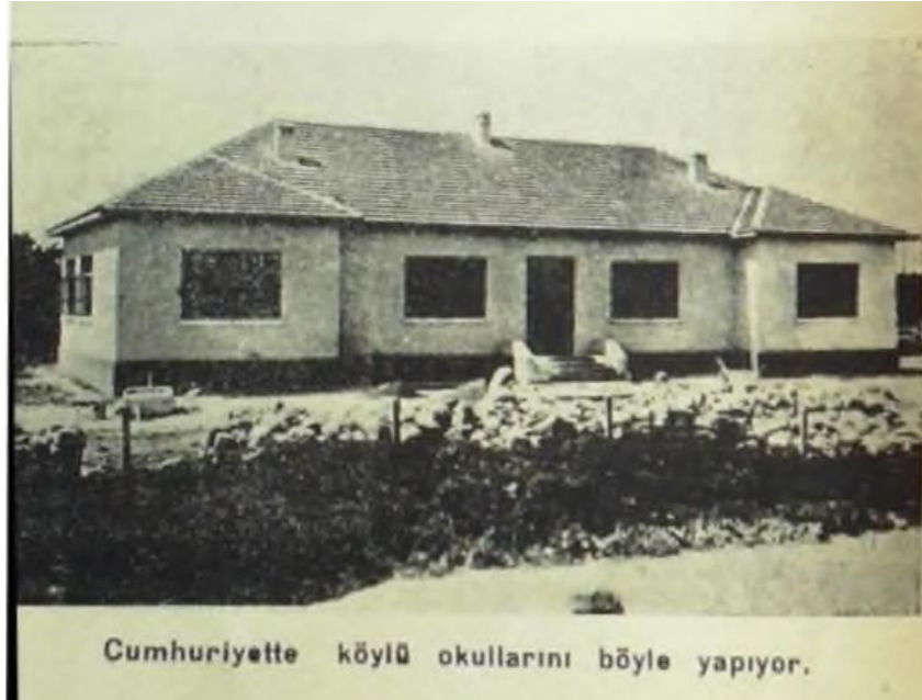
Resim 1: Köy Okullarına Örnek, Gürsel, "Köylerde", 32.

"Adana Halkevi", Görüşler Kültür Dergisi , Cumhuriyet'in 15. Yıldönümü Onuruna Özel Sayı, 22-23.