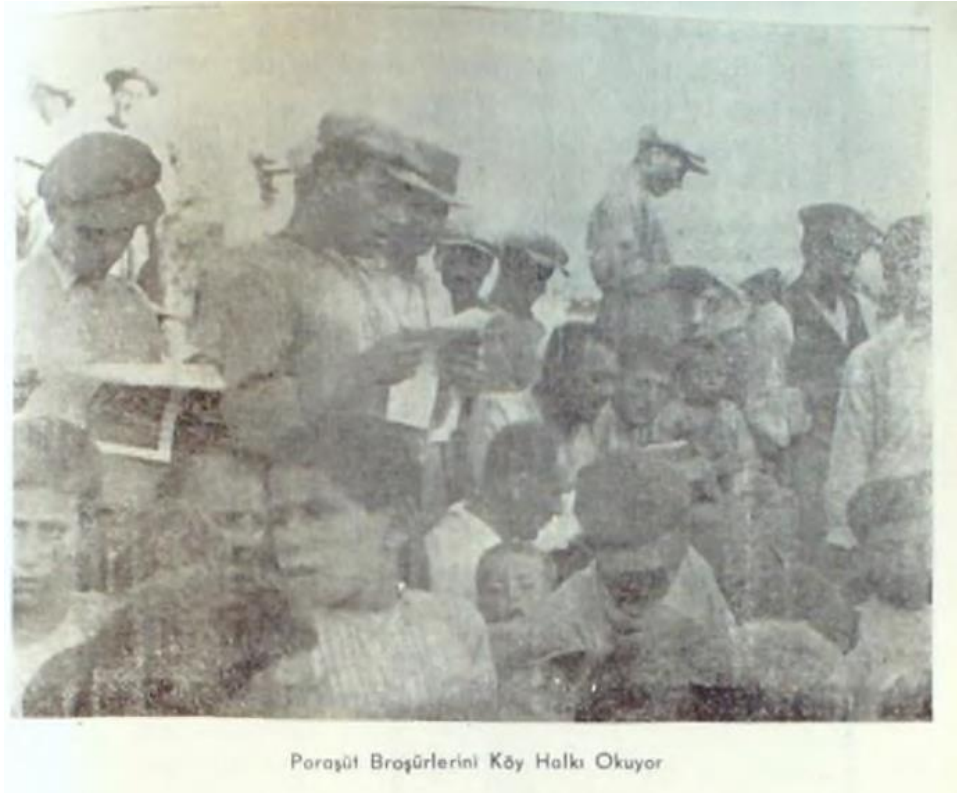
Resim 3: Paraşüt Broşürlerinin Köylü Vatandaşlar Tarafından Okunması, "Evimiz Faaliyetlerinin Fotoğrafla Tesbiti", Görüşler Kültür Dergisi , 29 (Ekim 1941), 41.