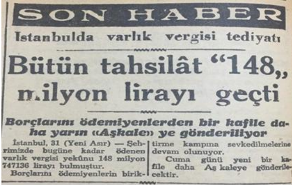
Resim 10: İstanbul'daki Vergi Tahsilatları 81

Çalıştırılmak için Aşkale'ye gönderilecek olan yükümlüler sevk edilmeden önce toplama kamplarına getirilip sağlık kontrolünden geçirildiler. Hastalık ve sakatlık halleri dışında herhangi bir durum sevke engel görülmedi. Kamplara gönderilecek bazı mükellefler, yurt dışına kaçmaya çalıştı ancak sınırda yakalanıp yaşadıkları şehirlere geri gönderildiler. 82