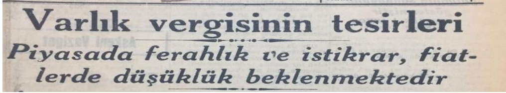
Resim 5: Varlık Vergisi'nin Tesirleri 47

da emlak karşılığı avans verecekti. Merkez Bankası, Ziraat Bankası, Türkiye İş Bankası, Emlak ve Osmanlı Bankası ise varlık vergisi mükellefleri için bir kolaylık sağlayıp ticari krediler için belirlenmiş olan sınırların üstünde kredi vermek konusunda serbest bırakılmışlardı. 46