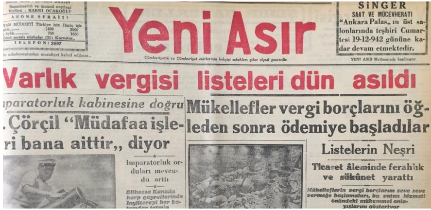
Resim 7: Varlık Vergisi Listelerinin Asılması 55

Yeni Asır gazetesinin Varlık Vergisi ile ilgili manşet haberinde, vergi listelerinin eksiksiz olarak asıldığı bilgisi verildi. Haberde vergilerin belirlenme süreci ile ilgili “İlk olarak şunu tebarüz ettirmek isteriz ki, varlık vergisinin şu anda tespit ve ilân edilmiş rakamları, bu vergiyi tespit eden komisyonun en büyük dikkat ve itinasına mazhar olmuş, tespitte mutlak bir adalet gösterilmiş, mükelleflerin hakikî durumları mümkün mertebe öğrenilebilmiştir.” bilgisi verildi. Haberin devamında vergi mükelleflerinin hepsine fırsatçı veya vurguncu demenin doğru olmadığı, mükelleflerin hepsinin İzmir halkının yakından tanıdığı ve sevdiği vatandaşlar olduğu açıklaması yapıldı. 56