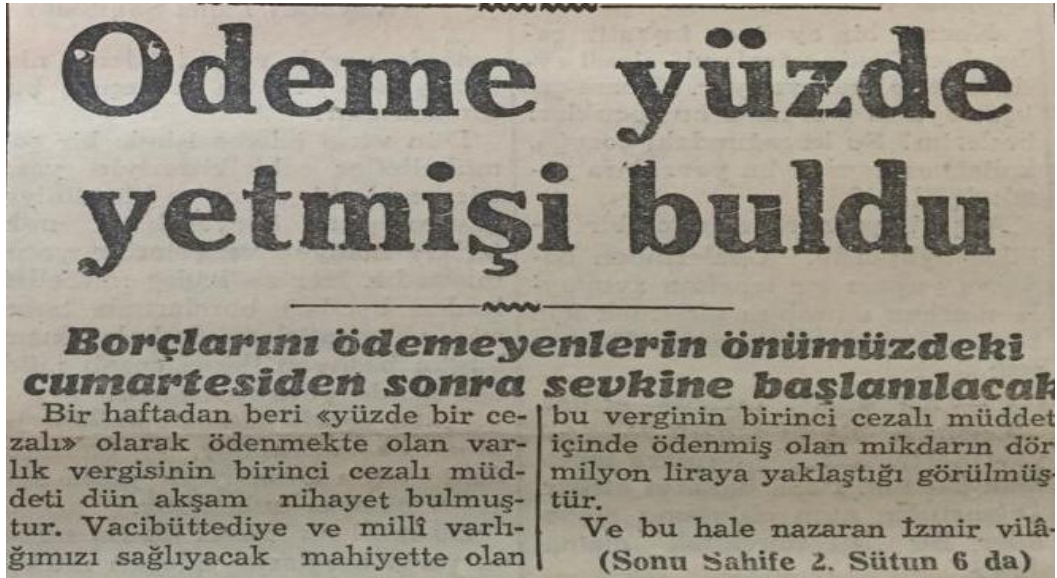
Resim 8: Tahsilat Edilen Miktar ve Aşkale'ye Sevkler 70

İkinci listelere göre 41 Müslim, 19 Gayrimüslim vergiden sorumlu tutuldu. İkinci ödemeler ile İzmir'de tahsil edilen vergi miktarı 24.635.000 liraya ulaştı. Bazı mükellefler vergi miktarına itiraz ederek Meclis'e dilekçe verdi ve toplam 176,000 lira vergi silindi.