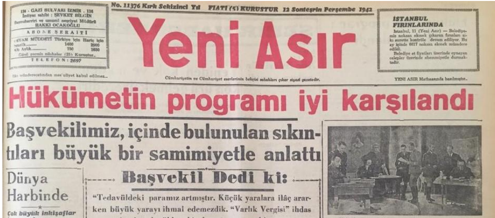
Resim 1: Şükrü Saraçoğlu’nun Hükümet Programı Açıklaması 30

Bu yıllarda tedavüldeki para miktarı oldukça artmış ve paranın değeri düşmeye başlamıştı. 1938 yılı sonrasında Türk lirasının değer kaybetmesi altın fiyatlarına da yansdı. Altın fiyatlarında dengesiz ve yüksek oranlarda artış yaşandı. Tedavüldeki parayı normal seviyeye indirmek de verginin amaçlarından birisi olarak söylendi. 29