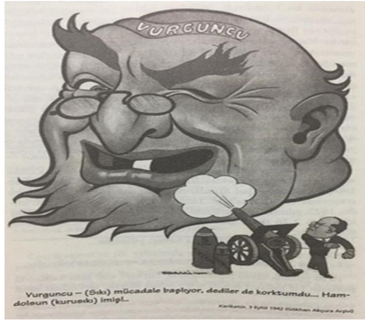
Resim 3: Vurguncular İle İlgili Karikatür 38

Tarhan'ın ardından söz alan Refik İnce ise kanunun işleyişine dikkat edilmesi üzerine vurgu yaptı. Memurlar görevini düzgün bir şekilde yapmaz ise bir faydasının görülemeyeceğini, görevler layığıyla yerine getirildiği takdirde devletin kurtulacağını söyledi. 37