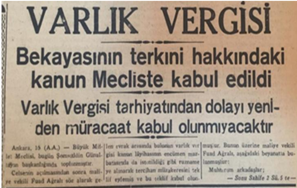
Resim 12: Varlık Vergisi'nin kaldırılması kararı 95

Varlık vergisi uygulamalarının sonuçları hem dış politikada hem de devlet içinde sıkıntılara sebep oldu. 93 Artan baskılar sonucu yaklaşık 16 ay yürürlükte kalan Varlık Vergisi, 17 Mart 1944 tarihli ve 4.530 sayılı "Varlık Vergisi Bekayasının Terkinine Dair Kanun" ile tasfiye edildi. Tasfiye süreci 1943 yılları sonuna doğru başlayıp devam eden süreçte mükelleflere uygulanan yaptırımlar hafifletildi. Düşük vergiler ödeyen esnaf, istisna durumlar dışında işlerine devam etti. Yüksek vergileri olan mükelleflerin ise bir kısmı piyasadan çekildi. 94