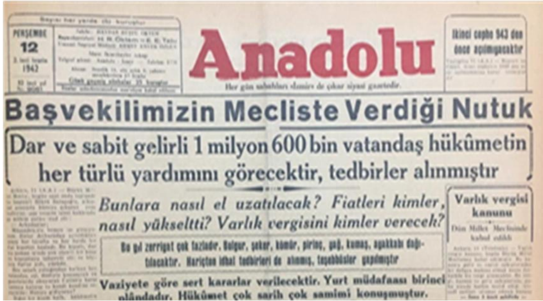
Resim 4: Şükrü Saraçoğlu'nun Ekonomik Tedbirler İle İlgili Meclis Konuşması 43