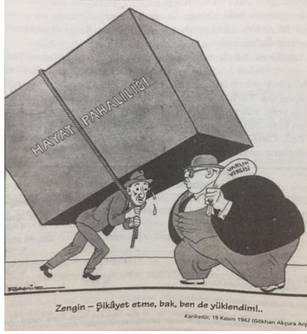
Resim 9: Varlık Vergisi Konulu Karikatür 77

Vergisini hiç ödemeyenler ve vergisini kısmen vermiş ve mal kaçırmış olanlar, ilk etapta gönderilecekler arasındaydı. Karara göre yükümlülere günde 250 kuruş ödenecekti. Bunun 60 kuruşu vergi olarak kesildikten sonra kalan 190 kuruşun yarısı Varlık Vergisi, yarısı da iâşe bedeli olarak alınacaktı. 78 Yiyecek, giyecek ve barınma ihtiyaçları mükellefler tarafından karşılanacak, mükellefler borçlarını bitirinceye kadar çalışmak zorunda kalacaklardı. Çalışma sırasında hastalananların iâşe ve masraflarının kendilerine ait olmak üzere yakındaki devlet ve belediye hastanelerinde tedavi edilecekleri gibi hususlara da açıklık getirildi. 79