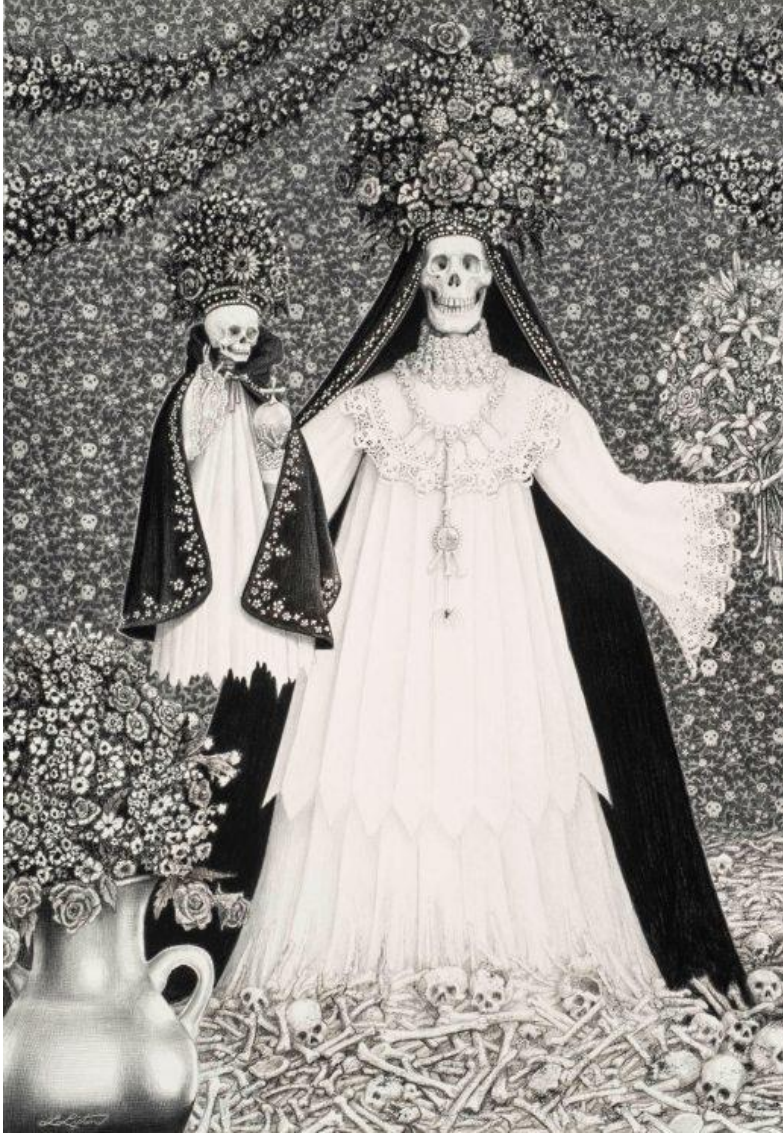
Görsel 2. Laurie Lipton, 2016, "Kutsal Kemiklerin Meryem Anası", Kâğıt Üzerinde Kömür ve Grafit, 22.5 x 15 cm

yapı İsa'yı anımsatırcasına kollarını iki yana açmış ve ana iskeletin ayaklarından gelen sarmaşık dallarından oluşan dikenli tacıyla acı içinde ağlamaktadır. Bu taç, bir ışık kaynağı olmakta ve tüm resmi ışığıyla aydınlatmaktadır. İskelet imgesi, burada ölümün, yok oluşun ve de yeniden doğuşun sembolü olurken aynı zamanda İsa'nın çektiği acıların temsili niteliğindedir.