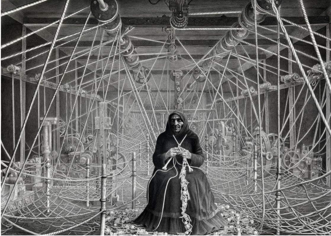
Görsel 5. Laurie Lipton, 2011, “Kemik Örucü”, Kâğıt Üzerinde Kömür ve Grafit, 28 X 39 cm.