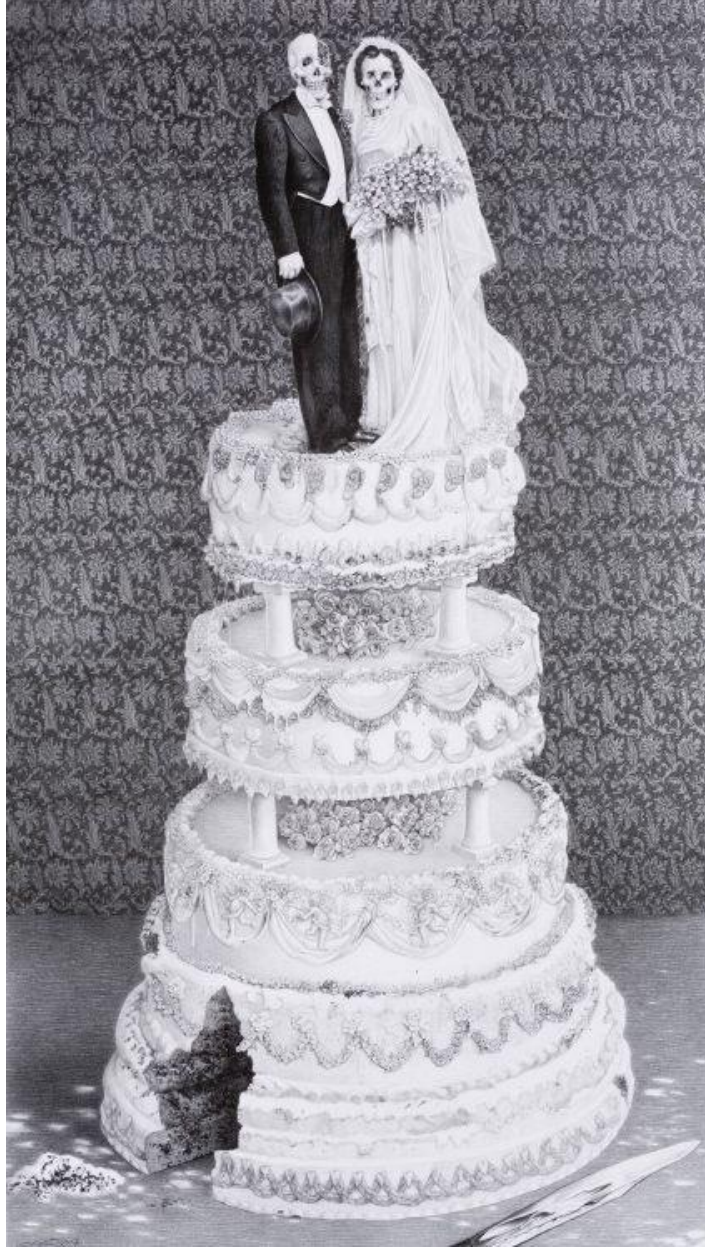
Görsel 4. Laurie Lipton, 2007, "Sonsuz Aşk", Kâğıt Üzerinde Kalem, 38 X 21.5 cm.

temsili bir taç takmaktadır. Başındaki kocaman ve işlemeli tacına yakından bakıldığında üzerinin böcek imgeleriyle dolu olduğu görülmektedir. 6 adet böcek imgesinin yer aldığı tacın tam ortasında yer alan göz imgesi, tanrının her şeyi gören gözünü temsil etmektedir. Başındaki taç insan kemiklerinden oluşan bu figürün gözlerindeyse ağ ören iki örümcek dikkat çekmektedir. Boynunda dizi dizi inciler taşıyan İmparatoriçenin boynundaki incilere yakından bakıldığında her bir incinin birer kurukafadan oluştuğu görülmektedir. Sağlığın ve dişiliğin sembolü inciler bu resimde ölümün temsili kuru kafalar şeklinde betimlenmektedir (Wilkinson, 2011). Boynunda yer alan diğer bir kolyenin ucundaysa saat imgesi yer almaktadır. Bu imge, duran zamanın temsili niteliğindedir. Figürün tacında, kıyafetinin kollarında ve ellerinin üzerinde yer alan böcek imgeleri iskelet imgesiyle adeta zıtlık oluşturmaktadır. Bu eserde İskelet imgesi ölümün temsili olarak böcek imgeleriyle yaşamın sembolü olarak kullanılmaktadır.