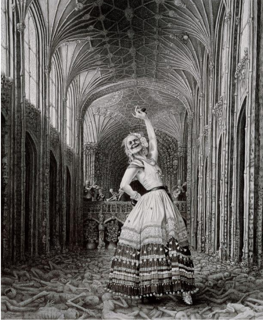
Görsel 6. Laurie Lipton, 2005, "Kemik Kadın", Kâğıt Üzerinde Kömür ve Grafit, 41.5 X 34.25 cm.

kırışik olarak betimlenmiş elleri ve kırışik kırışik olmuş yüzüyle adeta kimliksiz bir beden haline gelen bu figür, başına takmış olduđu eşarpı izleyicide kadın imajı yaratmaktadır (Büyükkaya, 2014). Yüzündeki kırışiklikler figürün yaşlı bir birey olduđunu vurgularken aynı zamanda bilge de bir kişilik olduđunu göstermektedir. Resmin adından da anlaşılacağı üzere bu figür bir kemik örücü yani dönüştürücüdür. Boynundaki ipi ve iki elindeki insan kemiklerinden yapılmış şişlerle küçük insan iskeletleri örmekte bir anlamda onları yaratmaktadır. Resim yüzeyindeki iplerin sistematik bir kurgusu oluşu ve tüm bu iplerin kadının ellerinde birleşmesi onun işinin ne kadar önemli olduđunu gözler önüne sermektedir. Bu kadın imgesi, yaratıcı gücün sembolü olarak izleyici karşısına çıkmaktadır.