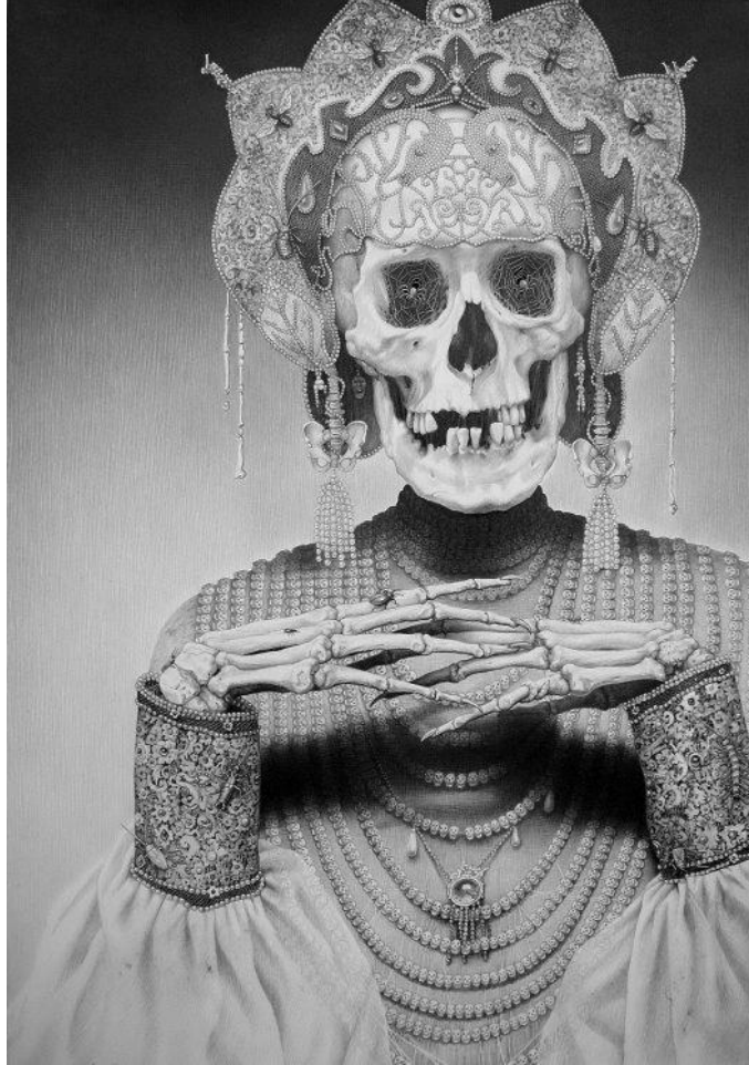
Görsel 3. Laurie Lipton, 2007, "Ölüm İmparatoriçesi", Kâğıt Üzerinde Karakalem, 22.75 x 16 cm.