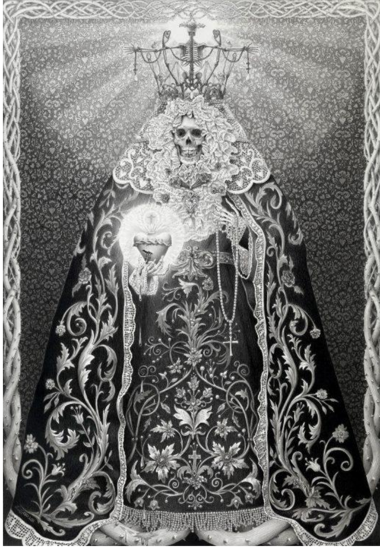
Görsel 1. Laurie Lipton, "Işık", 2011, Kâğıt Üzerinde Kömür ve Grafıt, 35 x 24 cm.