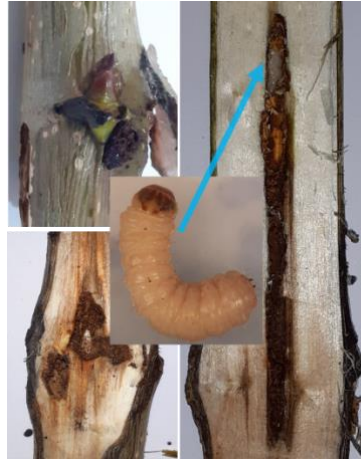
Şekil 2. Hasköy genç kavak sürgünlerinde Saydam kanatlı kavak kelebeği, Paranthrene tabaniformis (Lepidoptera: Sesiidae)'in larvası ve zarar şekli.

Zarar gören yaşlı ağaçların gövdelerinde şişkinlik ve taç kaybı gözlenmiştir. Ayrıca yoğun popülasyonu durumunda taç ve kabuğun büyük bölümlerinde nekrozlar görülmüştür. Hasköy Kurucaçayı mevkiinde iki yaşındaki genç plantasyon haricinde diğer bireylerin öldükleri gözlenmiştir. Düzce yöresinde Samsun (I-77/51 Populus deltoides Bartr.) kavak klonunun gövde ve dallarında ise bu kabukbitinin gelişimi ve mumsu oluşum oldukça zayıf, amino asit salgısı belirsiz düzeyde gözlenmiştir.