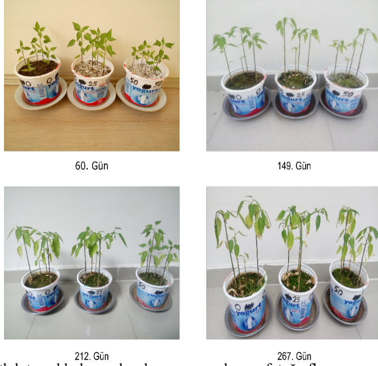
Şekil 5. PVC katkılı topraklarla yapılan deneme sonuçlarının fotoğrafları

267.Gün sonrası hava sıcaklıkları düştüğünden dolayı bitkilerde gelişme gözlenmemiştir. Ancak yaprakların kuruduğu ve %50 PVC'li topraktaki tek çiçeğin de kuruyup düştüğü belirlenmiştir. Yapraklar döküldükten sonraki ortalama boyları sırayla 16,8 cm – 16,0 cm – 15,5 cm olarak kalmışlardır. Ortalama fidan boyları PET denemelerinde ortalama 50 cm, UFR denemelerinde 25 cm iken bu deneyde 16 cm kadar olmuştur. PVC talaşları toprağı, PET denemelerinde olduğundan daha fazla havalandırdıkları halde, fidan boylarının ve biber veriminin düşük olmasının nedeni olarak PVC talaşlarının toprağı, her ne kadar ölçülmemiş olsa da, bozularak zararlı hidroklorik asit verdiği [21] şeklinde yorumlanabilir.