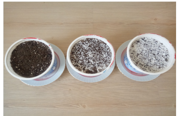
(d) PVC-Toprak Karışımları