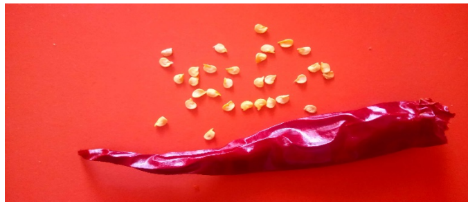
Şekil 1. Çalışmada kullanılan acı kırmızıbiber ve tohumları

Yapılan bu çalışmada bitki olarak, Artvin-Seyitler köyü çiftçilerince yetiştirilen acı kırmızıbiber kullanılmıştır. Yerel üreticilerden alınmış temiz, sağlıklı bir biberin tohumları çıkarılmış ve tüm denemelerde, bu biberin birbirine yakın büyüklükte olan tohumları seçilerek ekilmiştir (Şekil 1).