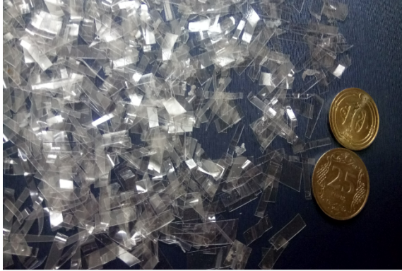
(a) PET Kesik Parçaları

PET, UFR ve PVC denemeleri zorunlu olarak farklı farklı zamanlarda yapılmıştır. Ne sonuç vereceği başlangıçta belli olmadığı için önce PET atığıyla denenmiş; iyi sonuç alınca azotlu gübre etkisi olabileceği düşünülen UFR atığıyla çalışılmış; bu daha iyi sonuç verince, bir defa da yapısı gereği olumsuz sonuç vereceği düşünülen PVC atığıyla denenmiştir. Bu nedenle de denemelerde mevsime bağlı olarak hava durumu ve köy arazisinden alınan toprak türleri de farklı farklı olmuştur. Bu çalışmanın amacı, tüm plastik atıklarının toprağa olan etkisini negatiften pozitif derecelendirerek sıralamak olmadığı, ancak «ön bir çalışma» olarak tek tek özelliklerini olumlu veya olumsuz olarak anlamak olduğu için; ayrı hava ve toprak olması çok sakıncalı görülmedi. Tüm plastiklerin etkisini negatiften pozitif sıralamak için yapılacak yeni bir çalışmada, toprak ve hava kesinlikle aynı olmalı, denemeler aynı zamanda başlatılmalı ve gelişimi takip etmek için çekilecek fotoğraflar da aynı zamanlarda alınmalıdır. Bu yaklaşımla, bu tekil denemelerde, PET'li topraklar, UFR'li topraklar ve PVC'li topraklar birbirlerinden farklı olsa da, üç "PET-Toprak Karışımı" kendi içinde aynı toprak, üç "UFR-Toprak Karışımı" kendi içinde aynı toprak ve üç "PVC-Toprak Karışımı" da kendi içinde aynı toprak olarak kullanılmış ve «ön bir çalışma» olarak tekil örneklerde ayrı ayrı toprak kullanılması bir eksiklik olsa da çok sakıncalı görülmemiştir.