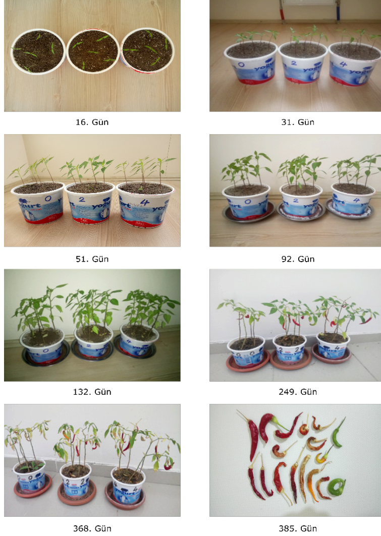
Şekil 4. URF katkılı topraklarla yapılan deneme sonuçlarının