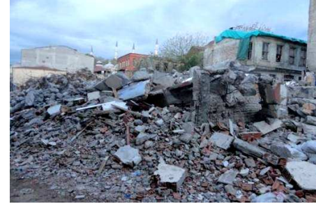
Resim 5 – 6: Hızlanan yıkımlar, kazanılan arsalar ve açık uçlu gelecek...

Süleymaniye 2006'dan itibaren başlanan süreçle Belediye ve KİPTAŞ'ın öncülüğünde, bina satın almalar yoluyla sürece dahil edilmiş ve KİPTAŞ görevlileri tarafından yapılan bilgilendirme toplantıları sonucu bir kısım mülk sahibiyle anlaşma sağlanmıştır. Tarihi eser durumunda olmayanların bir kısmı hemen yıkılırken, henüz yıkım yapılmayanlar, yetkililerin söylediğine göre işgalcilerden ve tinercilerden korumak için