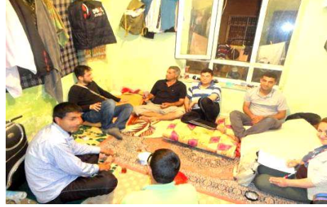
Resim 9 – 10: Bekâr Odası İç Mekan: Babalar-çocuklar, evliler-bekârlar...