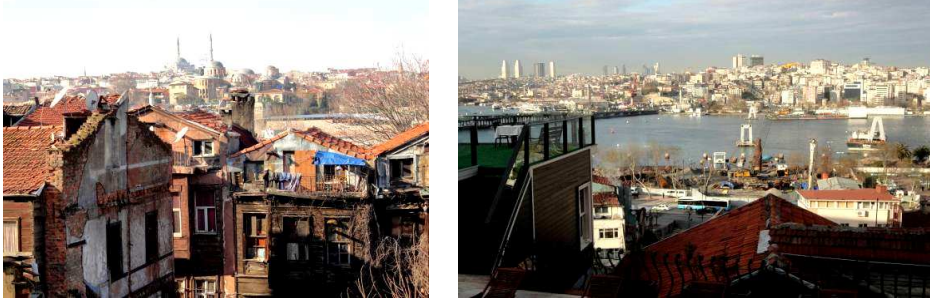
Resim 1 - 2: Kentsel Dönüşüm Bölgesi: "Tarih içinde, tarihe ve istikbale(!) bakıyor"

Süleymaniye Bölgesi'nin bir yandan içine düştüğü fiziksel-mekansal bozulmalar ve 'sefalet mahallesi' görüntüleriyle kamuoyu gündemine getirilmesi, diğer yandan UNESCO tarafından sık sık liste dışına çıkarılma uyarısının yapılması merkezi hükümet ve yerel yöneticileri acil müdahale edilmesi gerekli bir alan olarak Süleymaniye'nin ele alınması zorunluluğunu ortaya çıkarmıştır. Bu kapsamda 'bölgenin Osmanlılaştırılması' olarak da ifade edilen geleneksel-tarihi dokunun yeniden ihyası ile bölgenin geçmişte olduğu gibi prestijli konut ve insanların yaşadığı, 24 saat yaşayan ve kentin tarih-kültür-turizm potansiyelini yukarılara taşıyacak bir dönüşüm içine girme amaçlı 2005 yılında 'İstanbul Müze Kent Projesi'nin hayata geçirilme arzusu dikkat çekmektedir. Yine bu bağlamda 2004 yılında İstanbul bölgelere ayrılarak, bu alanlarda kentsel dönüşüm projelerinin başlatılması gündeme gelmiştir 3 .