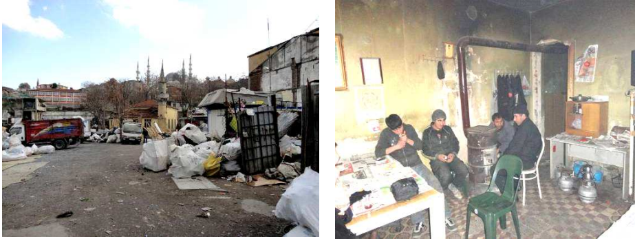
Resim 13 - 14: Kağıt depoları ve kağıt toplayıcılar

Bölgede, özellikle Hacıkadın Mahallesi'nden Küçükpazar boyunca devam eden ana caddenin aşağısı (deniz tarafı) ve İMÇ Blokları arasında kalan kısım fiziksel çöküntüleşmenin ve yıpranmış bina stoklarının en ileri düzeyde olduğu yer özelliğine sahiptir. Yakın zamana kadar çok sayıda göçmen nüfusu barındıran evler ve bekâr odalarıyla dolu olan yerlerde yıkılmaya yüz tutmuş, terk edilmiş ve yıkılmayı-yenilenmeyi bekleyen çok sayıda bina bulunmaktadır. Belli sokaklarda özellikle Doğu illerinden gelen göçmen aileler çoğunluktadır. Birkaç binada eskiden imalathane ve bekâr hanı olan yerlerin çöp toplayıcıların mekânı haline geldiği görülmektedir. Bir yerde çöp toplayıcılarının varlığı ve çoğalmasını, söz konusu alanın eski değerini büyük ölçüde kaybetmesi - ekonomik olduğu kadar sembolik olarak da okunabilir - ve binaların-arsaların kullanım/fonksiyon biçimlerindeki aşırı değişimin kanıtı olarak görmek mümkündür. Bu durum, aynı zamanda, bölgenin çöküntüleşmesini ve düzeyini de ele verecek bir anlam içermektedir.