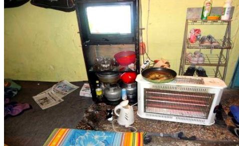
Resim 11 – 12: Bekâr Odası İç Mekan: Minyatür evler ya da bir göz odaya sığdırılanlar

İşyerlerinde yatanlar bir diğer kesimi oluşturmaktadır. Özellikle fırınlarda ve imalathanelerin bir kısmında bu duruma rastlanırken, kağıt toplayıcılar ve hurdacıların tamamı kağıt depolarını hem işyeri hem de barınak olarak kullanan en kalabalık nüfusu oluşturmaktadır.