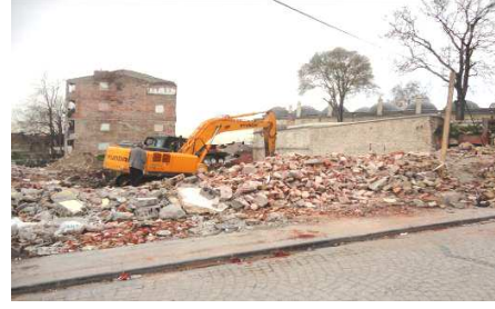
Resim 3 – 4: Tarihi eserler dışında "dümdüz" edilen sokaklar!