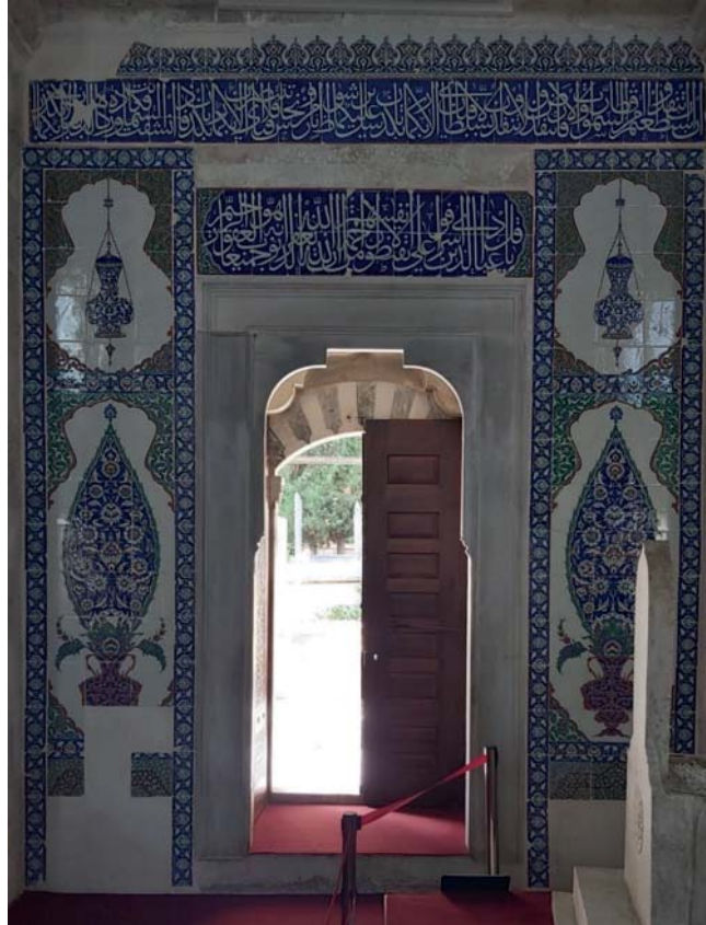
Fotoğraf 7. Siyavuş Paşa Türbesi girişinde çini panolar ve kitabeler.

Panoların üstünde iki satır halinde lacivert zemin üzerine beyaz celi sülüs ile Kur'an-ı Kerim'den ayetler yer alır. En üstte ise tek şerit zencerek ve içi rumi dolgulu tepeliklerin meydana getirdiği taç bordürleri kompozisyonu tamamlar. (Fotoğraf 7)