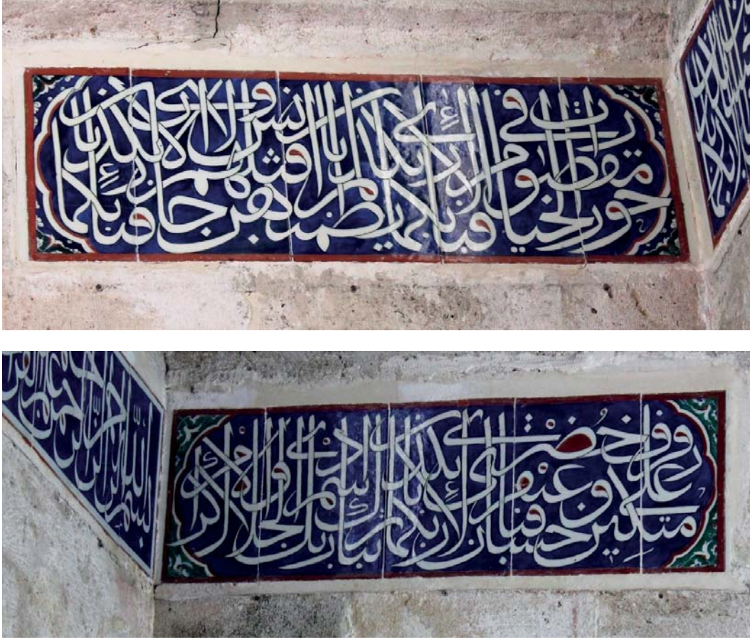
Fotoğraf 9-10. Siyavuş Paşa Türbesi'nde yazı şeridinden bağımsız iki âyet kitabesi.

Siyavuş Paşa Türbesi'nde altı adet mermer nişin içerisi farklı yapılarda da kullanılmış olan devşirme çiniler ile doldurulmuştur. (Fotoğraf 12-13)