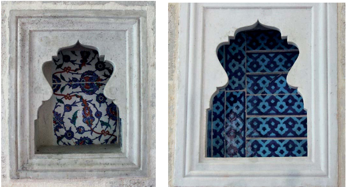
Fotoğraf 9-10. Siyavuş Paşa Türbesi mermer nişler içerisinde devşirme çiniler.

Siyavuş Paşa Türbesi'nde altı adet mermer nişin içerisi farklı yapılarda da kullanılmış olan devşirme çiniler ile doldurulmuştur. (Fotoğraf 12-13)