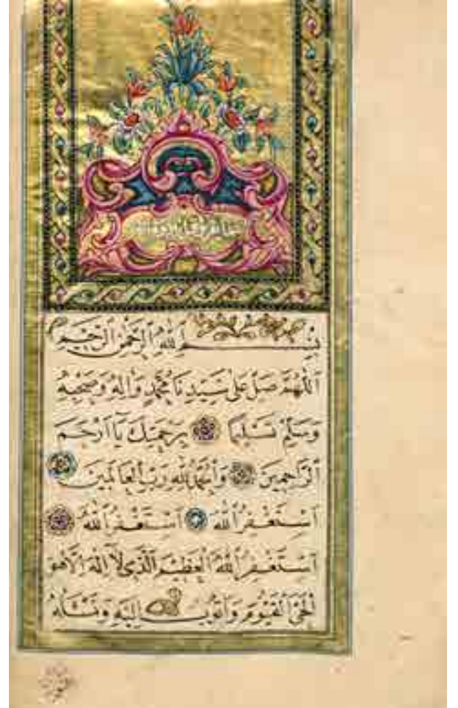
Görsel 3 Unvan Sayfası Başlığı (Digital SSM) (v. 1b)

Daha sonra eser Fatıha ve En'am (y. 2b-3a) sûreleriyle devam etmektedir. Bu sayfalar serlevha formundadır. Eserin diğer