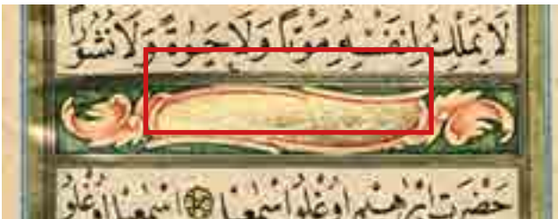
Görsel 2 Eserdeki müzehhib imzası, Zehhebehû es-Seyyid Ahmed (Digital SSM) (v. 111b)

(1955), Hezargradî zâde Seyyid Ahmed Ataullah Biyografisi ve Eserleri başlıklı yazısında şu sözlerle bu tespiti doğrulamıştır: "Faideli bilgileri hafızasında tutmakla meşhur, zihinde Türk tezyinat ve yazı sanatının adetâ ayaklı Ansiklopedisti olan hattat İsmail Hakkı Altunbezer de, Seyyid Ahmed diye meşhur olanın Hezargradî zâde Seyyid Ahmed olduğunu tevsik etmiştir."