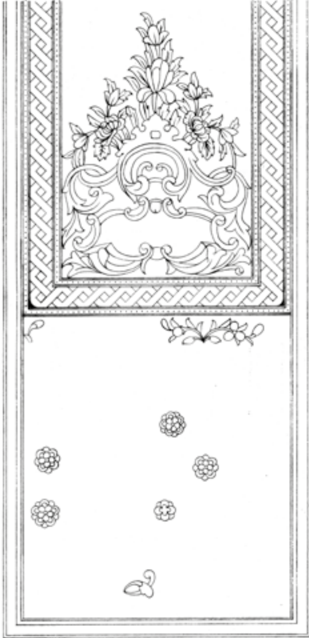
Görsel 4 Unvan Unvan Sayfası Başlığı (Ocakdan, 2019, s.181)

unvan sayfalarına nazaran süslemeler daha farklı renklerde. Beyaz, mavi ve kırmızı renkler kullanılmıştır. Durak süslemeleri de aynı renk tonlarındadır. Besmele keşidelerinin üzeri ve serlevhanın taç kısımları natüralist çiçek süslemeleriyle bezenmiştir. Rokoko üslubunda çiçekli ve oldukça renkli bir bezeme söz konusudur. Simetrik ve iki boyutlu bir çizim olmasına rağmen sanatkar, tasarımına derin bir görünüm vermiştir. Mimaride çeşme süslemelerinde görülen mermer üzeri rokoko işlemlerine benzemektedir (bkz. Görsel 5).