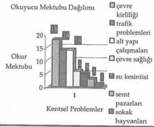
Grafik 1: Akdeniz Atılım Gazetesi Özel Hat Köşesinde Yer Alan Okuyucu Mektuplarının Kentsel Sorunlara Göre Dağılımı

ÖZEL HAT'ta gündeme getirilen konular yer alış yüzdeleriyle birlikte şöyle sıralanmaktadır; çevre kirliliği ile ilgili problemler % 18, trafik problemleri %14, alt yapı çalışmalarıyla ilgili problemler % 14, çevre sağlığı ile ilgili problemler % 6, şehirdeki su kesintileriyle ilgili problemler % 5, semt pazarlarıyla ilgili problemler %3 ve sokak hayvanlarıyla ilgili problemler %1'dir. Gazetenin kadrosunda yer alan köşe yazarlarının yanı sıra konusunda uzman olan kişilerinde kentsel sorunlarla ilgili köşe yazılarının yer aldığı görülmektedir