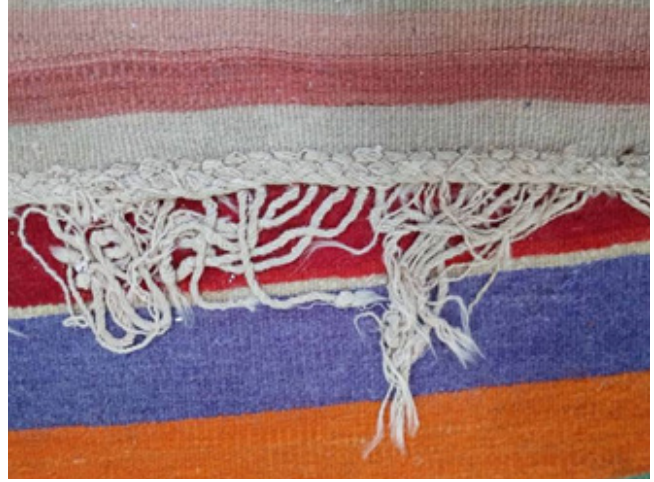
Fotoğraf 11: Toka Örgüsü ve Bükme Örgü (Sultan Sökmen, Çameli, 2019)