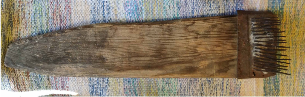
Fotoğraf 5: Yün Tarağı (S. Sökmen, Çameli Cevizli Mahallesi, 2019)

3.2.3. Yün Tarağı: Kemik saplı ve demir dişli bir alettir. 23 Çameli yöresinde kullanılan yün tarağı örneği fotoğraf 5’de görülmektedir.