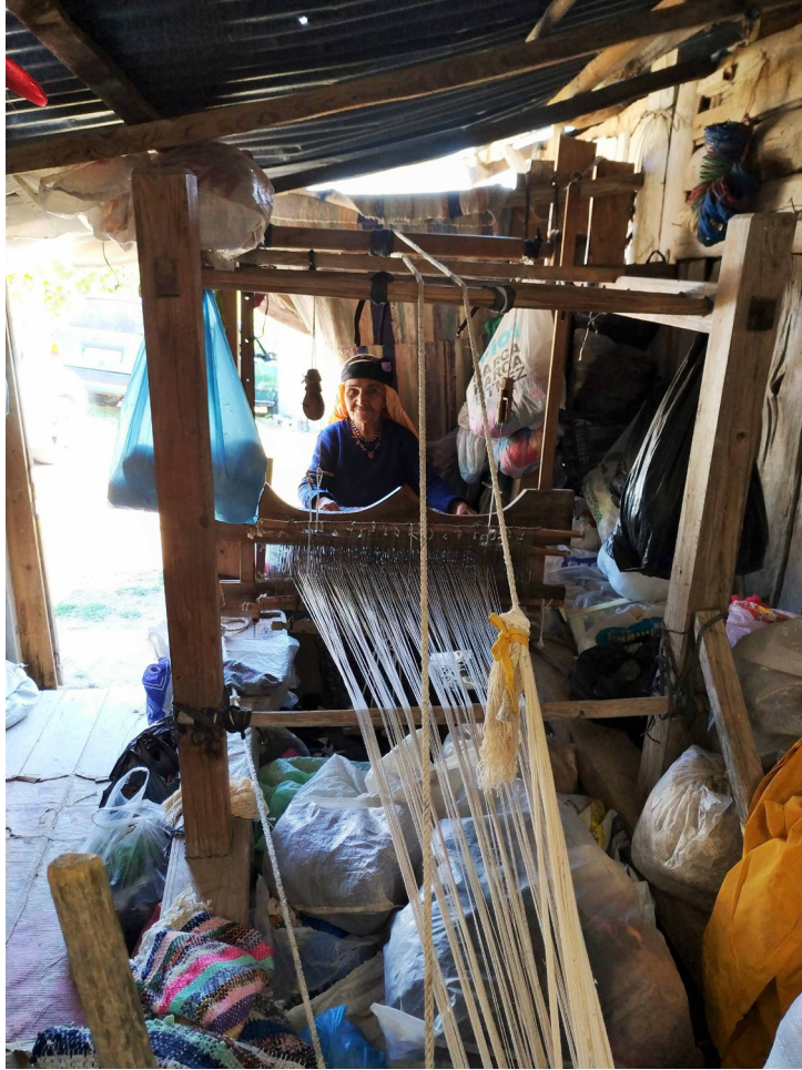
Fotoğraf 3: Durkadın Öğüt'e ait Mekikli Dokuma Tezgâhı (S. Sökmen, Cevizli Mahallesi Şervin Mevki, 2019).

Gücüler çirşlenerek kayganlığı ve dayanıklılığı arttırılmış pamuk ipliğinden oluşur. 20 Kilimler düvende parçalar halinde dokunup çatki dikişii ile birleştirilmektedir (Fotoğraf 10). Yörede düvende dokunup birleştirilen bu dokumalara “erhem” denilmektedir. 21