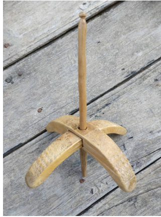
Fotoğraf 7: Kirmen(S. Sökmen, Cevizli Mahallesi Şervin Mevki, 2019).

3.2.5. Kirmen: İp eğirmek için kullanılan, yaklaşık 20-25 cm uzunluğunda, bir çubuğa (+) şeklinde geçirilmiş, iki ahşap parçadan meydana gelen alettir (Fotoğraf 7). 25