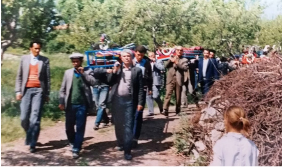
Fotoğraf 1: Çameli'de 1986 yılında çekilmiş bir fotoğrafta cenaze merasimi.

Fotoğraf 1'de Çameli ilçesinde 1986 yılında çekilmiş cenaze töreni fotoğrafında, cenazelerin kilime sarıldığı, sal denilen tabutlarda taşındığı görülmektedir. Cenazeden sonra kilimler camiye vakfedilmektedir. Fotoğraf 2'de Çameli Kolak mahallesi camisinde tespit edilen bir kilimde "Ayşe Erdoğan ölümlüdür camiye sonra atıverin" yazısı bu kilimin yöre tabiriyle "Ayşe Erdoğan'ın ölümlüğü" yani ölümlük kilimi olduğu ifade etmektedir.