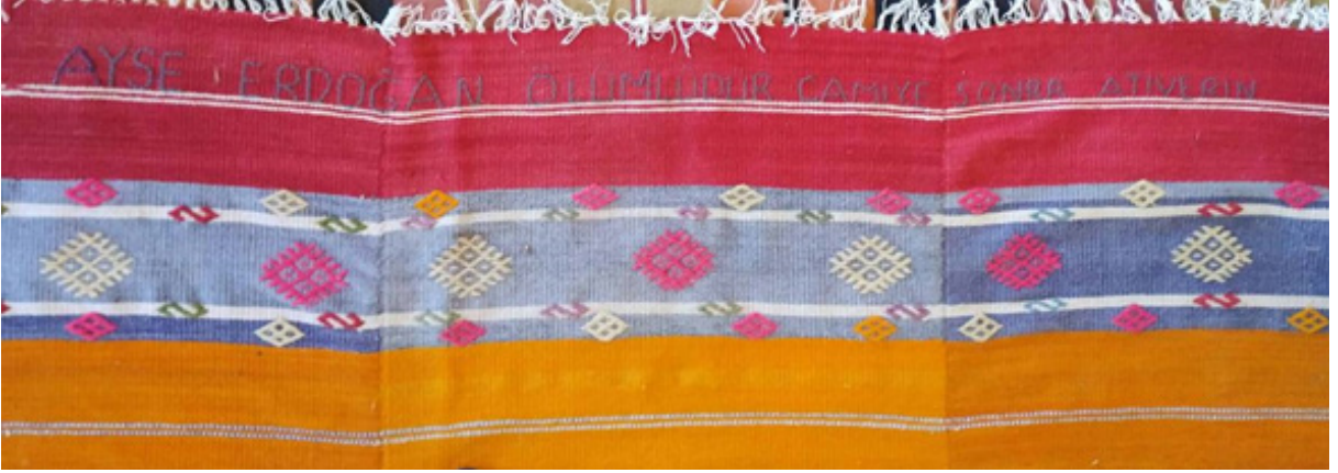
Fotoğraf 2: Ayşe Erdoğan'a ait ölümlük kilim (S. Sökmen, Çameli Kolak mahallesi camisi, 2019).