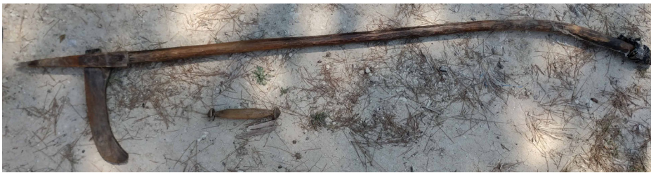
Fotoğraf 8: Yay ve Tokmağı (S. Sökmen, Cevizli Mahallesi Kavalcılar Mevki, 2019).

3.2.6. Yay ve Tokmağı: Kırkılıp temizlenmiş yün liflerin birbirinden ayrılması için yay ve tokmağı kullanılır (Fotoğraf 8). Ağaçtan yapılmış yaya, yörede kiris adı verilen ve keçi bağırsağından yapılmış ip takılır. Tokmak ile kiris vurularak ipi oynattıkça yün kabartma işlemi gerçekleştirilir. 26