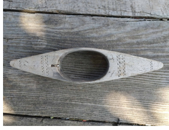
Fotoğraf 6: Mekik (S. Sökmen, Cevizli Mahallesi Şervin Mevki, 2019).

3.2.5. Kirmen: İp eğirmek için kullanılan, yaklaşık 20-25 cm uzunluğunda, bir çubuğa (+) şeklinde geçirilmiş, iki ahşap parçadan meydana gelen alettir (Fotoğraf 7). 25