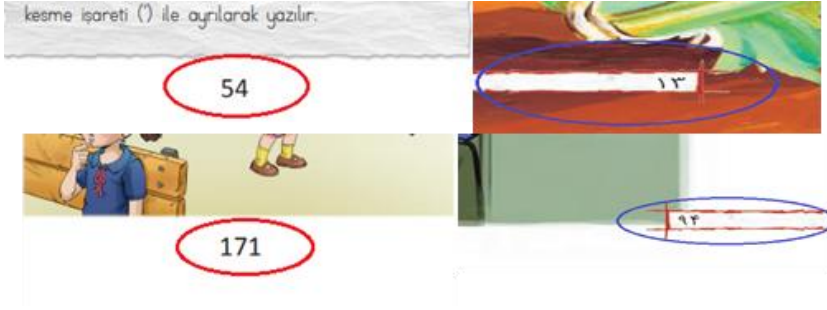
Görsel 6. Sayfa Numarasının Ayrı Bir Tasarım Ögesi Olarak Düzenlenmesi

olarak belirtilmiştir. Bu farklara ilişkin örnekler Görsel 6 ve Görsel 7’de sunulmaktadır.