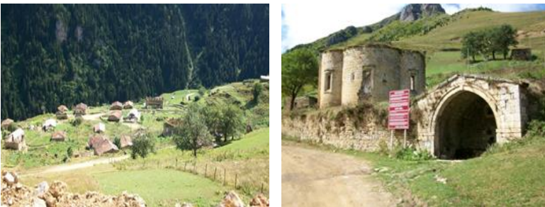
Fotoğraf 10-11. Santa Harabeleri (Piştovlu Mahallesi), Piştovlu Kilisesi.

Santa kelimesi (Sandon, Sandan, Santas), Luvicede “kutsal, kutlu, güzel” anlamlarına gelen ve Luvi baş tanrılarında birisinin de adı olan bir kelimedir (Umar, 1993’ten akt. Doğanay ve Doğanay, 2016: 490). Ayrıca Kültepe’de tanrı isimlerinin geçtiği Zarpiya ritüelinde ve isimler listesinde Santa ismi de tespit edilmiştir. Bir savaş tanrısının ismi olan Santa “kızgın olmak” anlamına gelmektedir (Pekman, 1970’ten akt. Bardakçı, 2019: 99). Santa, bugünkü ismi ile Dumanlı köyü, Gümüşhane Merkez ilçesi sınırları içerisinde, Yanbolu vadisinin yukarı kısımlarında yer alan eski bir Rum yerleşimidir. Kuruluş tarihiyle ilgili kesin bir tarih bulunmasa da buradaki ilk yerleşmenin Orta Çağ’da olduğu düşünülmektedir (Doğanay ve Doğanay, 2016: 490). Nüfus yoğunluğunun 17. ve 18. yüzyıllarda artış gösteren Santa 19. yüzyılda en parıltılı dönemini yaşamış ve 1923 yılında nüfus mübadelesi sonrasında büyük oranda boşaltılmıştır (Bingöl, 2007: 396). 1999 yılında 3.Derece Arkeolojik ve 1.ve 3. Derece Doğal Sit Alanları olarak tescillenen yerleşim 9 mahalle ve 300’ün üzerinde yapıdan oluşmaktadır. Santa yerleşimindeki önemli mahallelerden bazıları Binatlı, Terzili, Zurnacili, Piştovlu, İşhanlı, Çinganlı, Çakallı mahalleleridir. Her mahallede bir adet tescilli kilise bulunmaktadır (Gümüşhane Valiliği İl Kültür ve Turizm Müdürlüğü, 2016: 217).