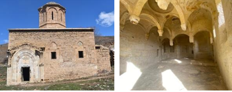
Fotoğraf 1-2. İmera (Olucak) Manastırı, Çakırkaya Manastırı.

planda yapılmıştır. İç mekânda birbirine yuvarlak kemerlerle bağlanan üç nef bulunur. Kilisenin üst örtüsü doğu-batı yönünde uzanan beşik tonuz ile örtülmüştür. Naosun üzeri ise oyularak şekillendirilen kubbe ile örtülüdür. Kilisenin içerisindeki sütunların büyük çoğunluğu kırılmış ve sütunların yalnızca tavanla bağlantı sağlayan üst kısımları kalmıştır (Gümüşhane Valiliği İl Kültür ve Turizm Müdürlüğü, 2016: 299).