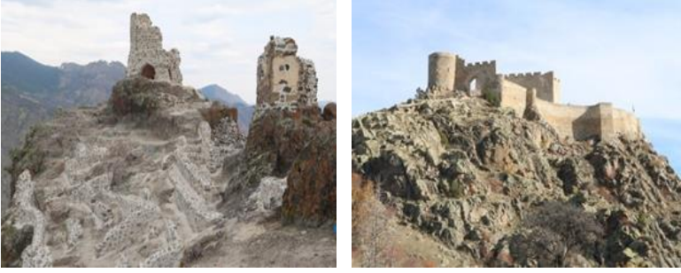
Fotoğraf 5-6. Canca Kalesi, Kov (Esenyurt) Kalesi.