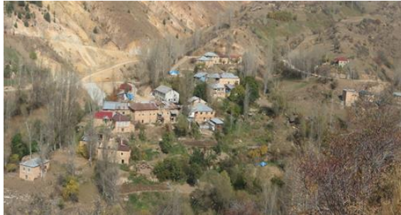
Fotoğraf 7. Krom Vadisi Bulutyayla Yerleşimi Genel Görünümü.

Kuruluş tarihi hakkında kesin bir bilgi bulunmayan Krom vadisi yerleşimi farklı kaynaklardan Kurum, Gorom, Korom, Gurom, Kromni gibi farklı birçok isimle anılmaktadır (Erüz, vd., 2016: 188). 2010 yılında 3. Derece Arkeolojik Sit Alanı olarak tescillenen Krom Vadisi, Gümüşhane Merkez ilçesinin 60 km kuzeyinde yer alan, Yağlıdere köyünde bulunmaktadır. Döneminin önemli yerleşim yerlerinden olan Krom Vadisi İmera (Olucak) ve İstavri (Uğurtaş) köyleri arasında yer almaktadır. Çiğdem vd.'nin 2002 yılında Gümüşhane ve Bayburt illerinde yürüttükleri yüzey araştırmasında Krom Vadisinde tespit edilen kültür varlıklarının Orta Çağ'a tarihlendirildiği ifade edilmektedir (Çiğdem, vd., 2002: 169). Tescilli 22 kilise, 1 kale ve 1 köprü bulunan (Gümüşhane Valiliği İl Kültür ve Turizm Müdürlüğü, 2016: 222) vadiye 1583 yılında işletilen bir maden ocağının varlığından söz edilmektedir (Erüz, vd., 2016: 190).