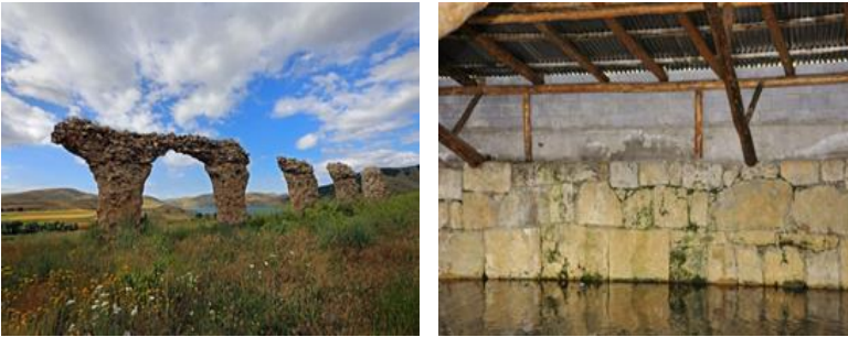
Fotoğraf 13-14. Satala Antik Kenti Bazilika, Satala Antik Kenti Su Sarnıcı.