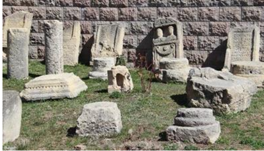
Fotoğraf 12. Gümüşhane Müzesinde sergilenen Satala Antik Kenti eserleri.

1988 yılında 3. Derece Arkeolojik Sit Alanı olarak tescillenen Satala Antik Kenti, Kelkit İlçesinin 26 km güneydoğusunda Sadak köyünde bulunmaktadır. Roma İmparatorluğunun doğu sınırını korumak amacıyla Anadolu'da kurulan ve Melitene (Malatya), Somasata (Samsat) ve Zeugma (Gaziantep) gibi önemli dört garnizondan birisi olan Satala'nın hangi dönemde kurulduğuna dair kesin bilgi bulunmamakla birlikte kuruluş tarihi ile ilgili farklı görüşler ileri sürülmüştür (Şenocak, 2014: 77; Mimirolu vd., 2019: 3585). Bu görüşlerden ilki imparator Nero döneminde Doğu seferinde kurulduğu yönünde ve diğer bir görüş ise imparator Caesar döneminde Pontus Krallığı ile yapılan mücadeleler esnasında kurulmuş olabileceği yönündeki görüşlerdir (Çiğdem, 2008: 76; Çiğdem, 2012: 111). 2018 yılında nekropol alanında yürütülen kazı çalışmalarında ele geçen Helenistik Döneme ait bronz bir sikke, Satala Antik Kentinde Erken Helenistik Dönemde de yerleşimin olduğunu göstermektedir (Yıldırım, 2020: 583). 2017 yılında başlatılan kazı çalışmaları günümüzde de devam etmektedir. Kentte hamam, su sarnıcı, kale, bazilika gibi birçok kültür varlığı bulunmaktadır.