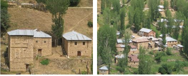
Fotoğraf 8-9. Krom Vadisi Bulutyayla Evleri ve Yerleşimi.