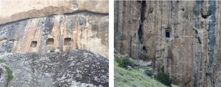
Fotoğraf 3-4. Araköy Kaya Mezarları, Özen Köyü Kaya Mezarları (Yazar Arşivi).

Gümüşhane il sınırları içerisinde 2 adet tescilli kaya mezarı bulunur. Bunlardan ilki olan Araköy Kaya Mezarları, 2009 yılında 1.Derece Arkeolojik Sit alanı olarak tescillidir. Gümüşhane ilinin Şiran ilçesinin 21 km kuzeybatısında yer alan Araköy Köyü'nde yer almaktadır. Büyük bir ana kayanın ortasına denk gelecek şekilde yaklaşık aynı ölçülerine sahip, yalın ve iki kademe silmesi bulunan üç nişten oluşmaktadır. İldeki bir diğer kaya mezarı ise Kelkit İlçesi, Özen köyü sınırları içerisinde bulunan Özen Köyü Kaya Mezarlarıdır. Bu mezarlar 2001 yılında tescillenmiştir. Araköy Kaya Mezarları gibi Özen Köyü Kaya Mezarları da ana kayanın orta kısmında yaklaşık 25 metre yükseklikte, 1 m 2 alana sahiptir. İki kademe silmesi bulunan bir nişten oluşmaktadır.