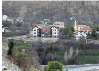
Fotoğraf 15-16. Süleymaniye Mahallesi Rum Okulu, mahallenin genel görünümü.